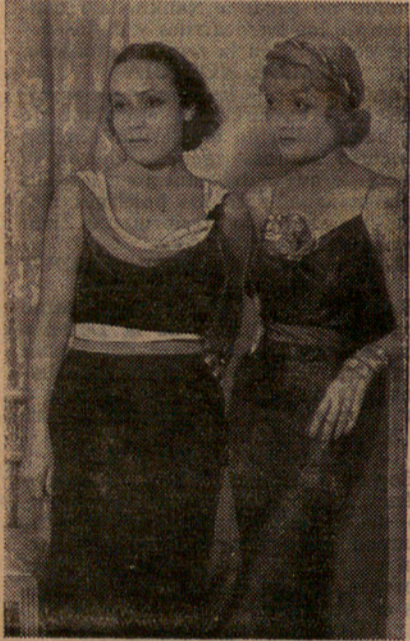
Dolores del Río i Constance Bennett en un ball dels artistes de cinema celebrat a Hollywood, darrerament celebrat amb motiu de l'any nou.

Annabella, en su papel de "Juana", nos ofrece con delicada feminidad un tipo de mujer candorosa y amante, que forma un notable número de circo con "Jorge" (Fernand Gravey) y "Pedro" (Jean Gabin). Estos artistas, después de grandes sacrificios, miserias y peregrinaciones pueblerinas, logran debutar en París, su sueño dorado. Pero cuando la gloria y el bienestar comienzan a sonreírles, en sus almas se desencadenan las pasiones, ya que ambos hombres, enamorados de su gentil compañera, se convierten de cariñosos camaradas en irreconciliables rivales. El rencor de Jorge al sentirse preterido, es terrible, y en su mente nace la idea de venganza, que llevará a cabo cuando "Pedro" se lance desde su trapecio para ser recogido por él, que lo dejará caer sin compasión. En dramática escena, un oportuno desmayo de "Juana" impide se lleve a cabo el criminal intento, separándose "Jorge" definitivamente de sus amigos, comprendiendo la abnegación de ambos y el de-