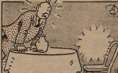
Una cura d'aprimament.