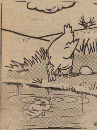
El peix: — Perquè escatainar tant per un sol ou. Quan yo faig ous, en faig 10.000 a la vegada.