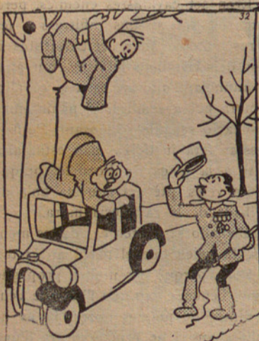
—Dispensin senyors; no hauran vist per casualitat a un tigre real bengalí passar per aquí?