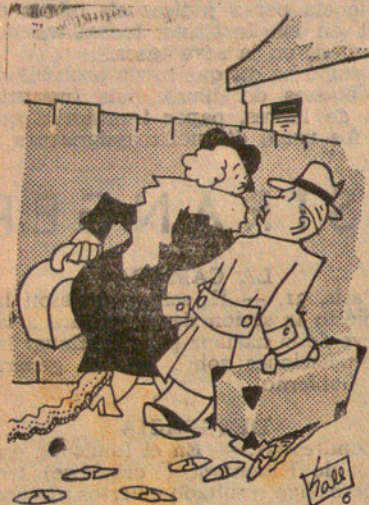
Quan passis per la Duana fes la distreta.