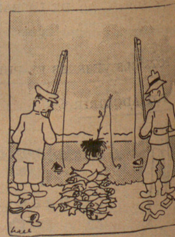
La sort és llunàtica

—Miri, senyo rvigilant; és que volia adornar el llum una mica, perquè és davant de casa.