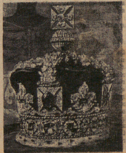
La corona anglesa, que Eduard VIII canviaria per l'amor d'una dona. Bé val la senyora Simpson una corona.