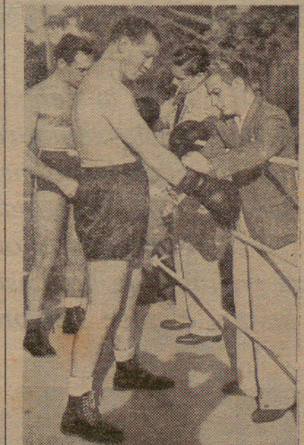
EL PROXIM ADVERSARI DE JOE LOUIS

l'ex ministre de l'exterior d'Anglaterra, que ara té temps per a cultivar el seu esport favorit com a patinador. Novament ha tornat a la seva residència de Suïssa i aquí el tenim disposat a fer una exhibició del seu esport davant la seva esposa.