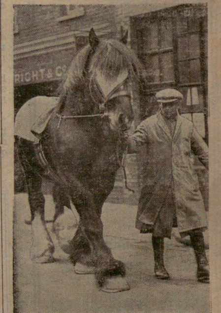
El cavall mascle del rei Jordi

"Llegint el llibre "Excursionisme i Ciutadania" del nostre preuat amic En F. Pujol i Alguero, ens ve bé per a recordar avui una obra d'un incalculable empordanès, obra que, si no resta ignorada per tothom, ho és per molts dels excursionistes que visiten l'Empordà.