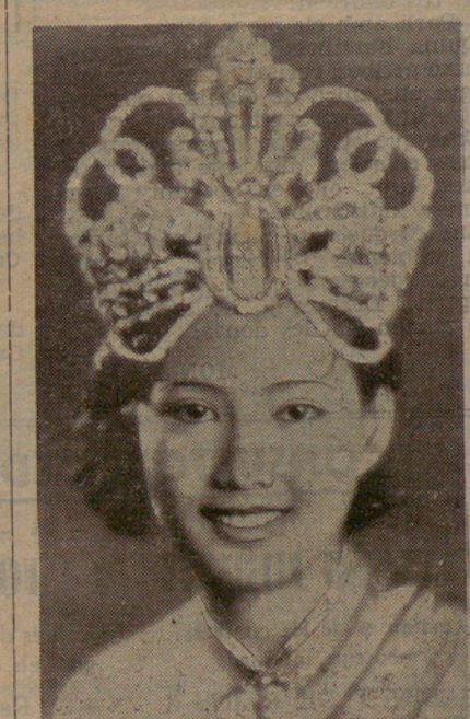
La reina de belleza de Siam

Fernández Flórez, literariament és un buen escritor, pero políticamente es una birria. Esto ya lo hemos dicho varias veces, y, además, agregaremos ahora que de la cosa pública no tiene ni la menor idea, siendo los conceptos por él expresados de la más acuada ramplonería y de la más soporífera vejez. Es un inútil, un tullido dentro del periodismo político. No le va ese arte, o esa gramática parda, al humorista gallego. Claro que ello no es censurable, ni puede serlo, pero no así el cambiar de opinión, de criterio, según la dirección del viento. Porque el ayer panegirista desbordado de Gil Robles, hoy embiste contra él en "La Vanguardia" despiadadamente. Todo eso y mucho más se lo merece el inexperto y ególatra muchacho de la CEDA, pero no es el indicado para censurárselo Fernández Flórez después de haber escrito en el "A B C" en honor y gloria de Gil las más epilépticas alabanzas. Y de otra parte, es mezquino y del peor gusto