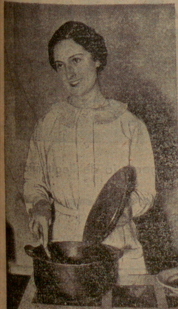
La miller serventa de França