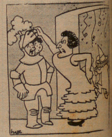
—Hum—me ho figurava.