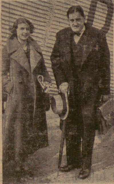
El cap de la premsa d'Alemanya

Heus ací el coronel nordamericà Moore, el qual té 85 anys d'edat i és un ajudant del famós Buffalo Bill, en la guerra civil i en les lluites amb els índies.