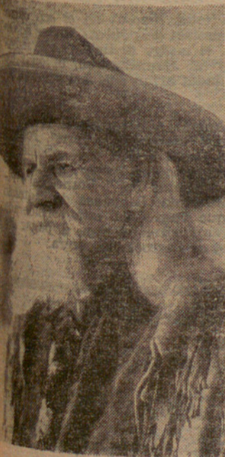
Un personatge gairebé de llegenda