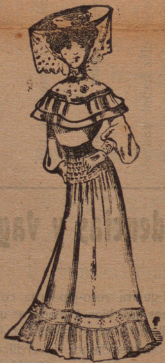
TRAJE PARA PLAYA

Ligero y vaporoso. Doble cuello floreado y encajonado; cuerpo liso; cinturón de seda negro; manga ahuecada. Falda cuyos adornos al principio y al fin hagan pendant .