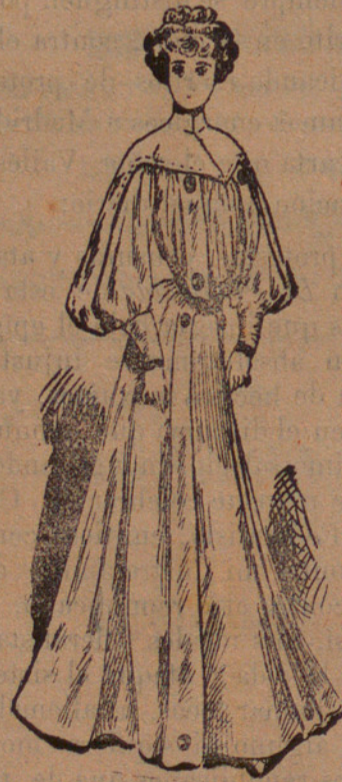
Traje para casa

De pañete azul marino. Cuerpo y mangas caídas. Ocho grandes botones de terciopelo negro; dos en la parte superior del pecho, dos poco antes de la cintura, dos después de ésta y dos en la extremidad de la falda, en la que hay un gran delantero en toda su extensión. La especialidad de este traje es el cuello, que se prolonga hasta el final de la manga.