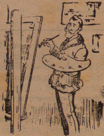
El ex-presidente pintando su último cuadro El ejército conservador desalojando el ministerio para dejar paso á los frailes.