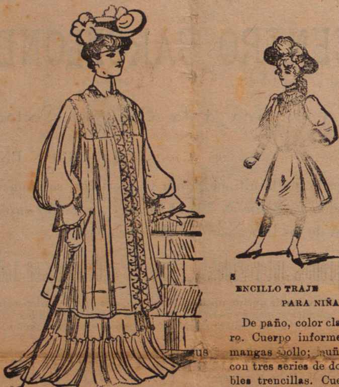
ABRIGO, FORMA «TAILLEUR» Largo y recto. Manga bollo; peto-cuello anchísimo con adornos iguales á los que cierran la prenda.