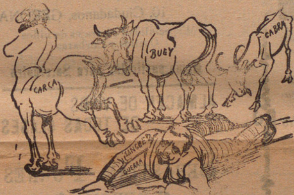
Enfermedad que figurará en la historia

La primera víctima del gloriosísimo Ministerio Maura y Compañía (Corazón de Jesús) Martirio del beato y angélico Sanchez Guerra, socio de la protectora de animales y despedazado por los animales mismos á quienes defendió sin la protección de nadie.