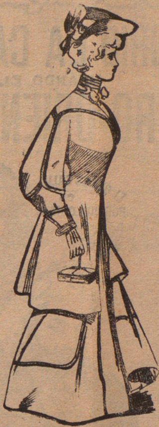
Traje corte sastre, de paño marrón.

Gabán largo atreñillado. Trencillas cruzadas en cuello, mangas y puños. El mismo adorno en la falda.