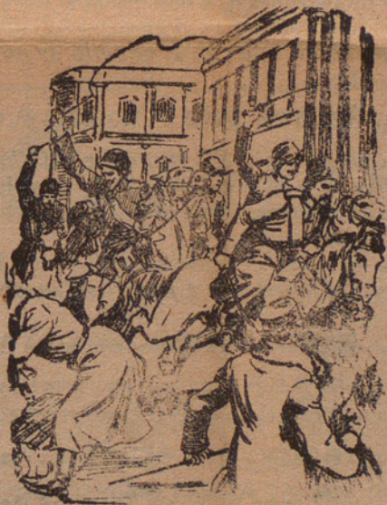
Disturbios en San Petersburgo.

Un escuadrón de cosacos cargando contra los partidarios de las reformas liberales dentro de la Constitución rusa.