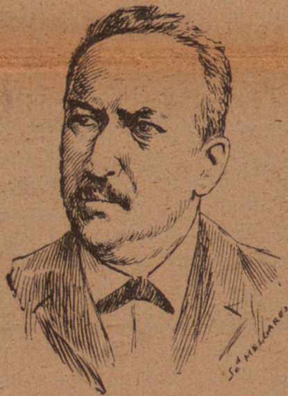
D. Juan Pedro Barcelona

Uno de esos jóvenes modernistas, que vino al campo de la política oficiando de revolucionario, ha terminado su vida política con el asesinato de un insigne periodista.