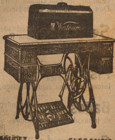
SÓLIDEZ ELEGANCIA PATENTE 52387

De los trabajos publicados serán responsables sus autores