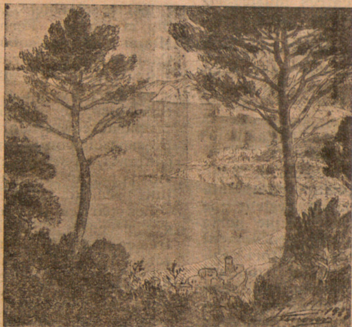
L L A F R A N C - M A R I N A