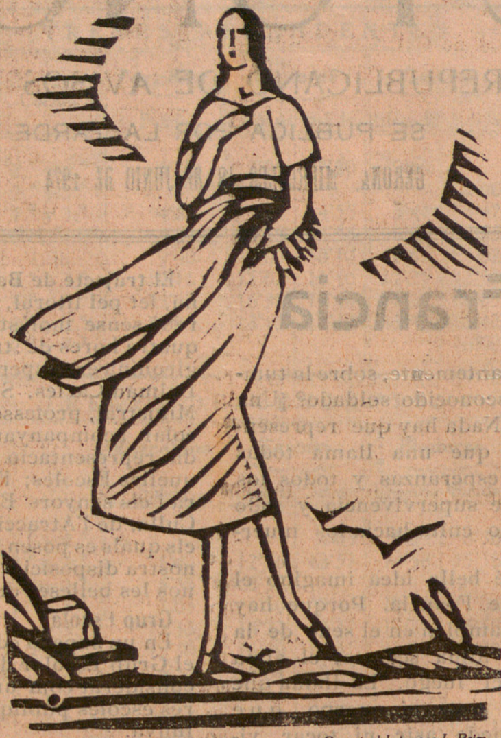
Grauat al bois, per J. Prim.

En tant, el sol, tombat rera la carena, marca ratlles sanguinoses en el cel, i el misteri de l'hora — que sembla volar per l'aire com un borralló d'inquietud — va teixint en l'esperit de Maria-Elena la dolça terenyina de la melangia.