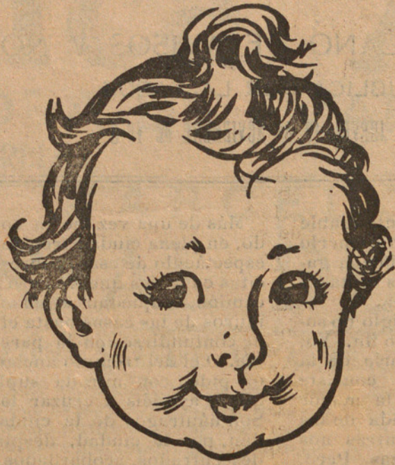
Venda a les farmàcies

—SE VENDE por asuntos de familia un establecimiento de vinos en sitio céntrico y bien instalado de Figueras. Razón en esta Administración.