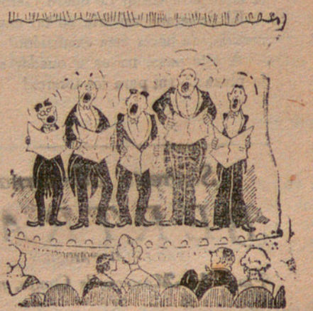
Unos maestros cantores que ofrecen concurso para un número de Ferias.

Pero que "Azorín" — el cual ha compartido la gloria literaria durante mucho tiempo con Baroja, Unamuno, Valle-Inclán, etc. — descienda hasta el extremo