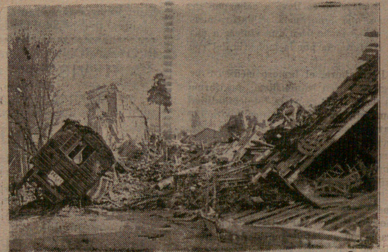
Francia. — La catástrofe del Mediodía. — Una de las calles de Moissac.