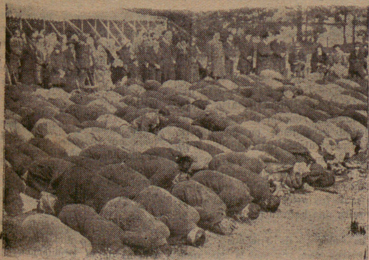
Londres. — Los musulmanes de Inglaterra rezando ante la mezquita de Woking, en las cercanías de Londres.