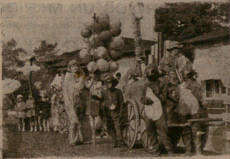
Filantropía original. — Vestidos de clowns y acróbatas, un grupo de personas de la alta burguesía californiana recorren los pueblos recogiendo fondos para los necesitados.