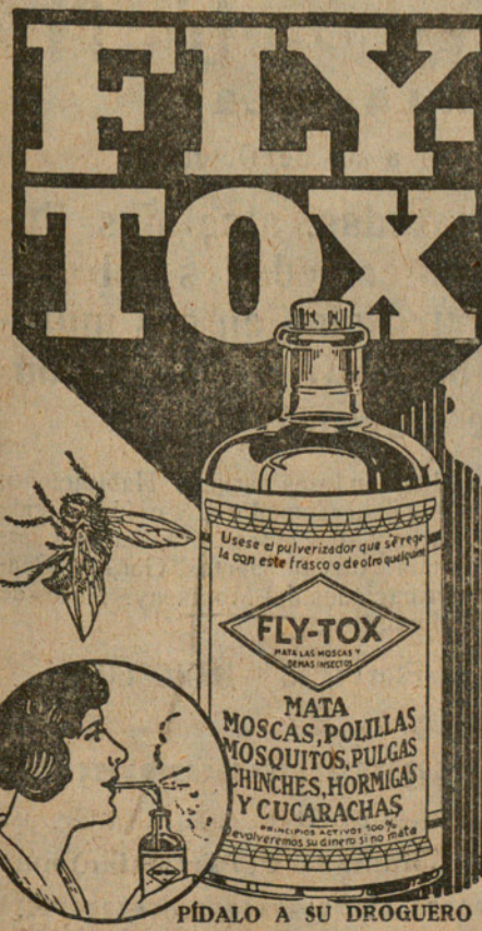
PÍDALO A SU DROGUERO

—El día 25 de los corrientes es esperado el general Martínez Anido.