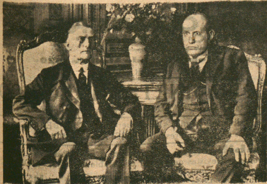
Mussolini i Chamberlain, en ocasió de la entrevista oficial que acaban de celebrar en Florença.