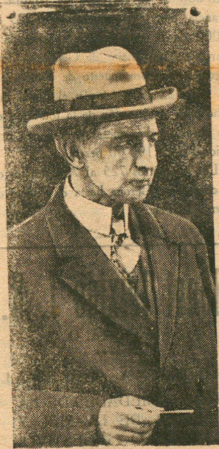
Mr. Dawes, exvicepresidente de los Estados Unidos, de quien se habla como probable Embajador de su país en Francia, en sustitución de Mr. Myron Herrick, recientemente fallecido.

Sus "Estudios sobre la criminalidad en Francia", que abarcan el período comprendido entre los años 1826 y 1878, permiten a Ferri defender victoriosamente la tesis de que el mayor rigor de la represión no es un recurso lógico para combatir la delincuencia. Sostiene, entonces, que la reacción violenta e intempestiva contra el momento criminoso debe ser