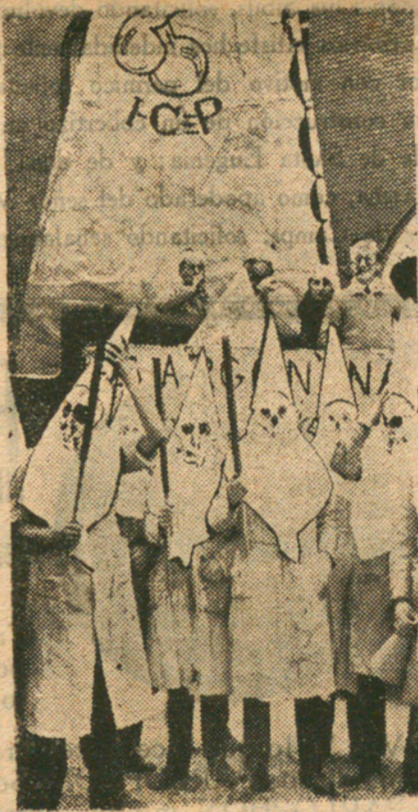
París. — El monomio anual d'elos estudiantes de química, en el barrio latino. Un grupo disfrazado con las capuchas del Ku-Klux-Klan.

Un gran tresor, doncs, de la novel·la francesa, que ningú no s'havia interessat en nosstrar, romaní intacte pels escriptors i editors catalans. Era una raresa, una anomalia inexplicable, si tenim en compte els autors de tercer i quart ordre que hom ha traduït, aquesta negligència per l'obra d'un dels novel·listes més llegits del món i que tots els idiomes s'han volgut fer seva, cobejosa d'assimilar-se la lliçó d'humanitat i d'universalitat que