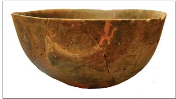
Figura 5. Detall de la ceràmica de tipus Montboló.

seguir més estabilitat, es va falcar amb un cercle de pedres col·locades al voltant de la fossa. Aquesta llosa cobria només una part del retall fet inicialment. A la part sud s'havien fixat diversos elements petris, entre els quals hi havia una llosa disposada verticalment, que sembla que tenia la funció de tancar l'estructura. Just a davant d'aquest darrer element es va documentar un nivell d'ús sobre el subsol en el qual es van recuperar els fragments d'una peça ceràmica de tipus Montboló, que va permetre confirmar l'adscripció cronològica d'aquesta construcció (fig. 4 i 5).