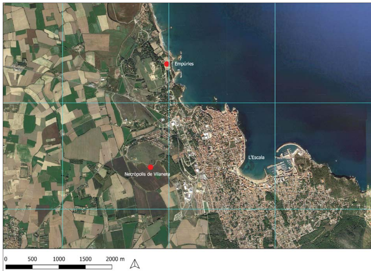
Figura 1. Localització del jaciment.

tombes. D'aquestes, se n'excavaren 62, la majoria conservant el dipòsit funerari, de manera completa o parcial. La necròpolis d'incineració es va caracteritzar per la presència de dos moments cronològics: un primer, amb escassa representació, adscrit a l'horitzó més antic del bronze final III (finals del II mil·lenni/inicis del I mil·lenni aC); i un moment posterior, amb un nombre més gran d'estructures, corresponent al ferro inicial i datat en ple segle VII aC.