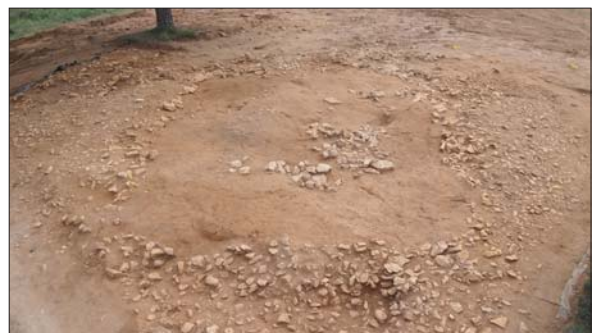
Figura 2. Vista general del túmul 2 des del costat nord, a l'inici de la intervenció. En aquesta imatge es veu clarament la capa superior que forma l'anell exterior de pedres.

Aquesta estesa superior de pedres presenta, als seus vessants, dues parts molt ben diferenciades, el vessant nord-est i el nord-oest, format per aquest pedruscall de sorrenques grogues i vermelles, i el vessant sud, format majoritàriament per calcàries locals, que està reutilitzat i amortitzat en cronologies posteriors per en-