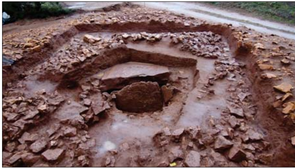
Figura 4. Vista general de les tres estructures: l'estructura megalítica inferior, el primer túmul i l'anell superior.