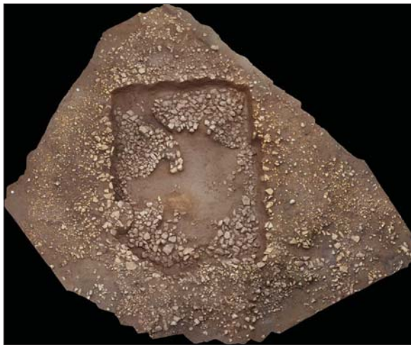
Figura 3. Detall de la capa/túmul inferior de pedres. Vista des del nord-oest.

Aquest túmul inferior deixava a la vista un espai central sense pedres. L'excavació va continuar en aquesta part central sense pedres, on una vegada extretes les sorres que aguantaven tota l'estructura tumular, van aparèixer l'estructura central i principal al voltant de la qual es construeix tota aquesta sobreestructura. Es tracta d'un element de característiques megalítiques format per una gran llosa calcària posada plana, recolzada sobre un anell de pedres, que cobreix un retall o fossa excavada al subsol. Aquesta llo-