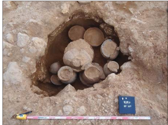
Figura 7. Detall d'una de les estructures del ferro I exhumada durant la campanya del 2018.

Els dipòsits funeraris continguts dins les fosses estaven formats, en la gran majoria dels casos, per un únic vas ossari de ceràmica a mà que contenia les restes de la incineració, cobert