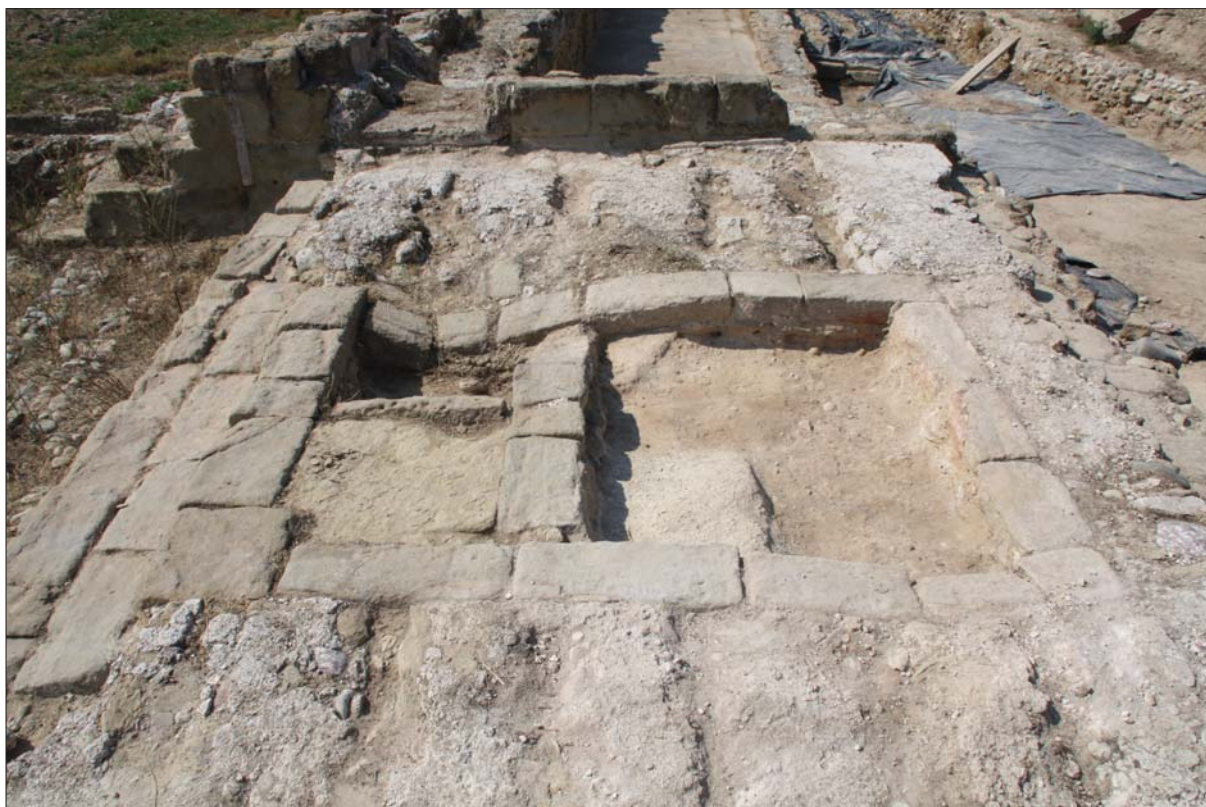
Figura 4. Detall de l'espai superior de la gran cambra.