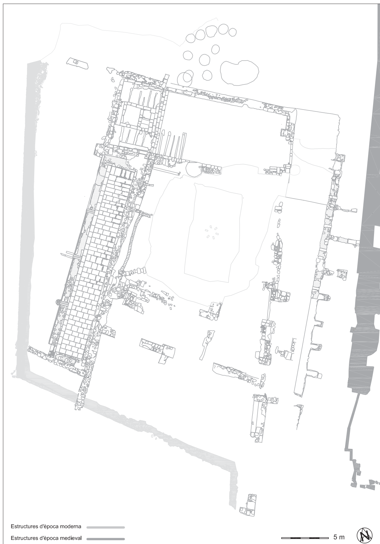
Figura 1. Planta general de la zona excavada al Castell Formós entre els anys 1983 i 2019. Planimetria: Carme Brusau. Museu de la Noguera.