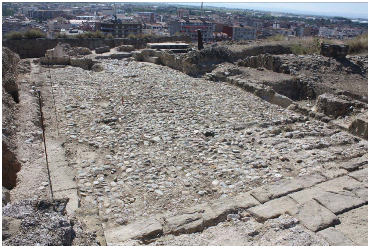
Figura 3. Gran cambra.