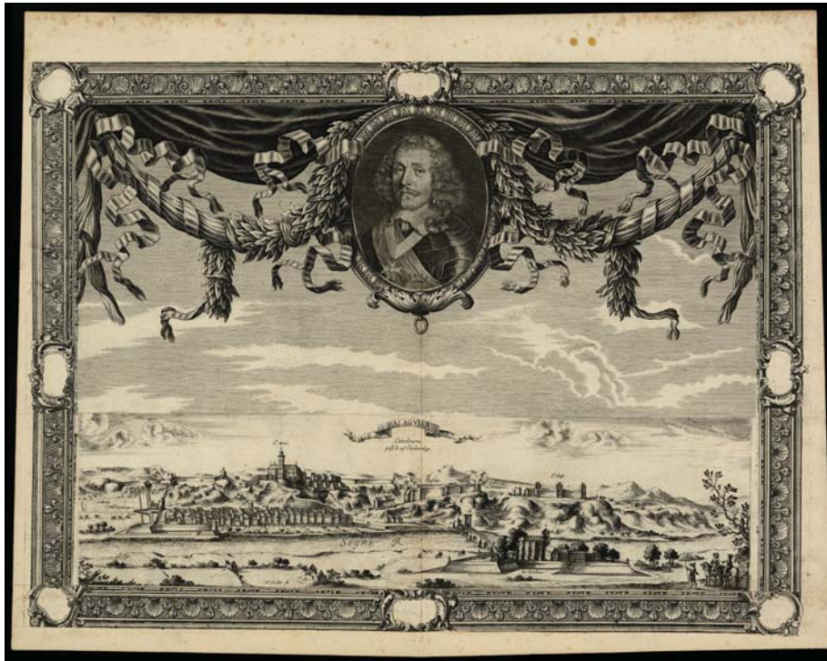
Figura 6. Balaguier, Catalogne, prise le 19 octobre 1645, Beaulieu - Nicolas COHIN (grav.), Paris, 1676. Fons d'art de la Paeria de Balaguer, núm. d'inventari MN 2338.