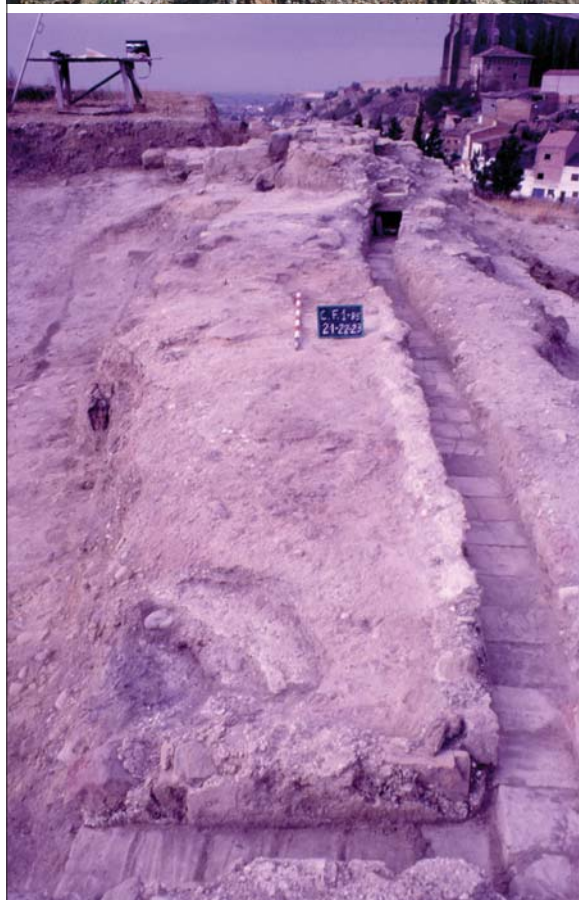
Figures 2 i 2.1. Canalitzacions medievals de distribució d'aigües.