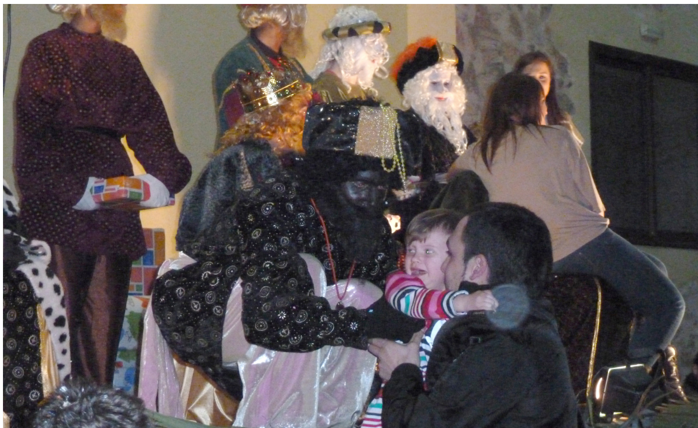
Els senyors reis reparteixen les joguines als xiquets i xiquetes.