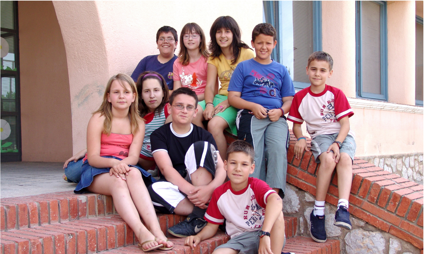
Els quintos l'any 2007, quan feien 6è de primària.