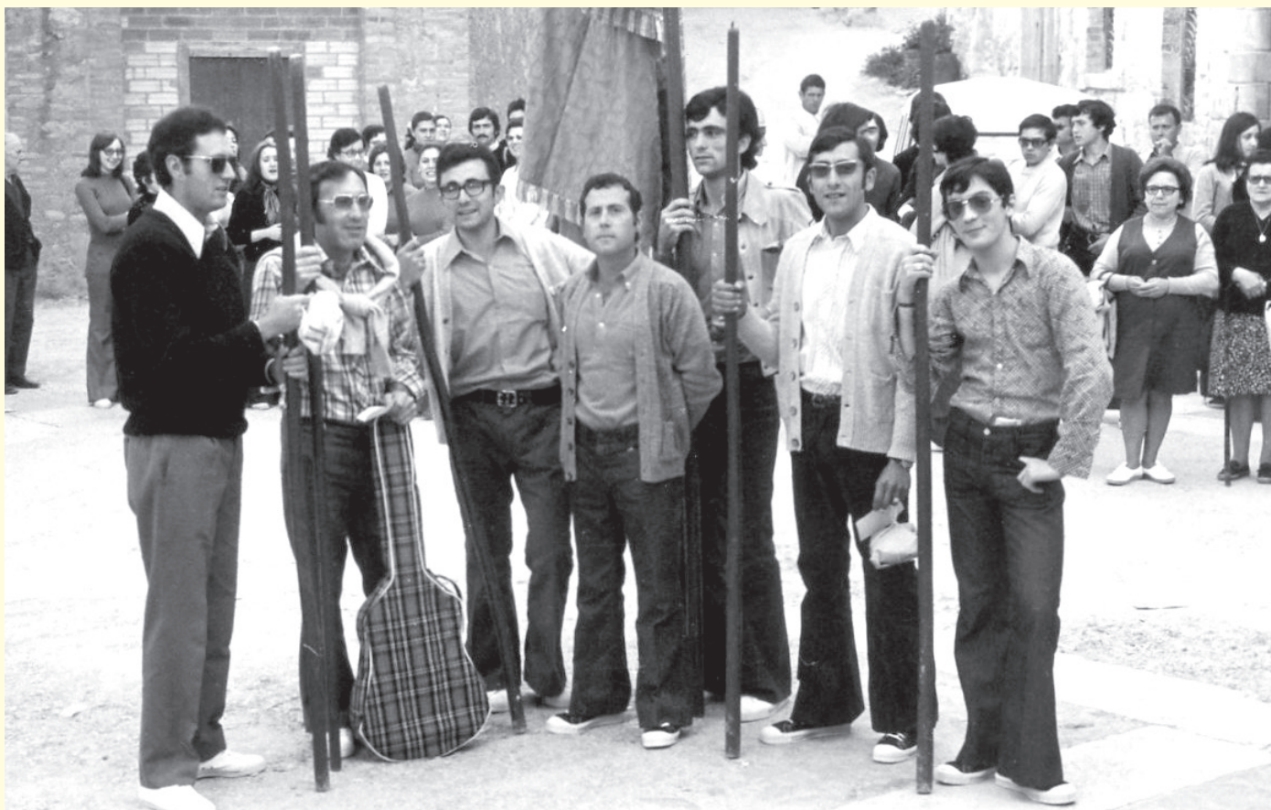
Els cantors de la processó de santa Magdalena, l'any 1973.