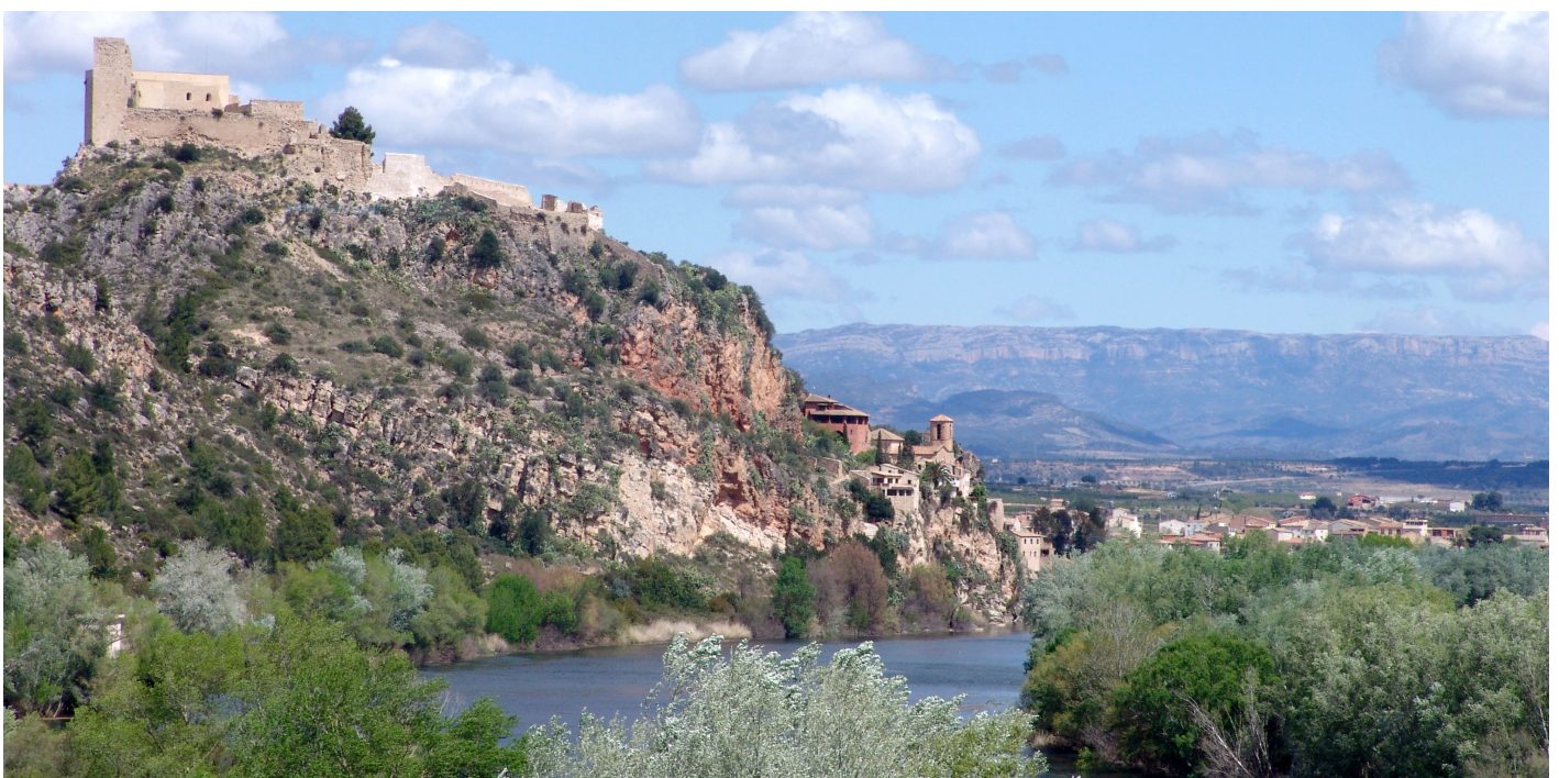
Castell de Miravet, seu de la batllia de templers i hospitalers