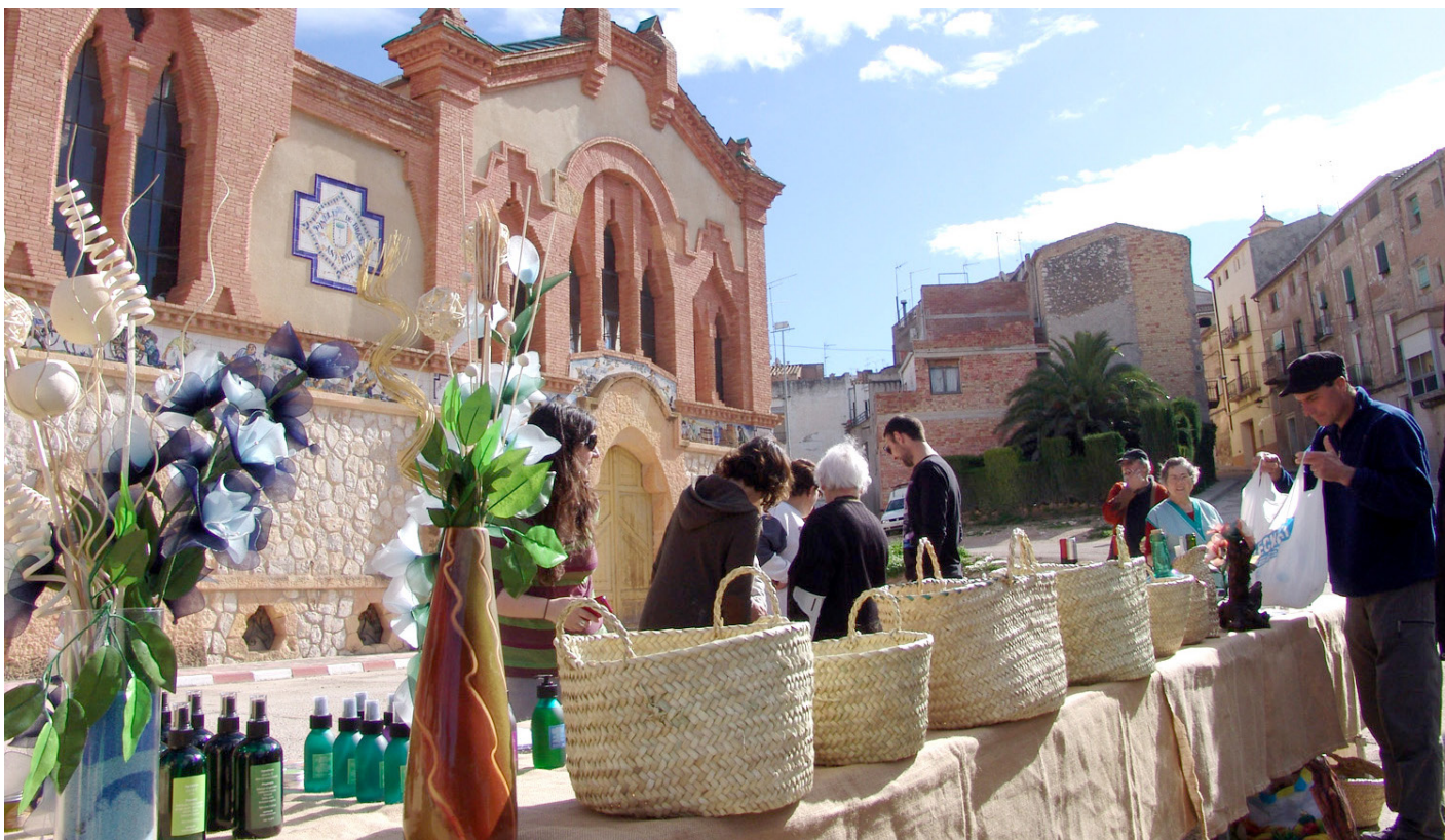
Els artesans del Pinell presentaran els seus productes tots els segons diumenges de mes.