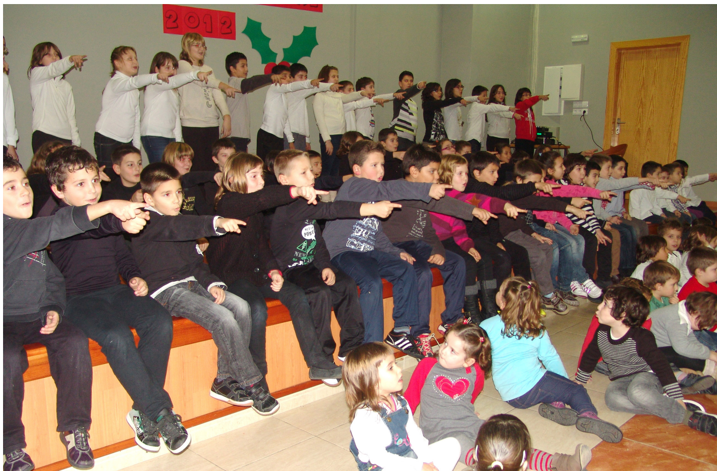
Concert dels alumnes de l'escola del poble.