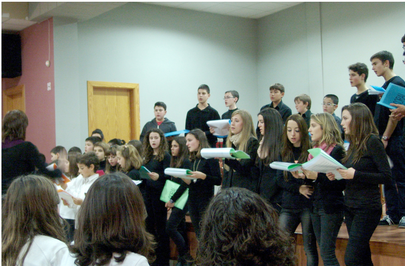
Concert de l'escola de música de Benissanet, Pinell i Bot.