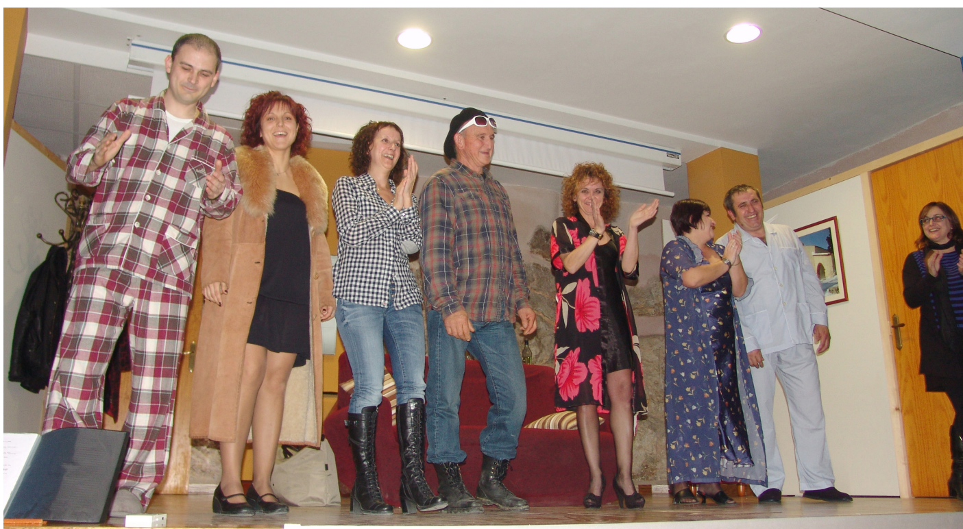
Salutació final dels participants de l'obra.