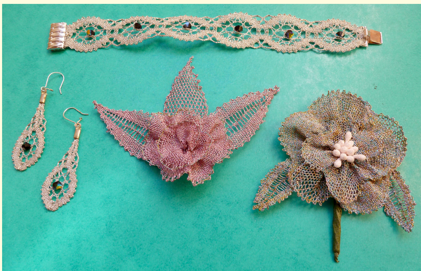
Polsera, arrecades i agulla de pit fetes amb puntes de coixi, per Rossario Vidiella Serres, de Pitxell.