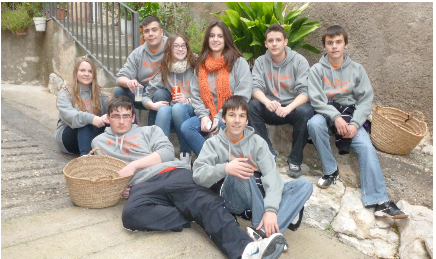
Els quintos, actualment.