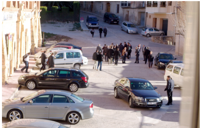
Visita al Pinell del president de la Diputació.

L'Institut Català del Sòl està executant la segona fase de rehabilitació del celler i molí d'oli de la Cooperativa del Pinell de Brai. La inversió, de prop de 192.000 €, que s'està duent a terme servirà per habilitar l'espai modernista per a nous usos culturals i turístics. L'Incasol finançarà el 47% del cost de l'actuació i de la resta se n'ocupa l'Ajuntament del Pinell de Brai amb ajuda del programa europeu Leader. Les obres en execució serviran per reparar els paviments de la sala de tines i la coberta de la sala de recepció, millorar la il·luminació interior, i equipar l'espai amb sistemes d'evacuació i d'enllumenat d'emergència perquè pugui incloure's en les rutes turístiques.