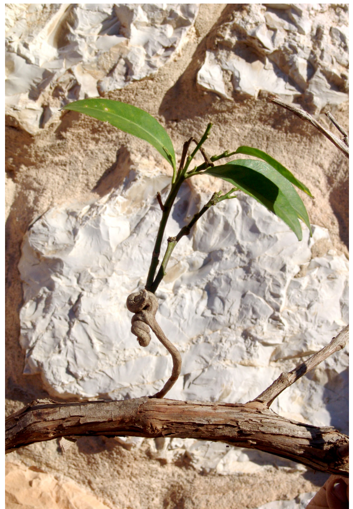
Detall del brot.