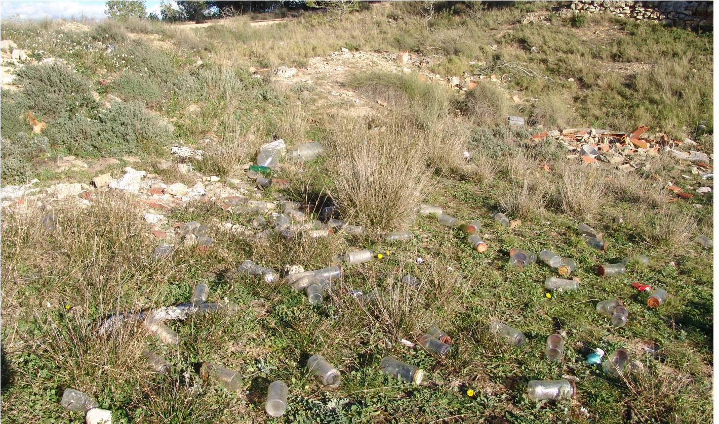
Pots de vidre i runa abandonats al costat del camí del Guitard.