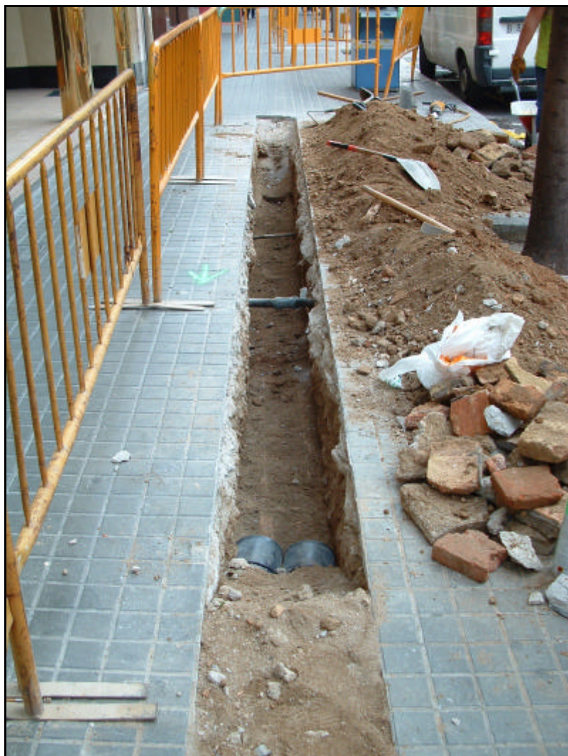
Fotografia 7. Detall continuació rasa carrer Fontanelles un cop realitzat el buidatge de terres. Direcció Plaça Urquinaona.