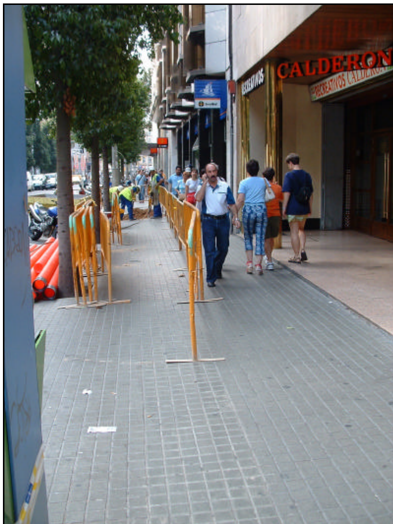
Fotografia 1. Vista general carrer Fontanelles en direcció Plaça Catalunya, un cop començats els treballs.