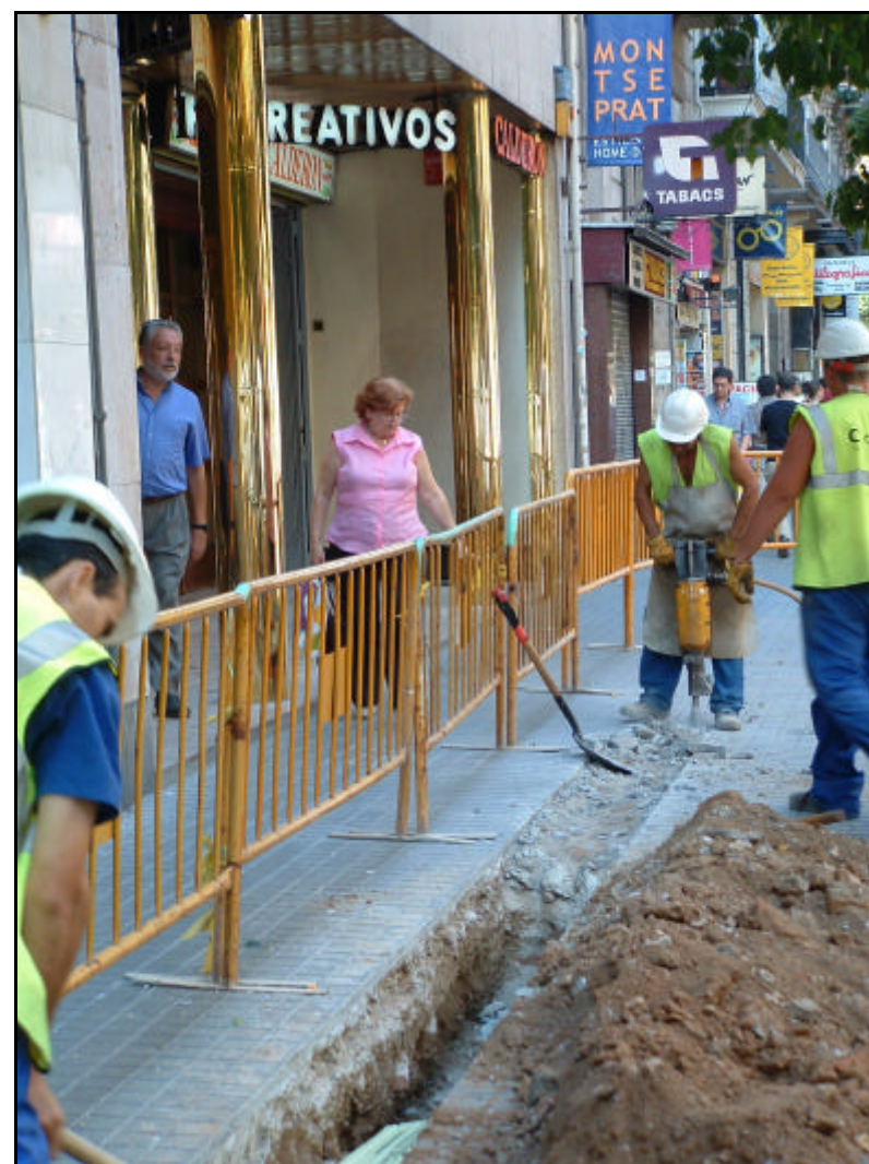
Fotografia 2. Treballs obertura de la rasa realitzada al carrer Fontanelles. Vista en direcció Plaça Urquinaona.