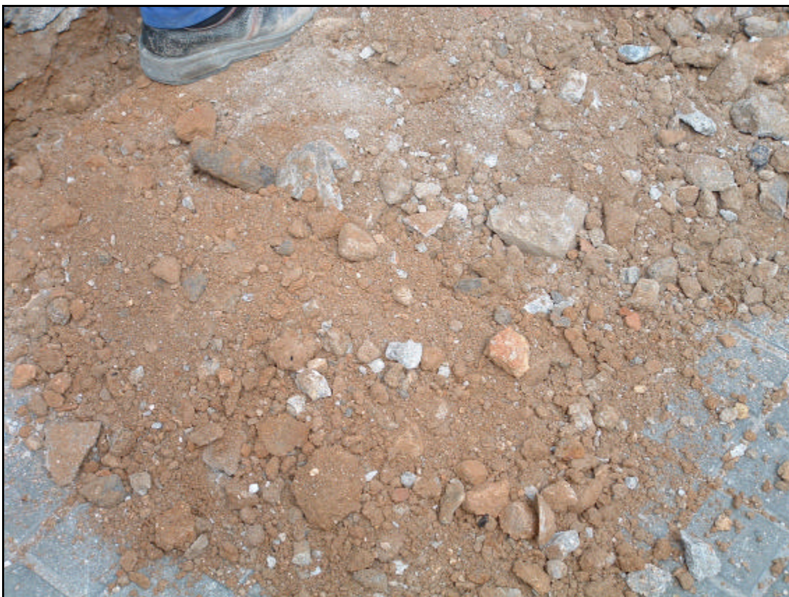
Fotografia 10. Detall rebliment rasa realitzada al carrer Fontanelles, corresponent a la U.E. 04 .