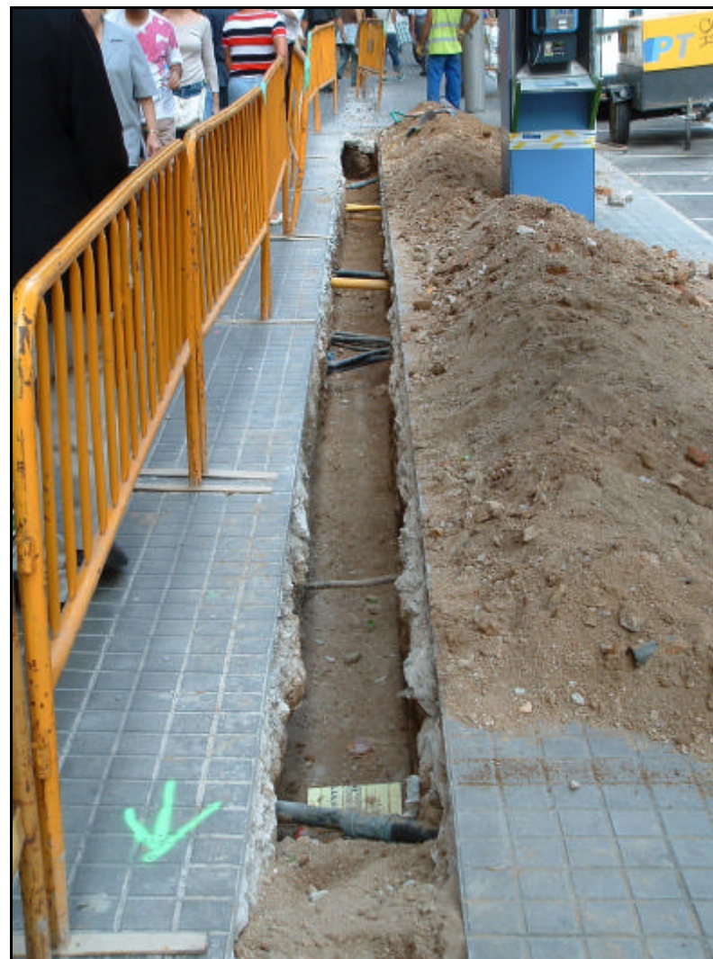
Fotografia 8. Detall tram rasa realitzada al carrer Fontanelles, en la que es pot apreciar els serveis localitzats durant la realització del treballs.