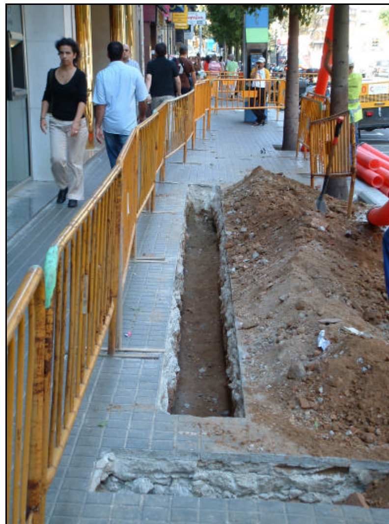
Fotografia 6. Detall primer tram rasa carrer Fontanelles un cop realitzat el buidatge de terres. Vista direcció Plaça Urquinaona.