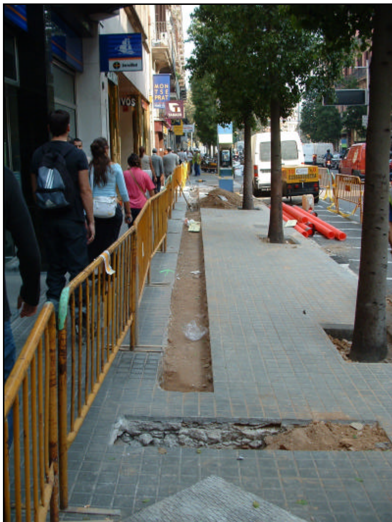
Fotografia 5. Vista general de la rasa oberta al carrer Fontanelles en direcció Plaça Urquinaona.