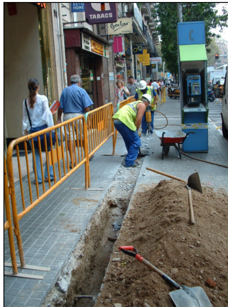
Fotografia 4. Treballs d'obertura i buidatge realitzats als carrer Fontanelles, en direcció Plaça Urquinaona.