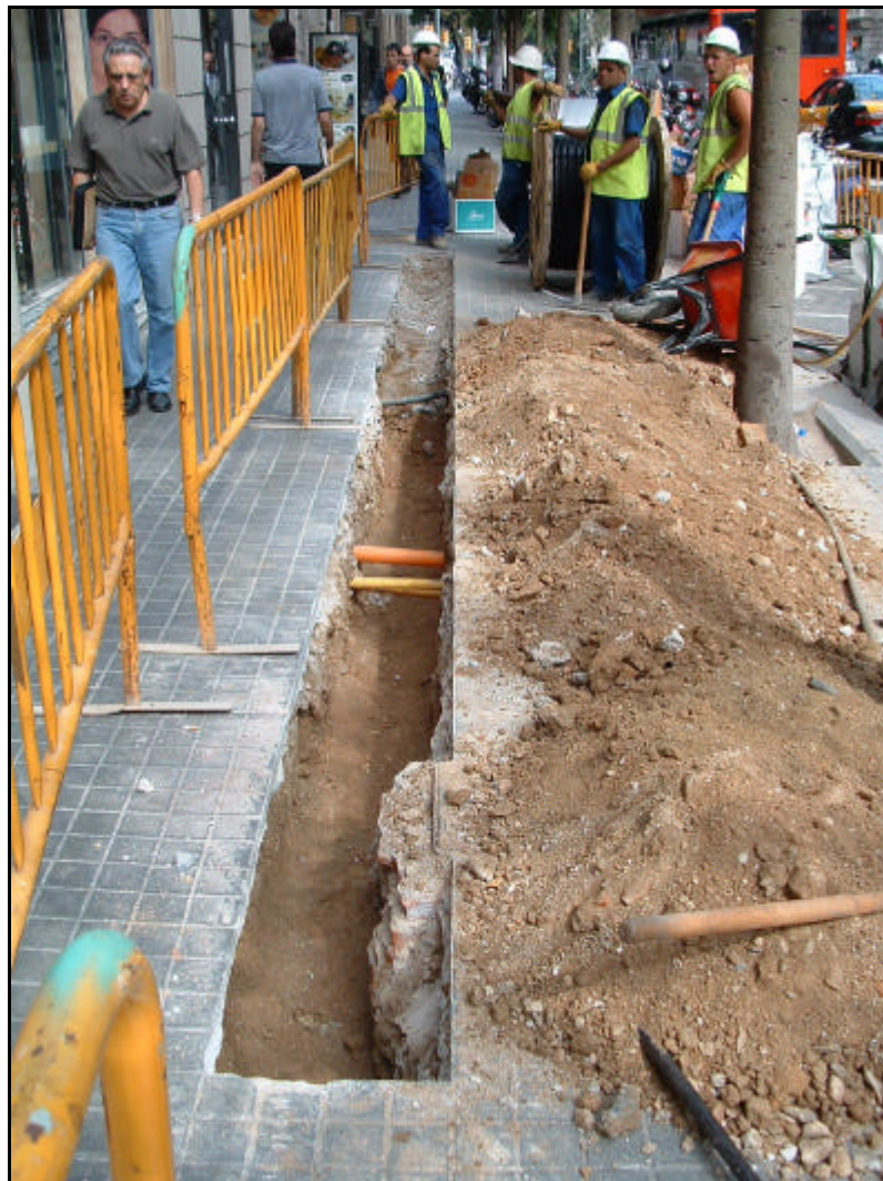
Fotografia 9. Detall últim tram de la rasa oberta al carrer Fontanelles, en direcció Plaça Urquinaona.