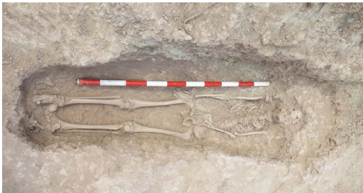
Figura 7. A la part superior, inhumació excavada a l'interior de la torre. La imatge inferior correspon a un dels enterraments vinculats a la necròpoli de l'església de Sant Pere.