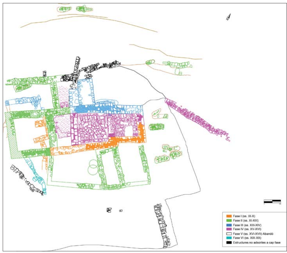
Figura 3. Planta general i planta cronològica de l'església de Sant Pere del Puig. Cristina Belmonte i Roser Arcos. iPAT Serveis Culturals.