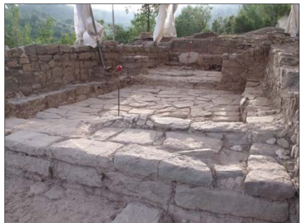
Figura 8. Nau de l'església de Sant Pere en la seva última fase d'ocupació. Cristina Belmonte (iPAT Serveis Culturals).

Així mateix, es fa una nova pavimentació de l'interior del temple, mitjançant un enllosat