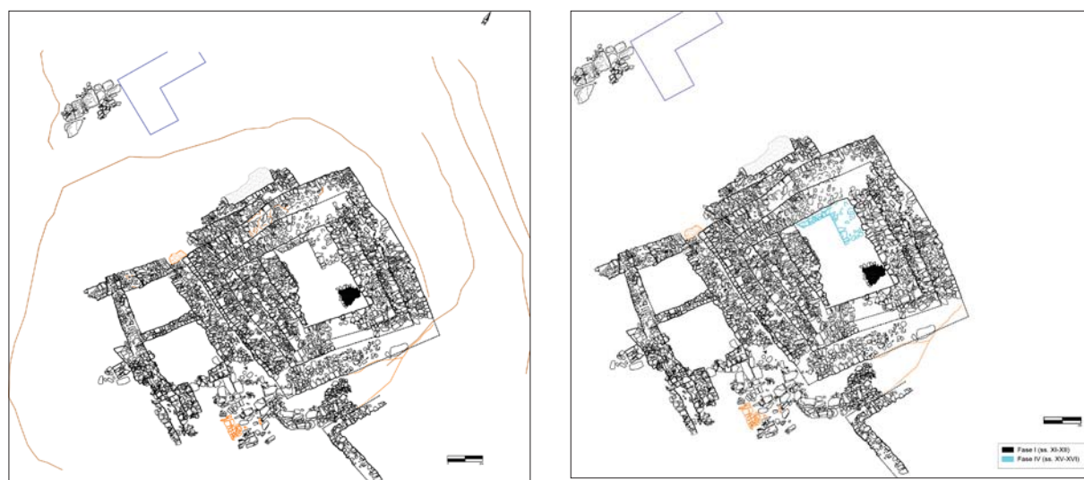
Figura 4. Planta general i planta cronològica de la torre del Puig de Sant Pere. Cristina Belmonte i Roser Arcos. iPAT Serveis Culturals.

el qual, i aprofitant-ne algunes restes es bastí l'actualment visible, datat entre els segles XI-XII. En el cas de la torre, s'han de definir i confirmar les característiques de l'estructura circular esmentada, i les datacions per C14 dels inhumats. Caldrà també esgotar l'estratigrafia en ambdós edificis i excavar-ne els interiors per poder completar la informació i confirmar aquests supòsits, sobretot en el cas dels murs de l'església i de la possible estructura circular a la torre.