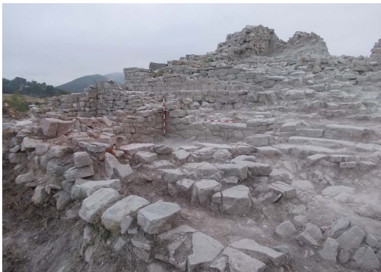
Figura 5. Vista des del sud de la torre del Puig de Sant Pere, on es pot apreciar la seva singular tècnica constructiva, així com algunes de les dependències documentades.