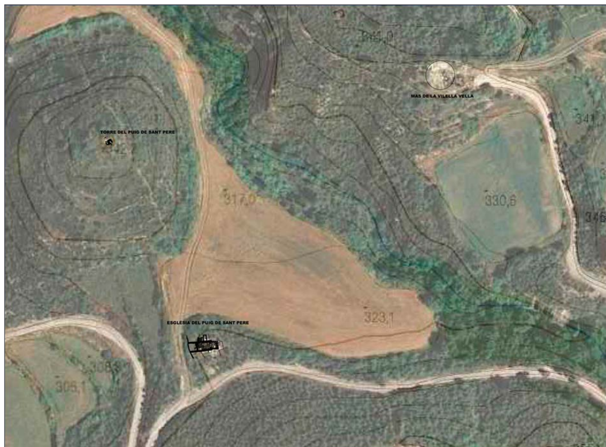
Figura 2. Ubicació d'alguns dels edificis del conjunt arqueològic de les Guixeres. ICGC.

De la mateixa manera, s'ha tingut cura de fer-ne difusió. A banda de la jornada de portes obertes de l'últim dia de cada campanya, en la qual els mateixos estudiants expliquen què s'hi ha fet i els resultats obtinguts, també s'hi fan guiatsges i visites durant l'any.