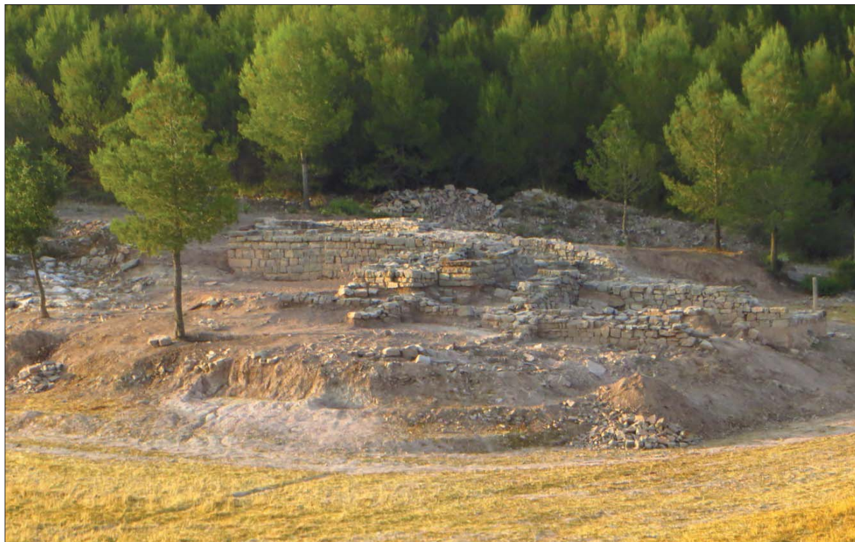
Figura 6. L'església de Sant Pere del Puig, vista des de la torre. Cristina Belmonte (iPAT Serveis Culturals).

Uns metres més al nord-oest i sobre un turó, el Puig de Sant Pere, hi trobem la torre amb diverses edificacions. Aquesta té com a prin-