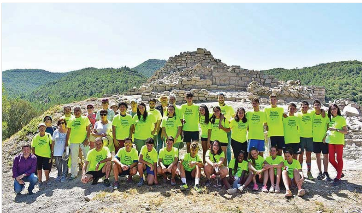
Figura 1. Participants de la campanya de 2019. Ajuntament de Súria.