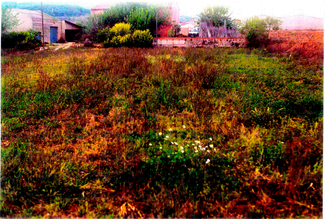
Nº 2: Vista general del Camp 2.