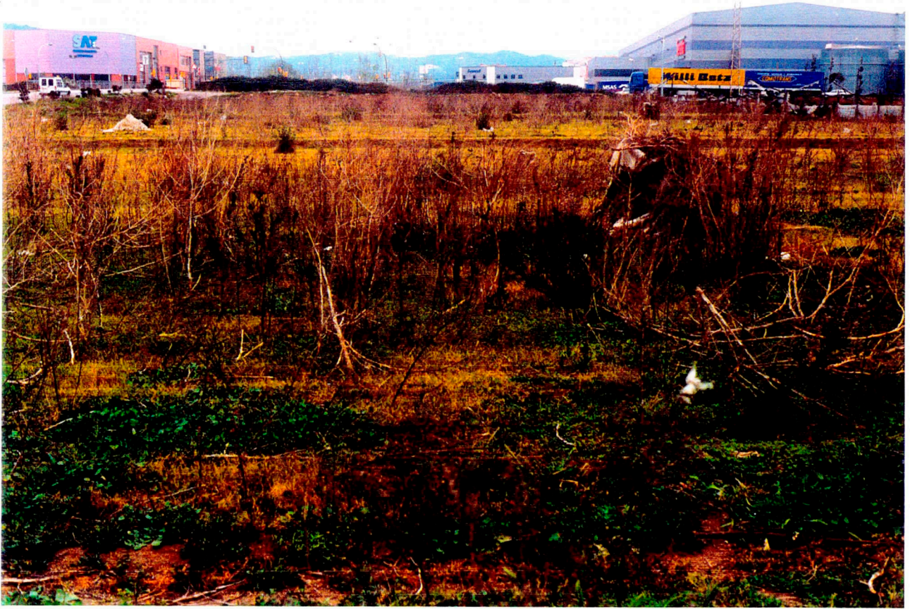
Nº 11: Vista general del Camp 10.