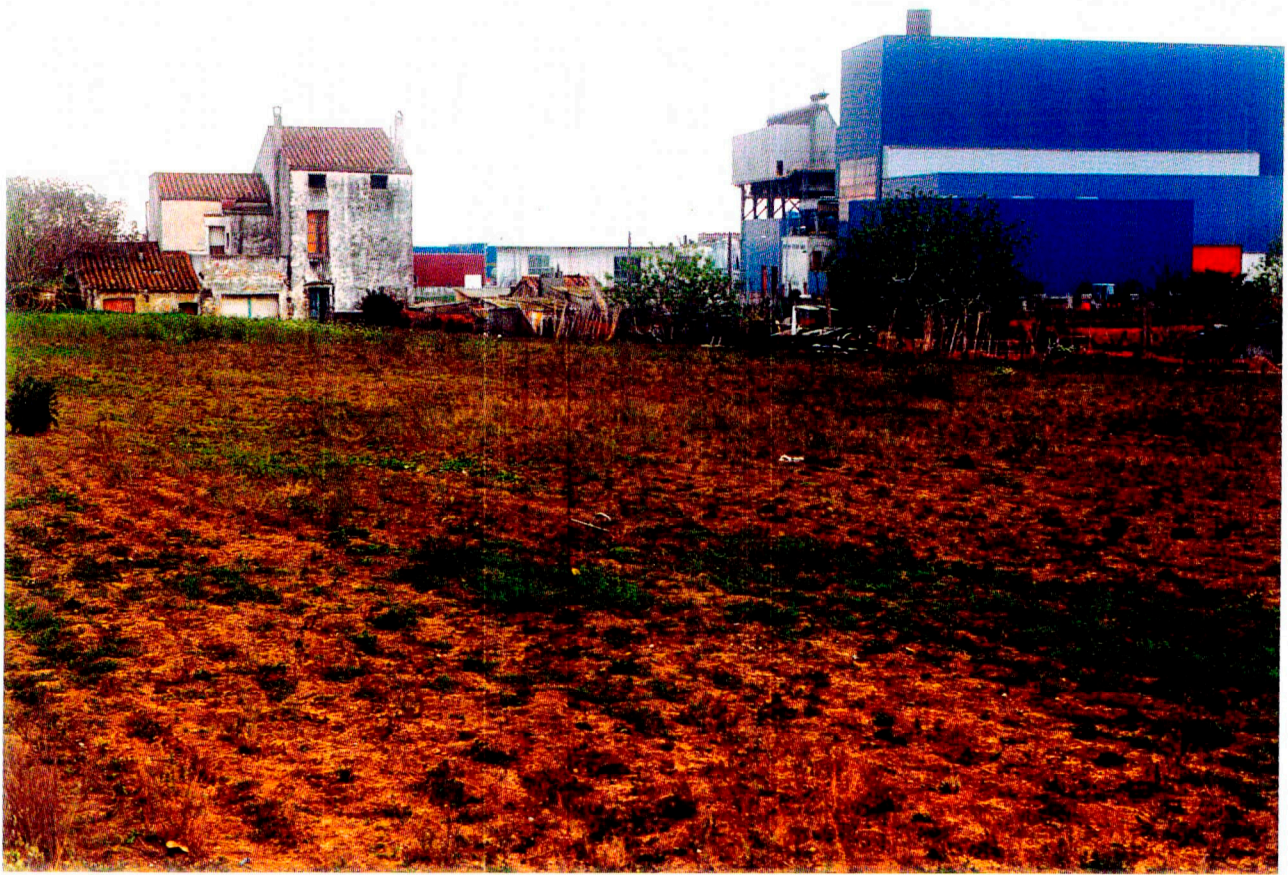
Nº 3: Vista general del Camp 3.