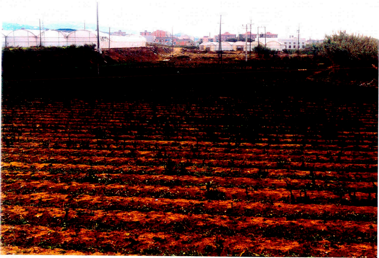
Nº 13: Vista general dels Camps 12 i 13.