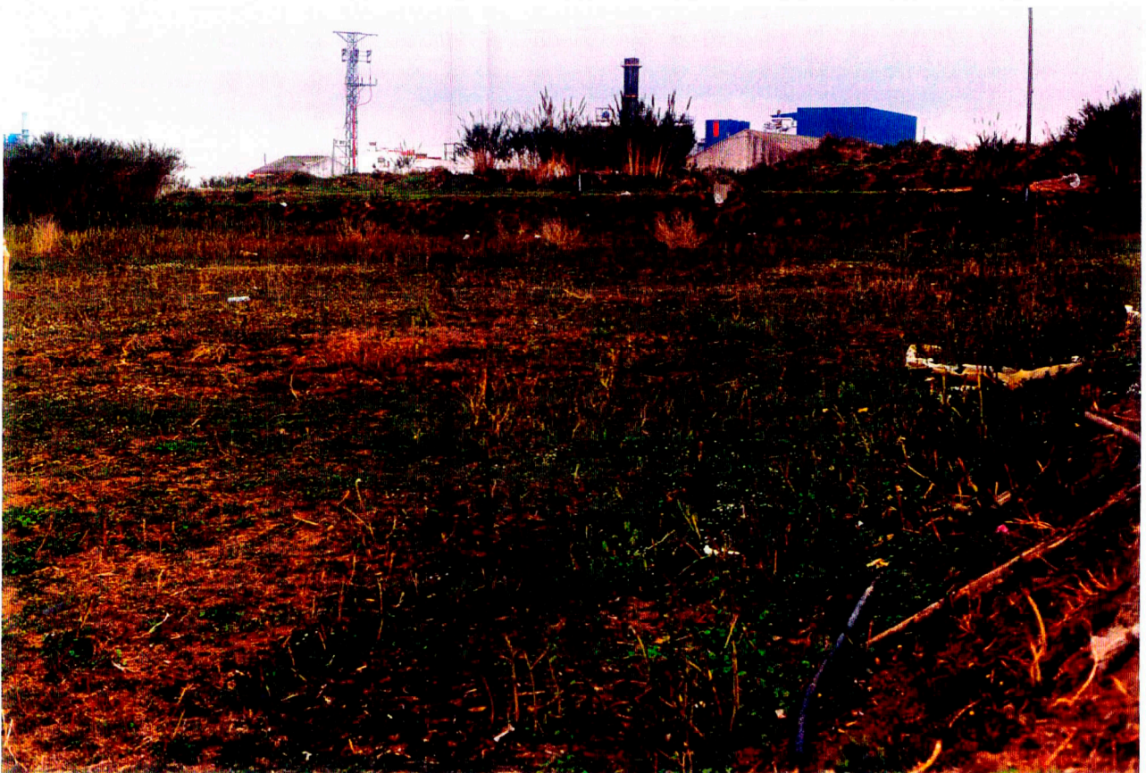
Nº 10: Vista general del Camp 9.