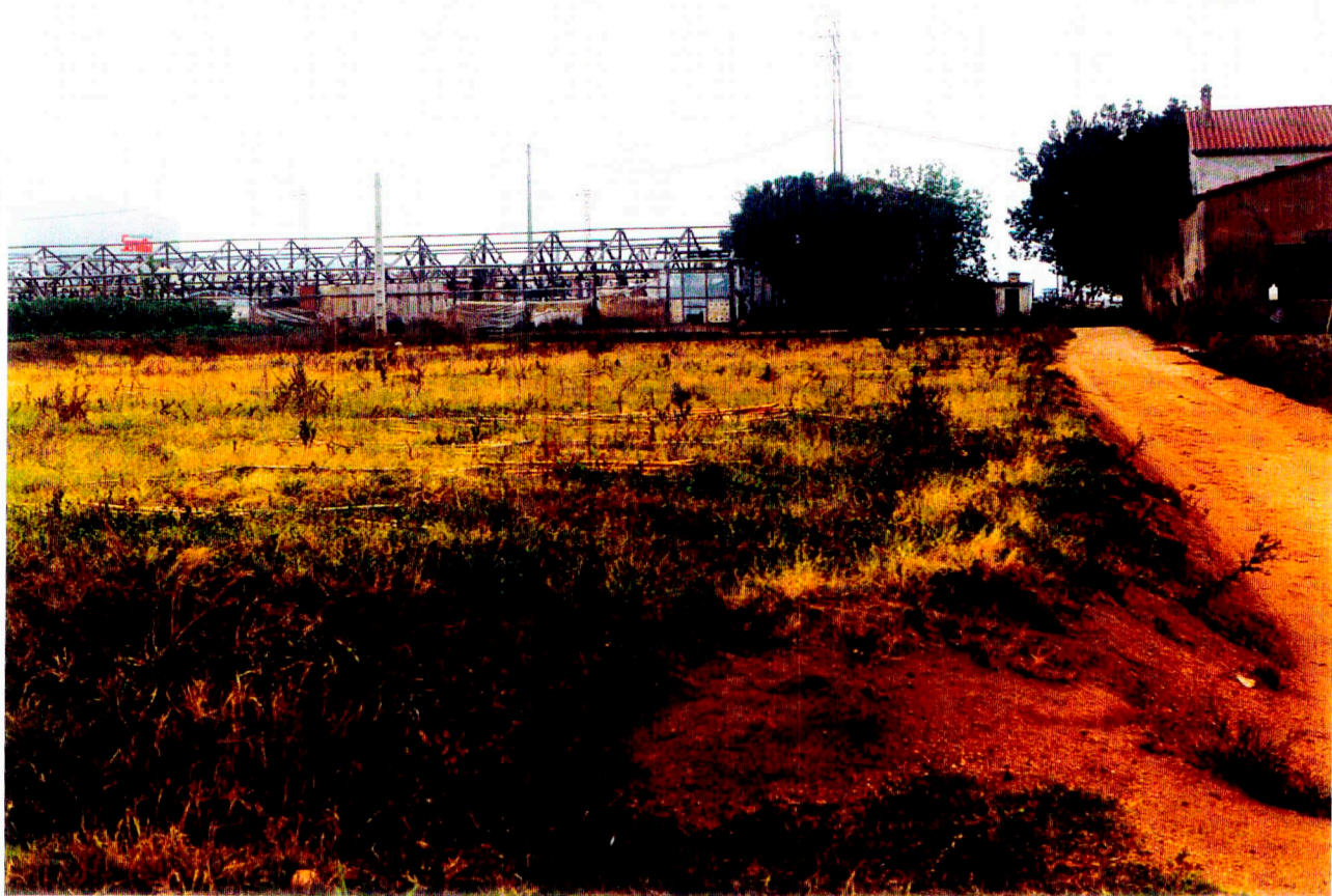
Nº 5: Vista general del Camp 5.