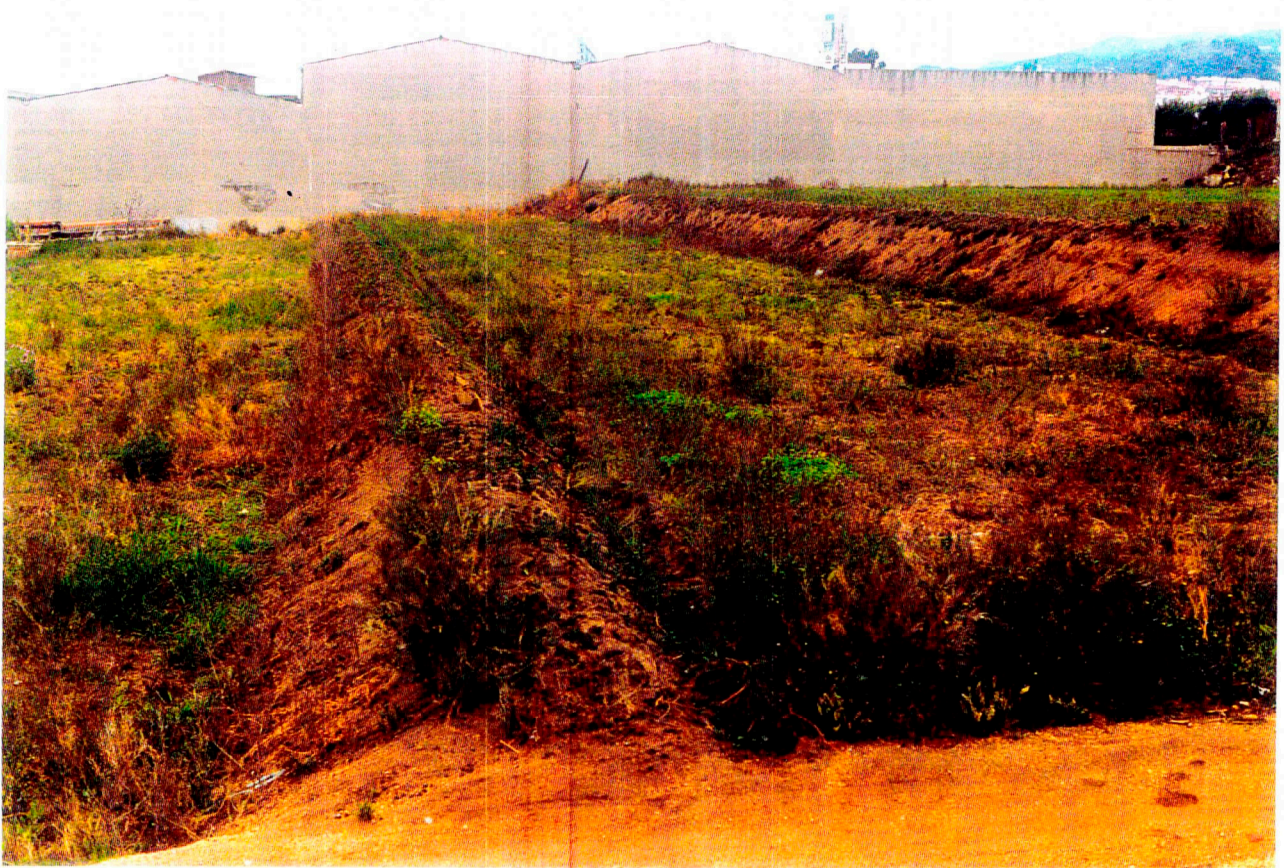
Nº 4: Vista general del Camp 4.