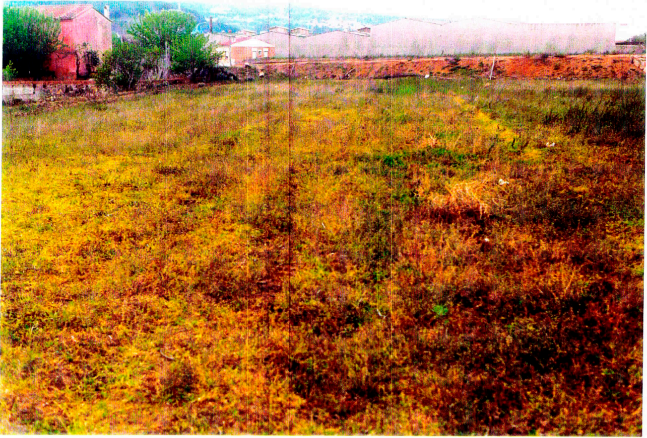
Nº 1: Vista general del Camp 1.