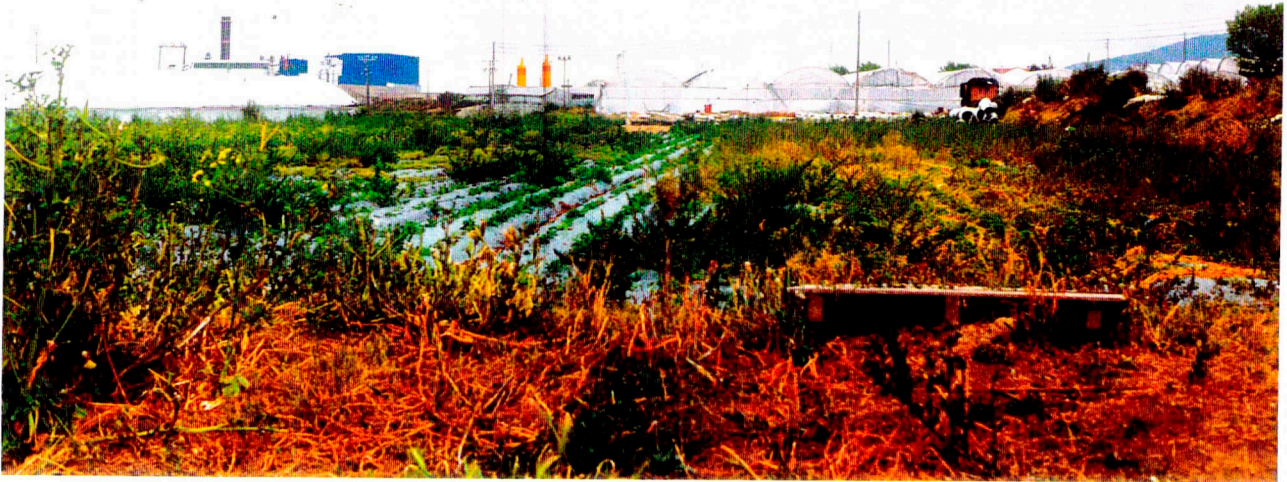
Nº 9: Vista general del Camp 8.