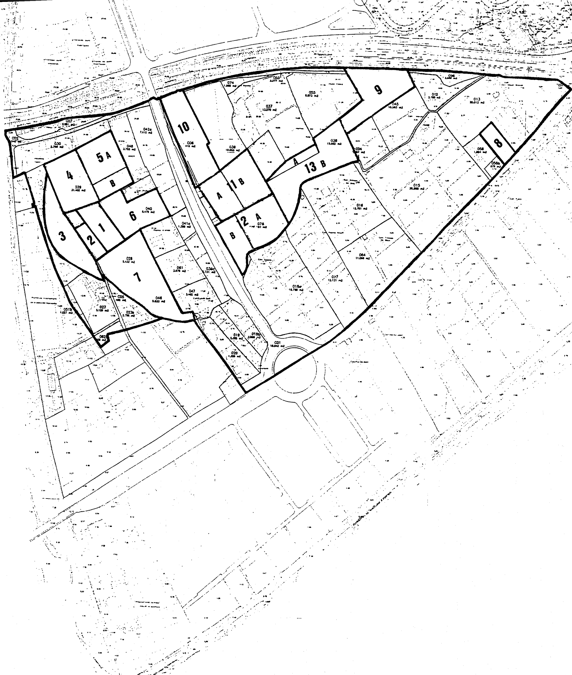
DIVISIÓ EN CAMPS DE LA ZONA PROSPECTADA A LES HORTES DEL CAMÍ RAL.