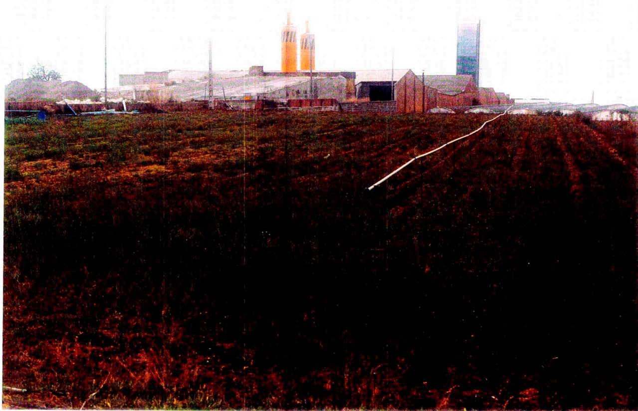
Nº 6: Vista general del Camp 6.