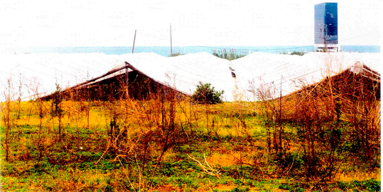
Nº 12: Vista general del Camp 11.