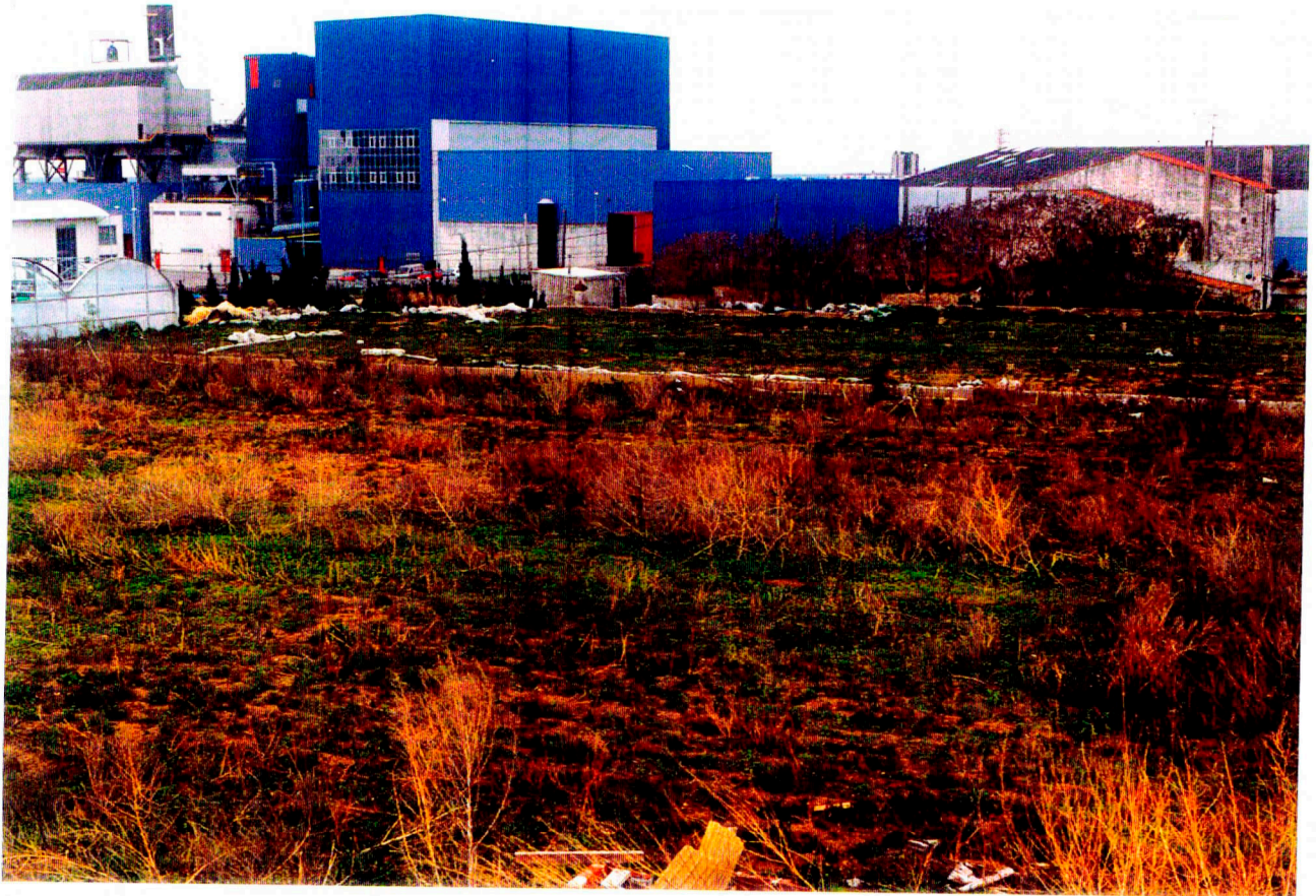
Nº 7: Vista general del Camp 7.