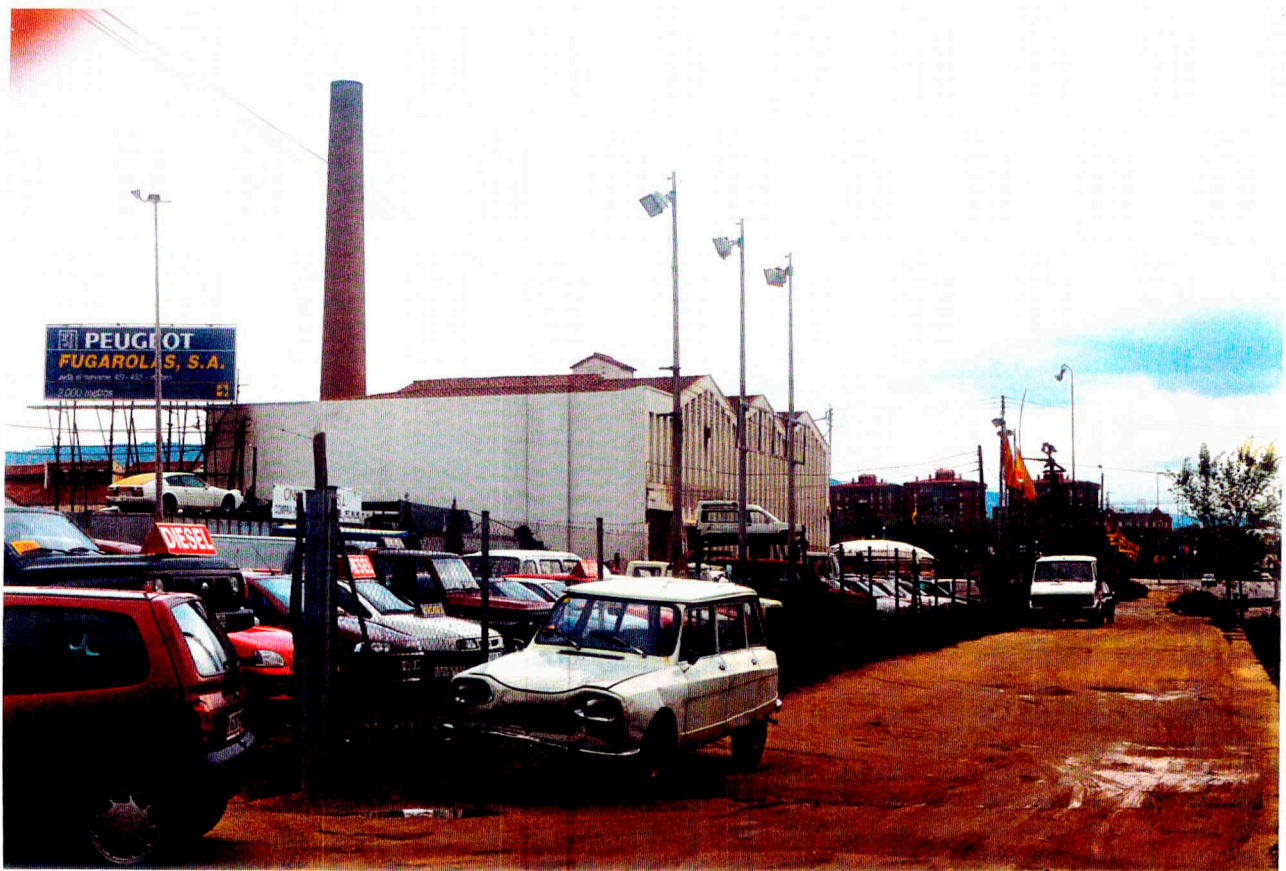
Nº 8: Vista general d'una de les zones que no es va poder prospectar.