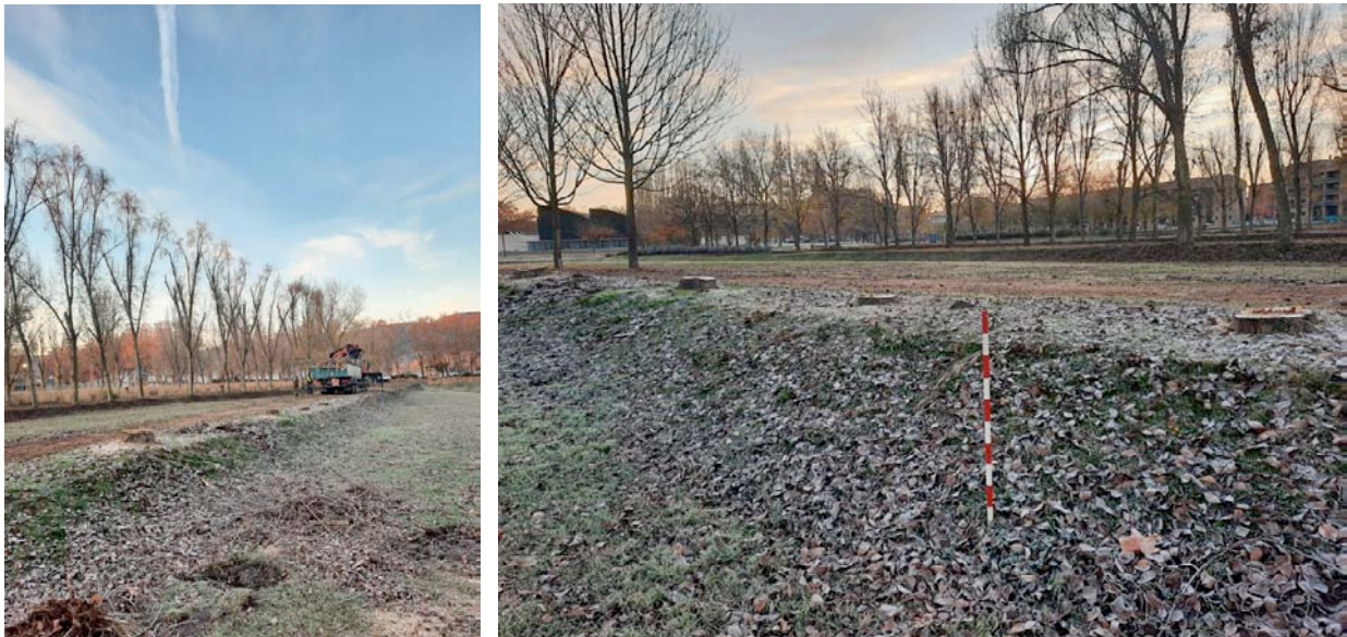
Imatges prèvies a l'arrencament de rabasses

El treball s'ha realitzat el dia 25 de novembre i han comptat en tot moment amb la presència de l'arqueòleg director. Els treballs han consistit en el control arqueològic del moviment de terres necessari per tal d'arrancar les rabasses restants de la tala de l'arbrat de la filera 6 del parc de la Draga.