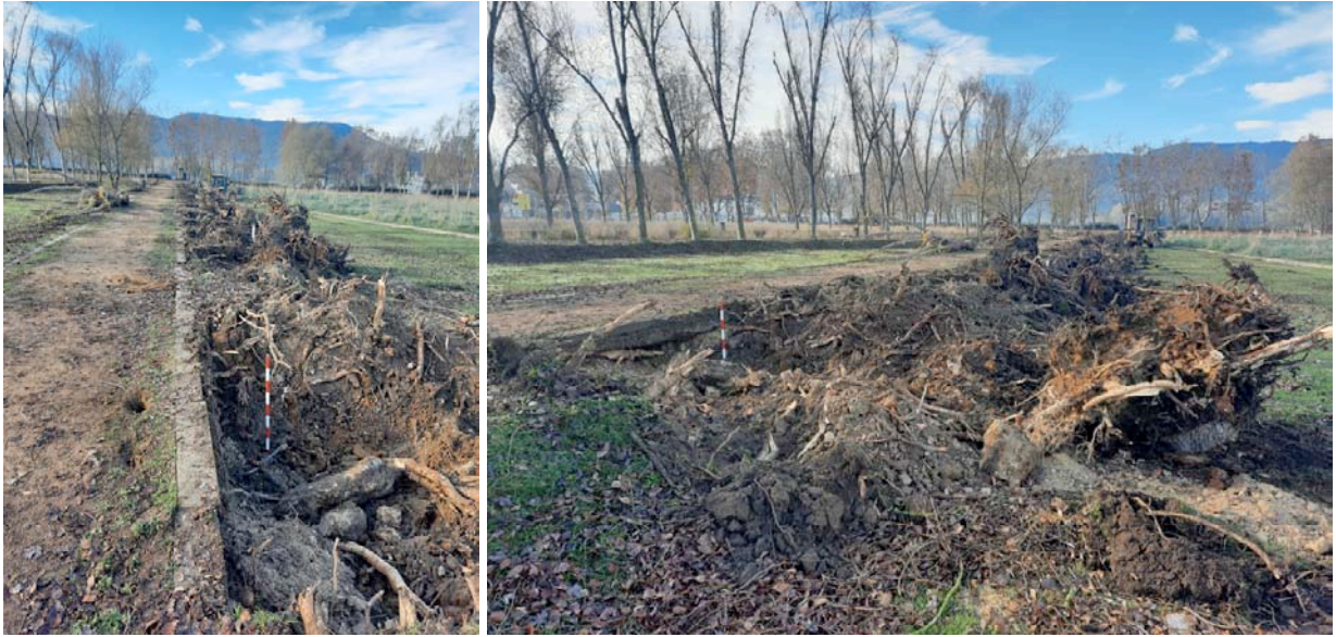
Filera 6 un cop arrancades les rabasses