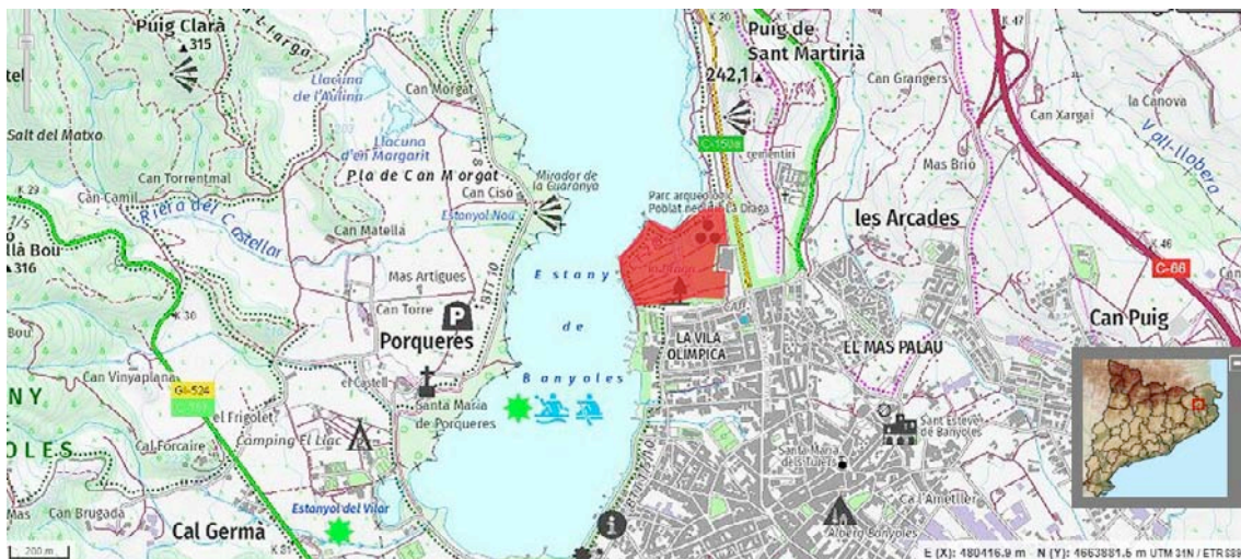
Situació del lloc d'intervenció assenyalat en vermell.

Les coordenades UTM 31 N/ETR S89 són: x: 480130.9 y:4663787.0 z:173,4 (centre parc)