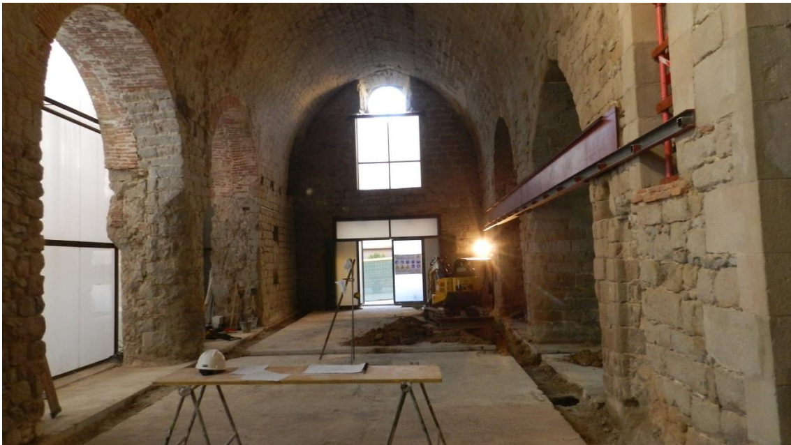
Vista general de l'obra amb les rases longitudinals perimetrals

A l'exterior de l'edifici s'havia previst fer una rasa per connectar el desguàs dels serveis projectats. Aquesta rasa no ha estat necessària vist que s'ha trobat una canonada de desguàs de previsió feta en l'obra de restauració anterior.