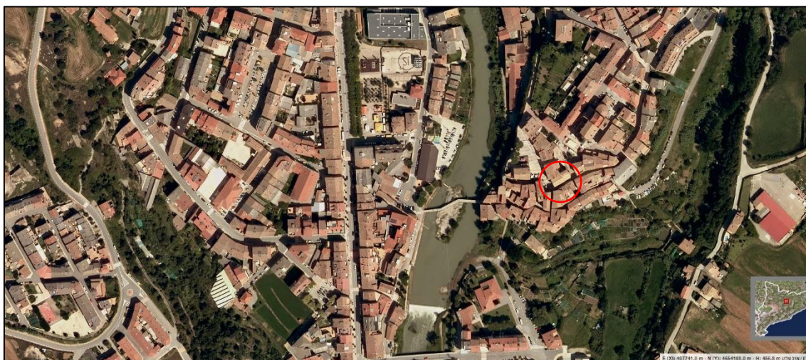
Planta d'ubicació de l'Església Vella de Gironella (ICGC, 2020)

L'església de Santa Eulàlia de Gironella es troba documentada l'any 1222 i es troba ubicada en el nucli històric del municipi, a la riba dreta del riu Llobregat. Actualment, es un edifici pertanyent al consistori municipal qui realitza actes culturals. Arquitectònicament, aquesta temple és una construcció de nau única orientada de llevant a ponent, d'uns 20 m de llarg per 7 m d'ample. Té un absis poligonal cobert amb volta gòtica d'ogiva i clau amb la imatge de santa Eulàlia. De les façanes, molt desfigurades pels diversos usos que va tenir el temple en època recent, només és destacable l'aparell de carreus de mides variables, que confereix certa unitat de textura.