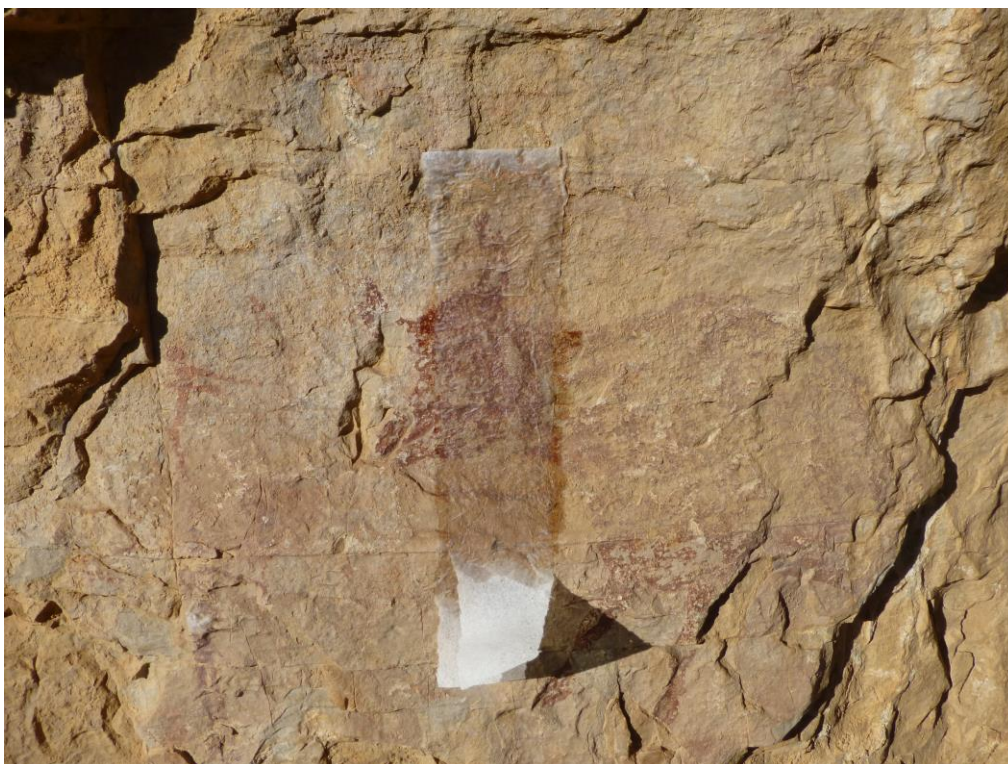
Aplicació d'apòsits de paper amb aigua de baixa mineralització