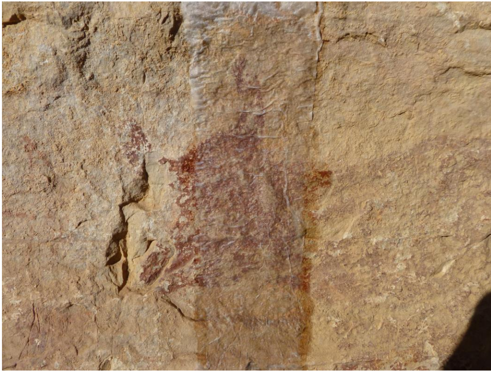
Detall de l'anterior