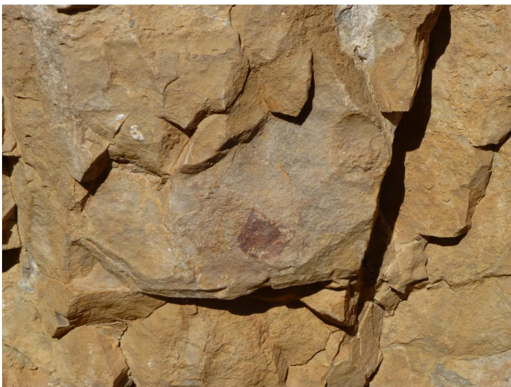
Íd. després de la neteja