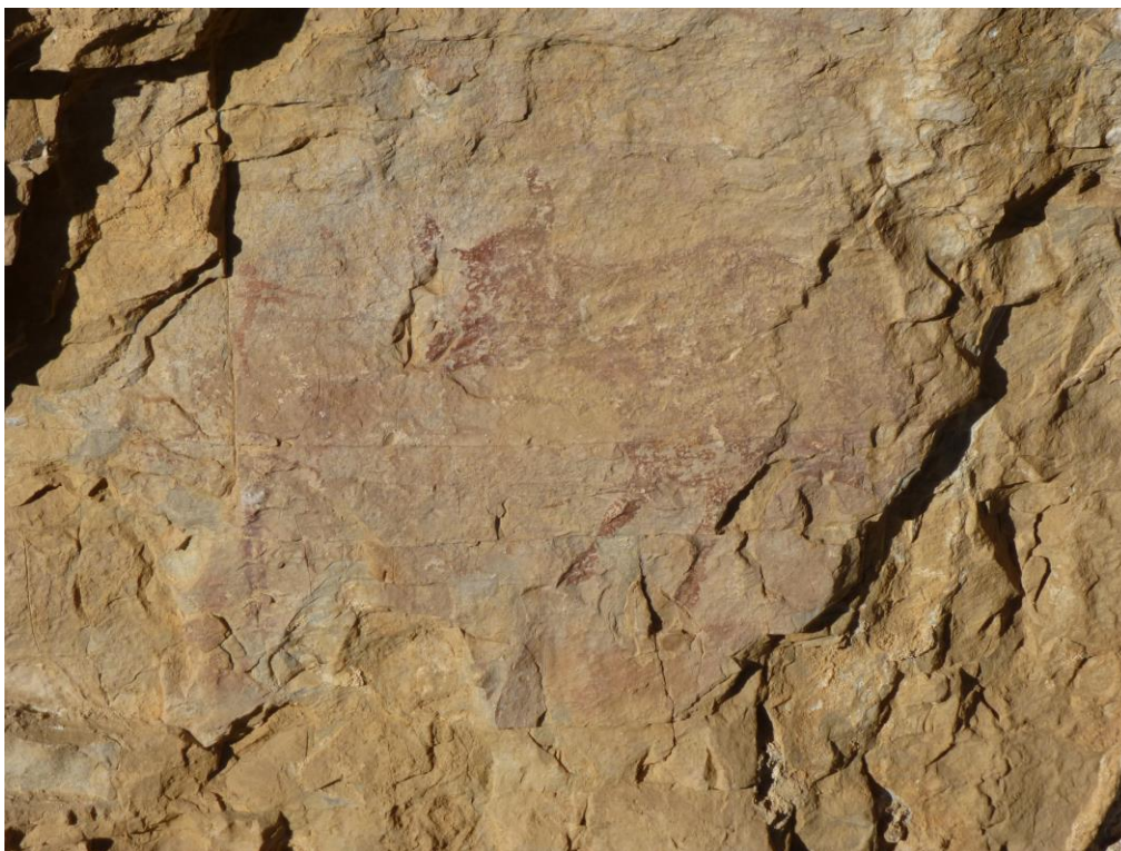
Procés de neteja en el cap del bòvid