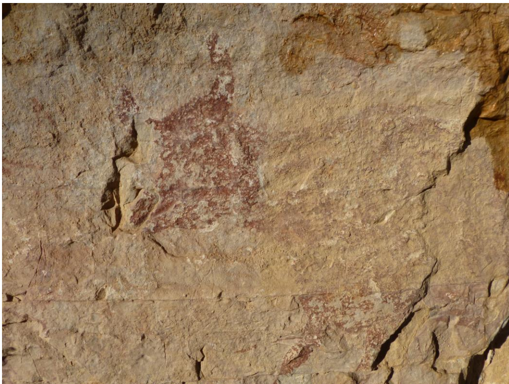
Resultat de l'aplicació anterior