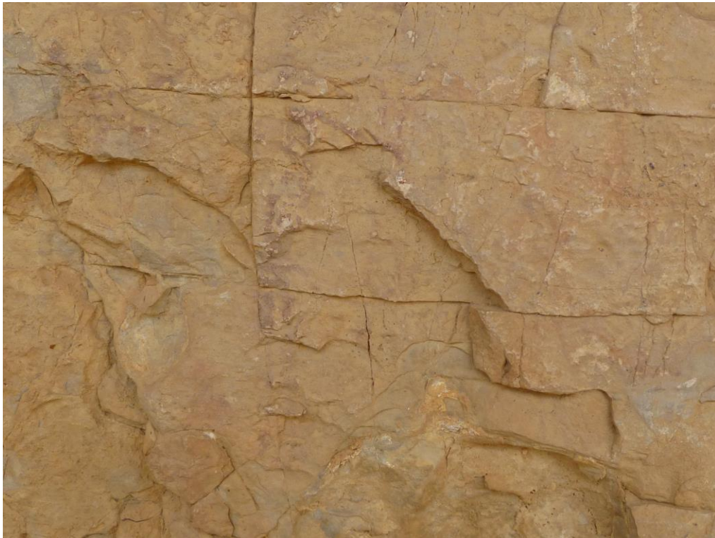
Arquers abans de la neteja