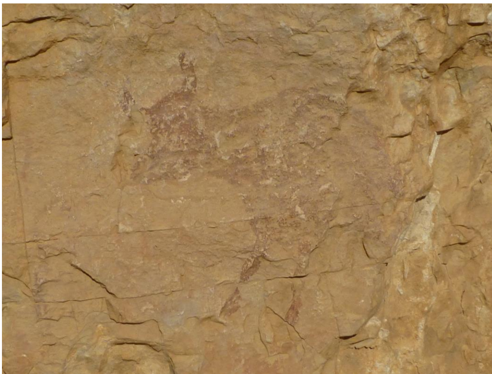
Bòvid abans de la intervenció