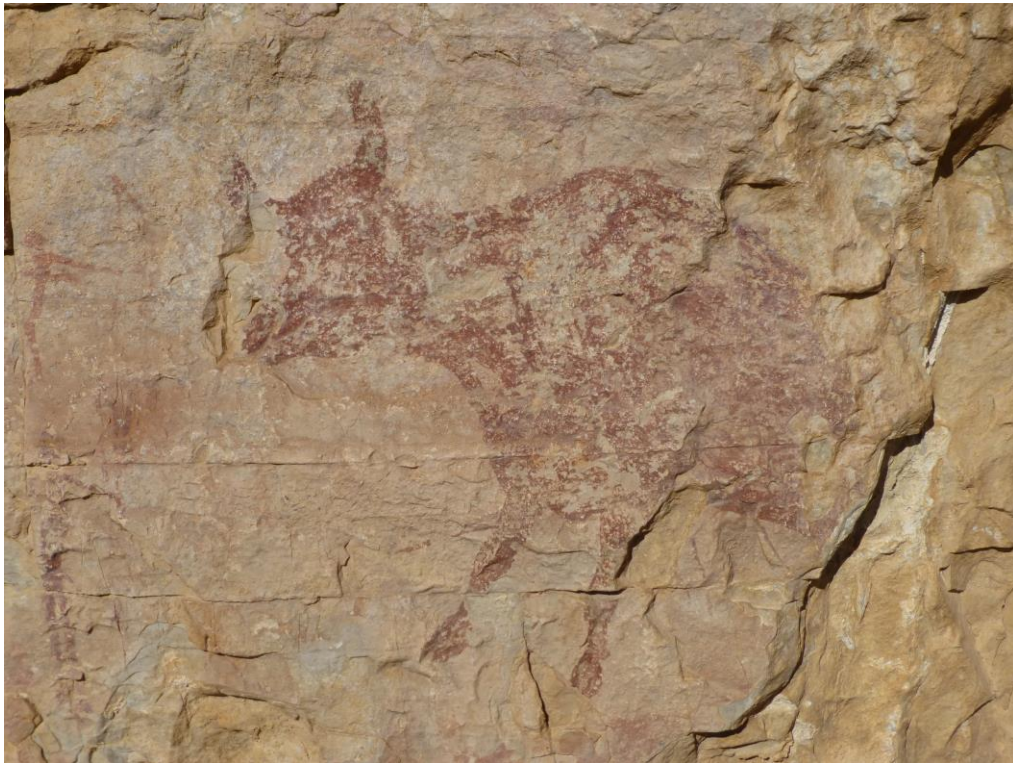
Entonat de les llacunes. Recupera la visió correcta de l'animal