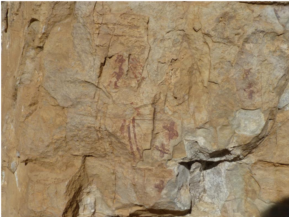
Íd. després de l' intervenció