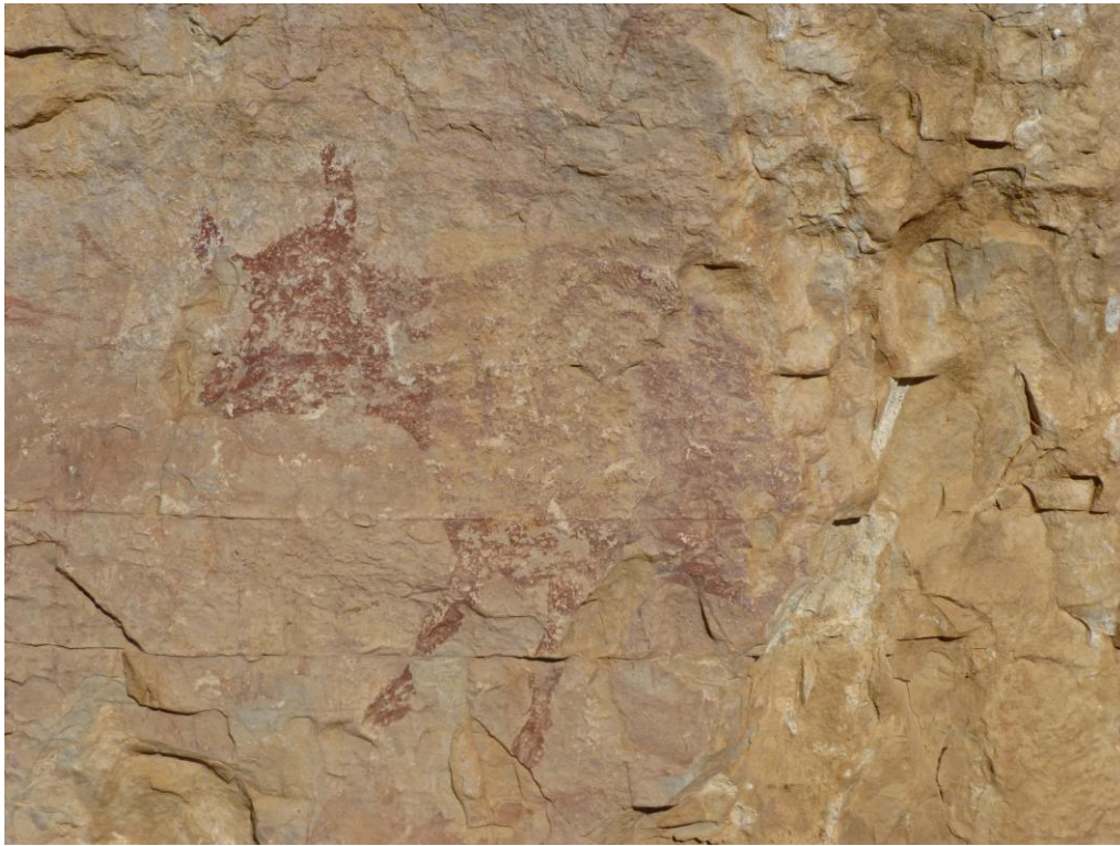
Procés de neteja