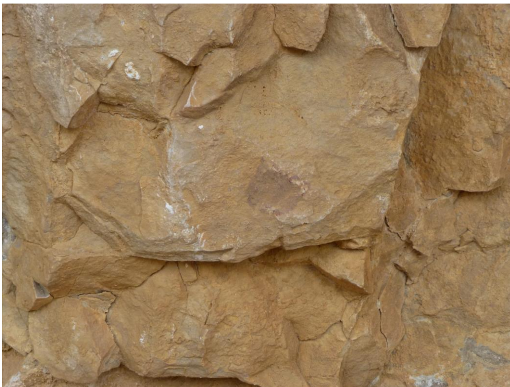
Restes de pintura de la part esquerra abans de la neteja