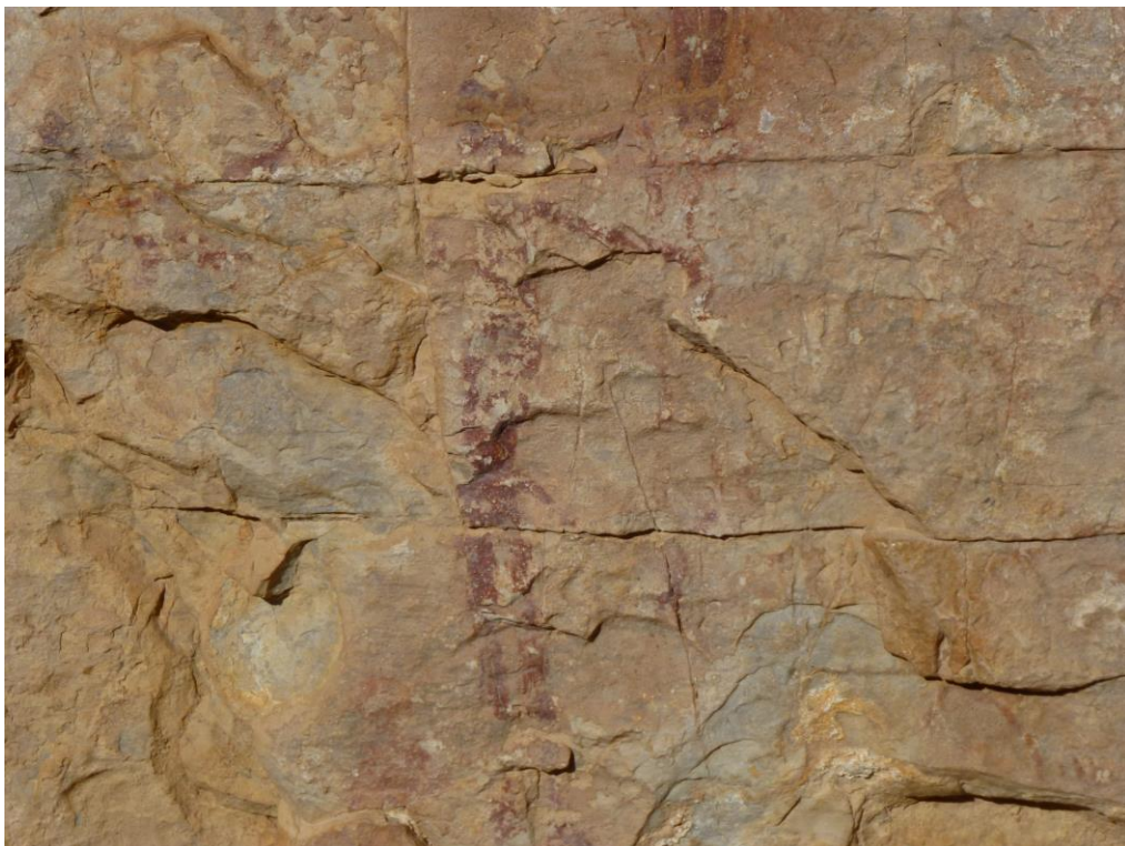
Arquer de la part baixa després de la neteja