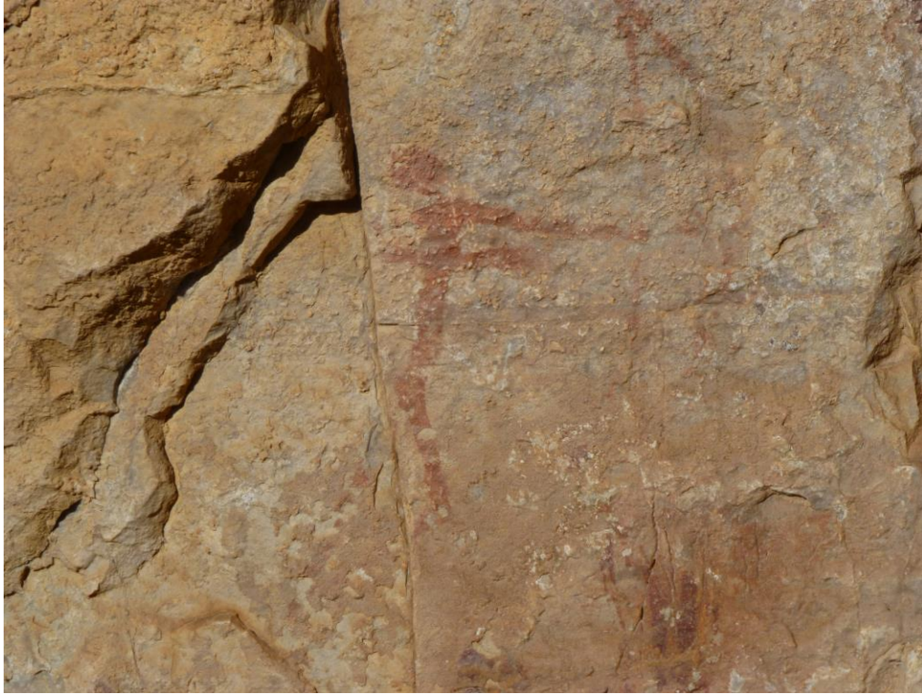
Arquer de la part alta després de la neteja i plomalls de les fletxes de l'arquer inferior