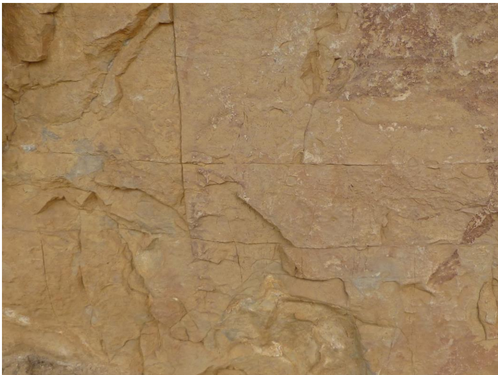
Costat esquerra del bòvid, arquers