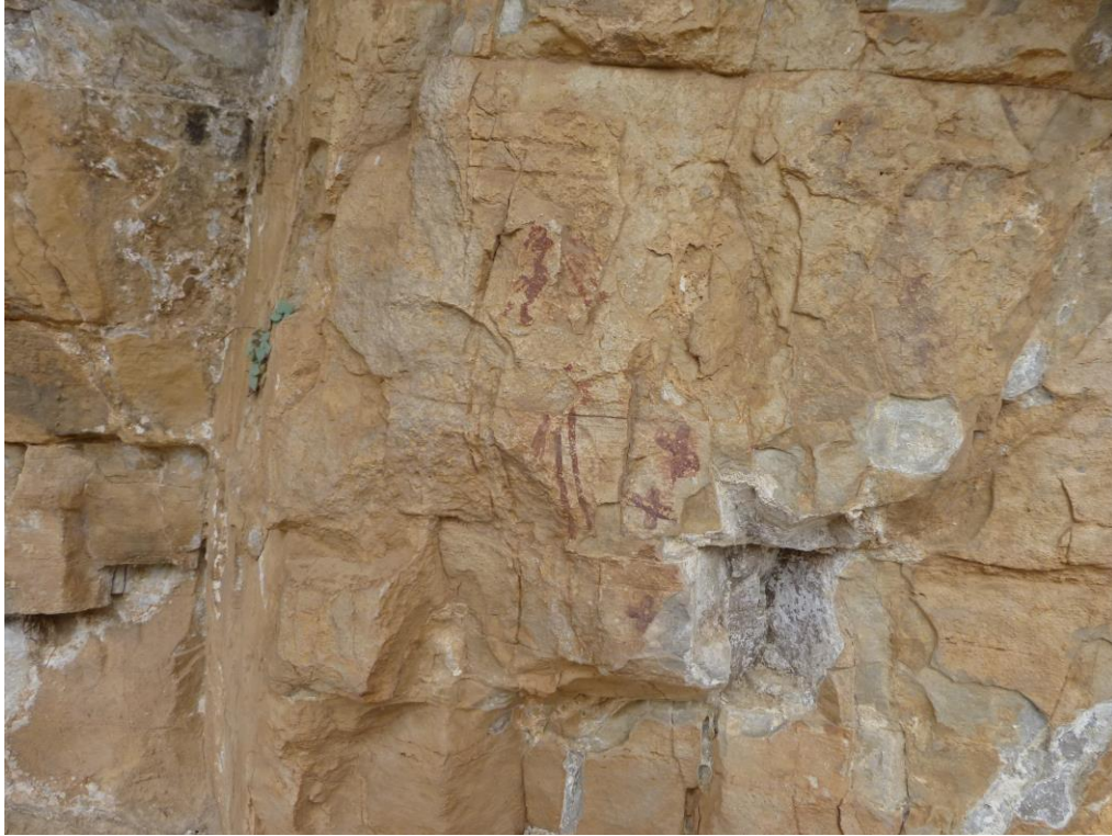
Escena de la banda dreta abans de l' intervenció