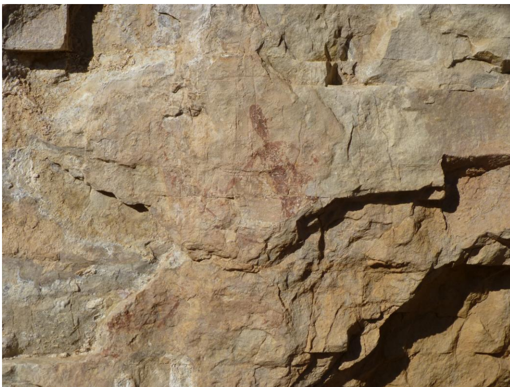
Íd. després de l' intervenció