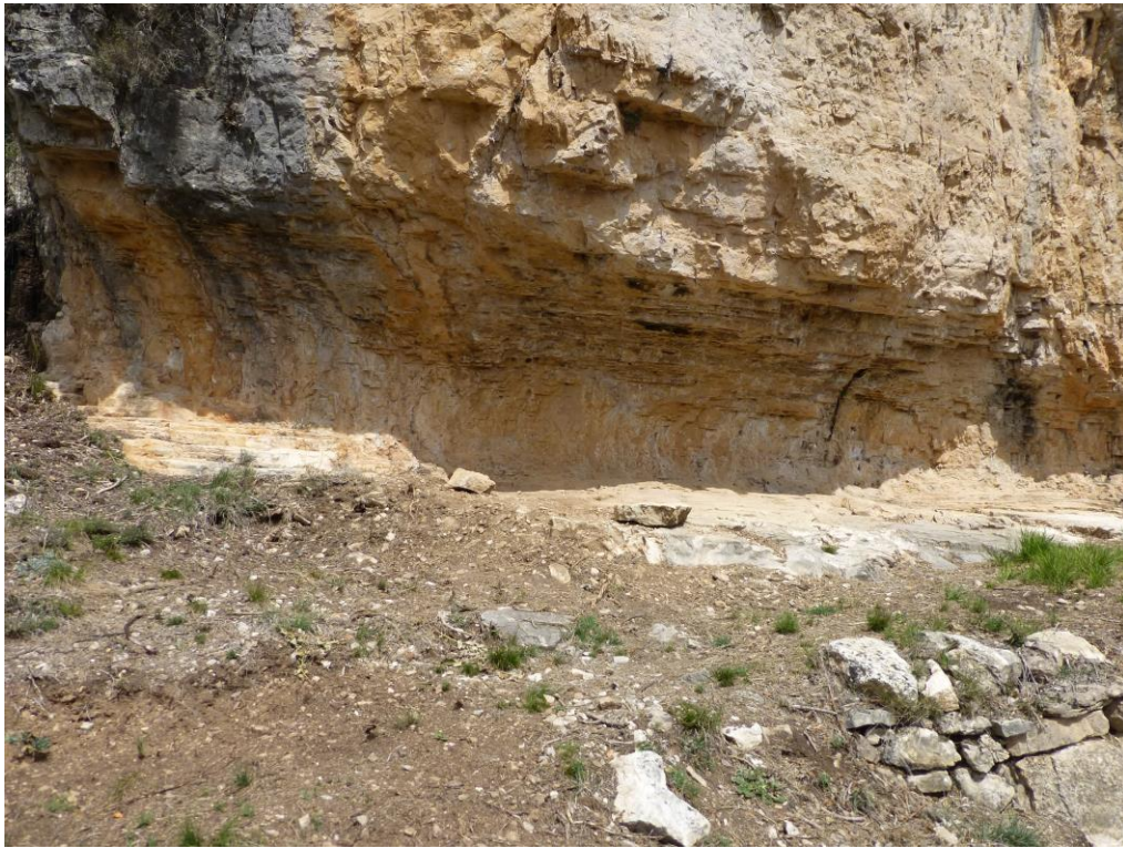
Vista general de l'abric