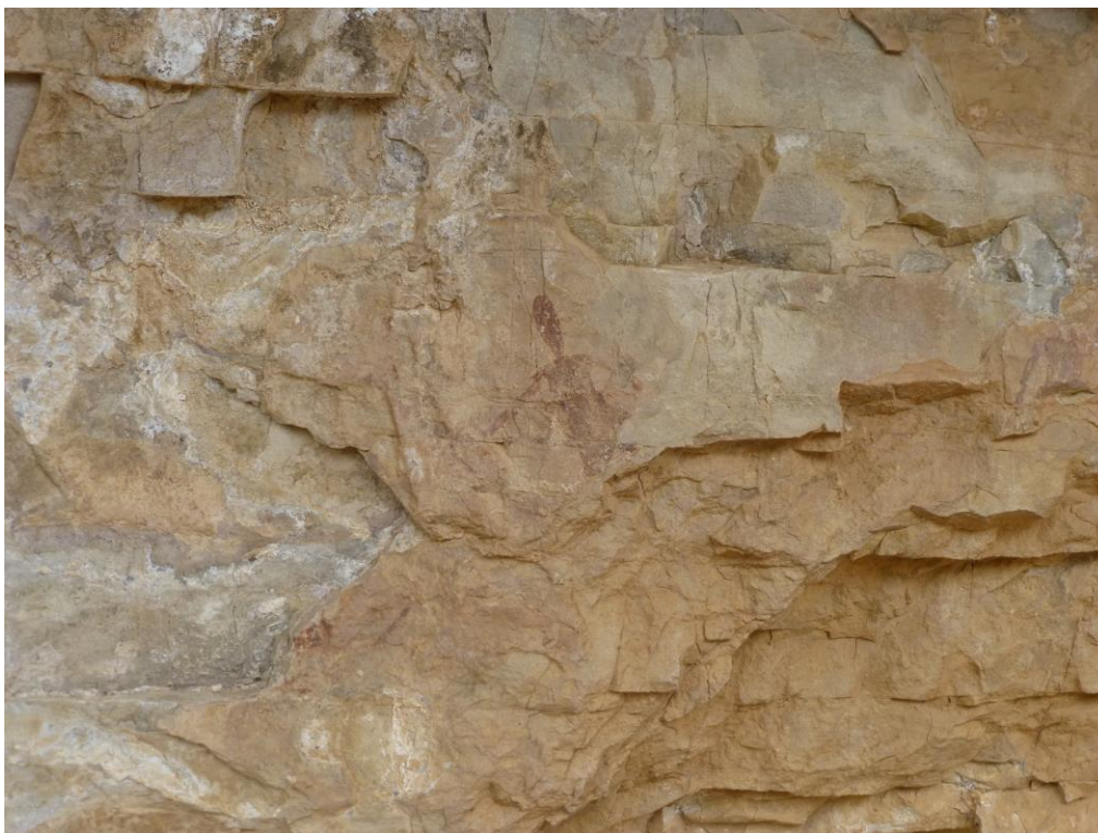
Figura central abans de l' intervenció