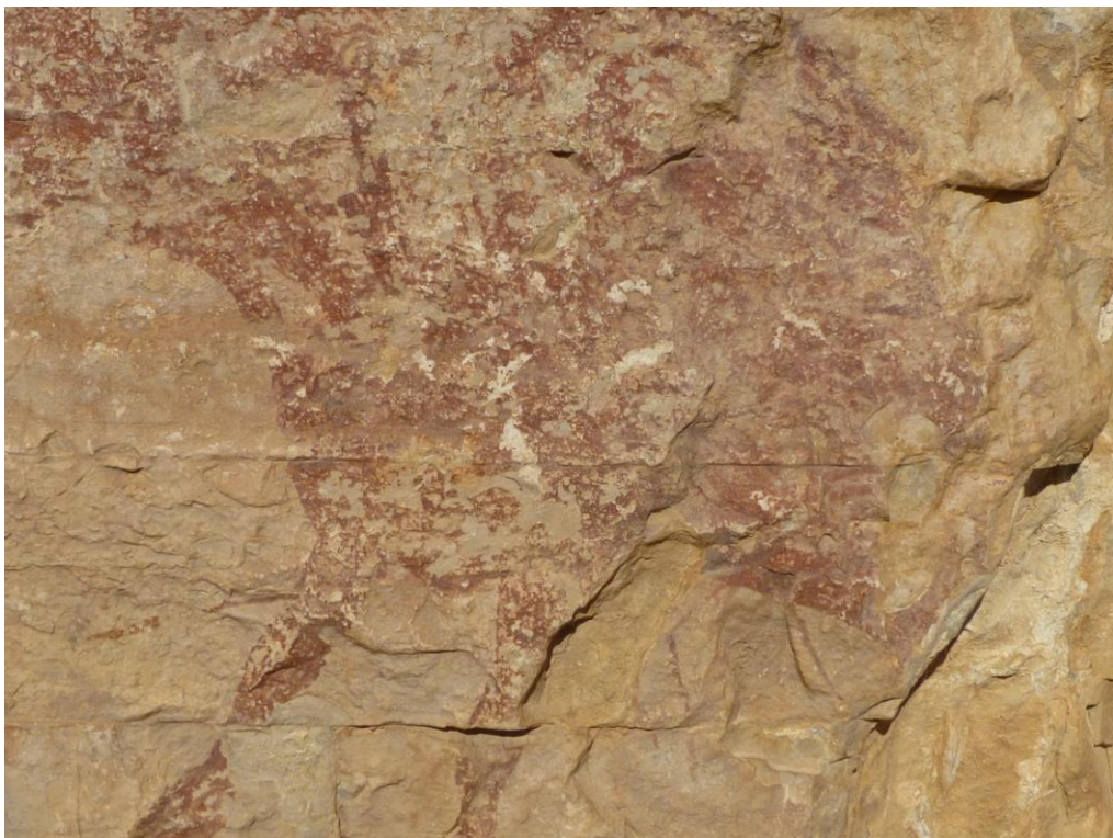
Antics despreniments superficials posats en evidència en la neteja