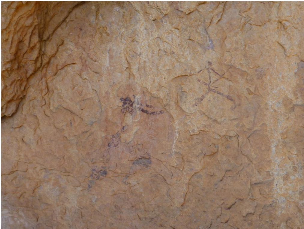
Conjunt abans de la intervenció de consolidació.