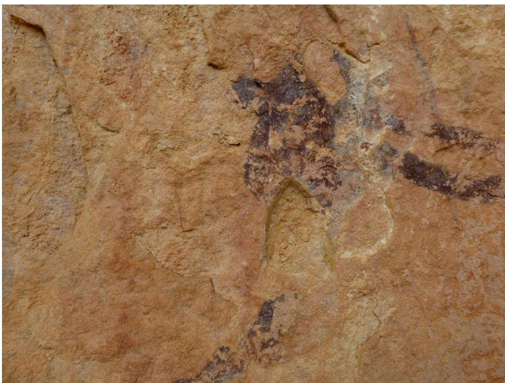
Ídem. Després de la intervenció.