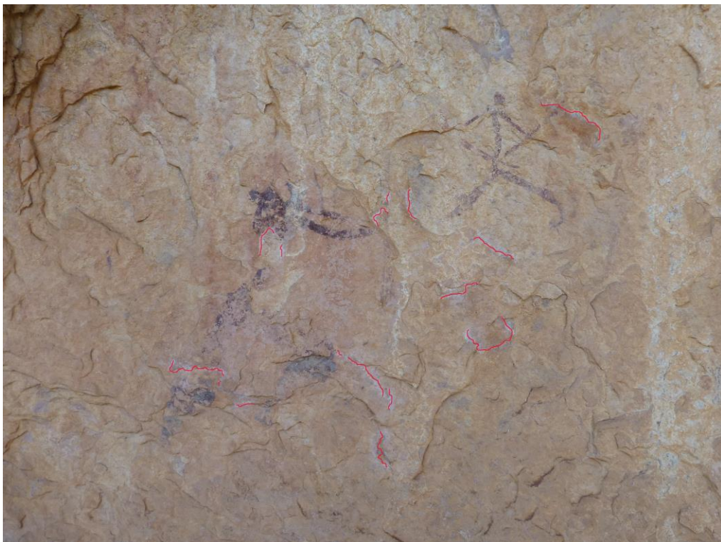
_____ zones on s'ha intervingut.