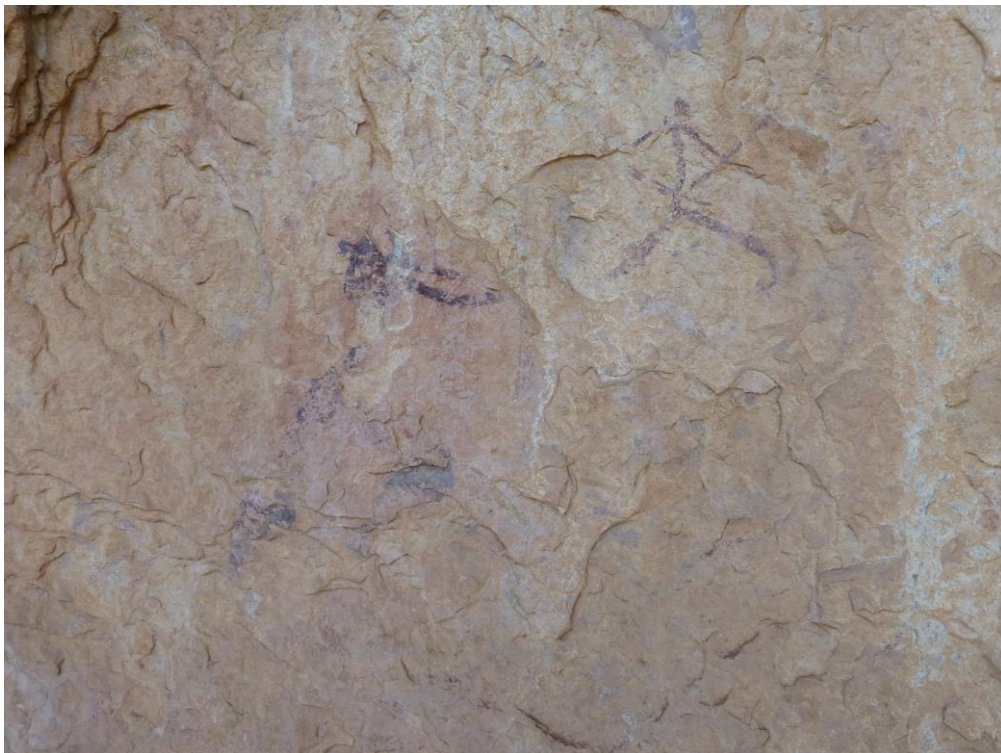
Ídem. Acabada la intervenció.