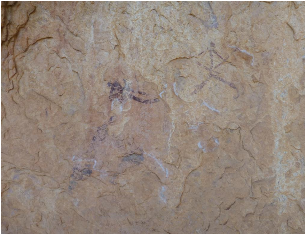
Vista general de l'aplicació de morters.