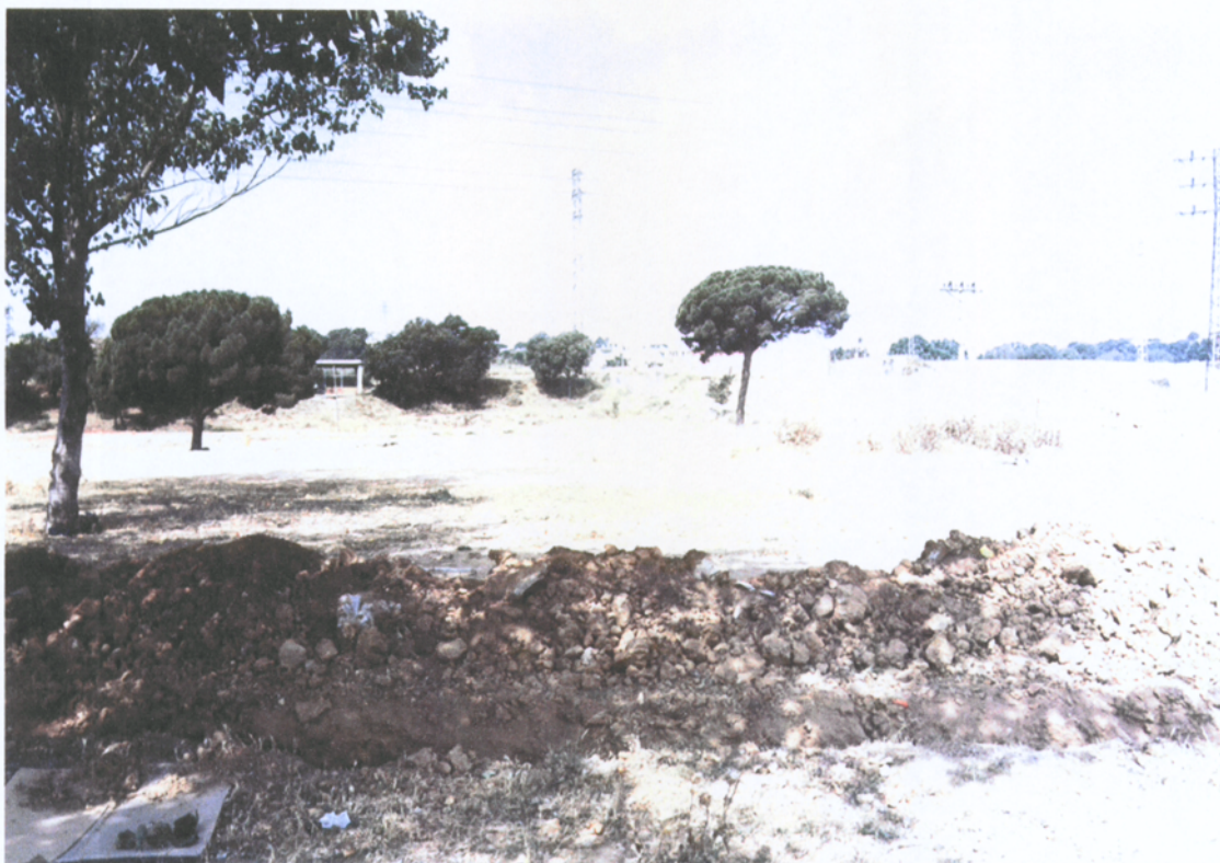
7.3.7 Vista del forn romà (fotografia feta des de la rasa)