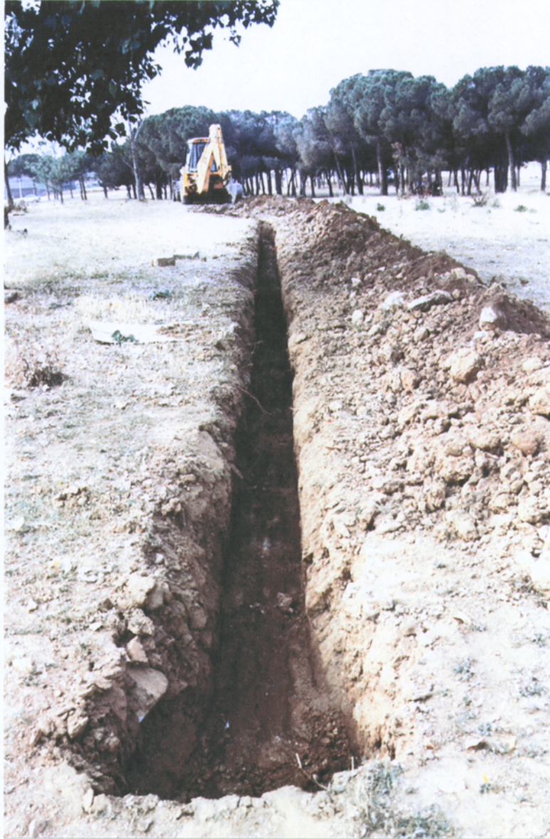
7.3.5 Tram del perfil de la rasa amb el superficial i un nivell remenat