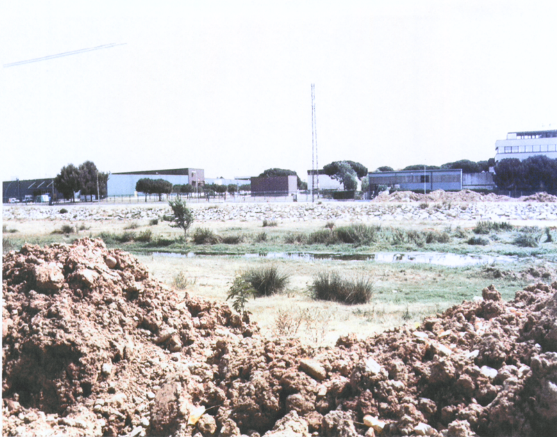
7.3.6 Vista de la Riera de Caldes (fotografia feta des de la rasa)