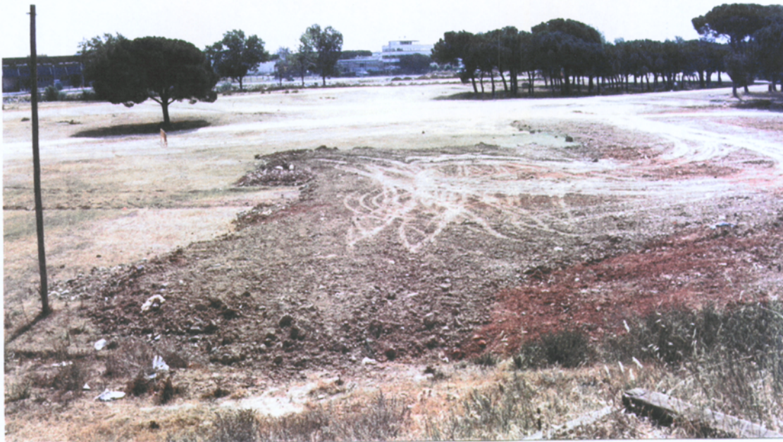
7.3.1 Camp de Ca N'Oller (vista des del forn romà)