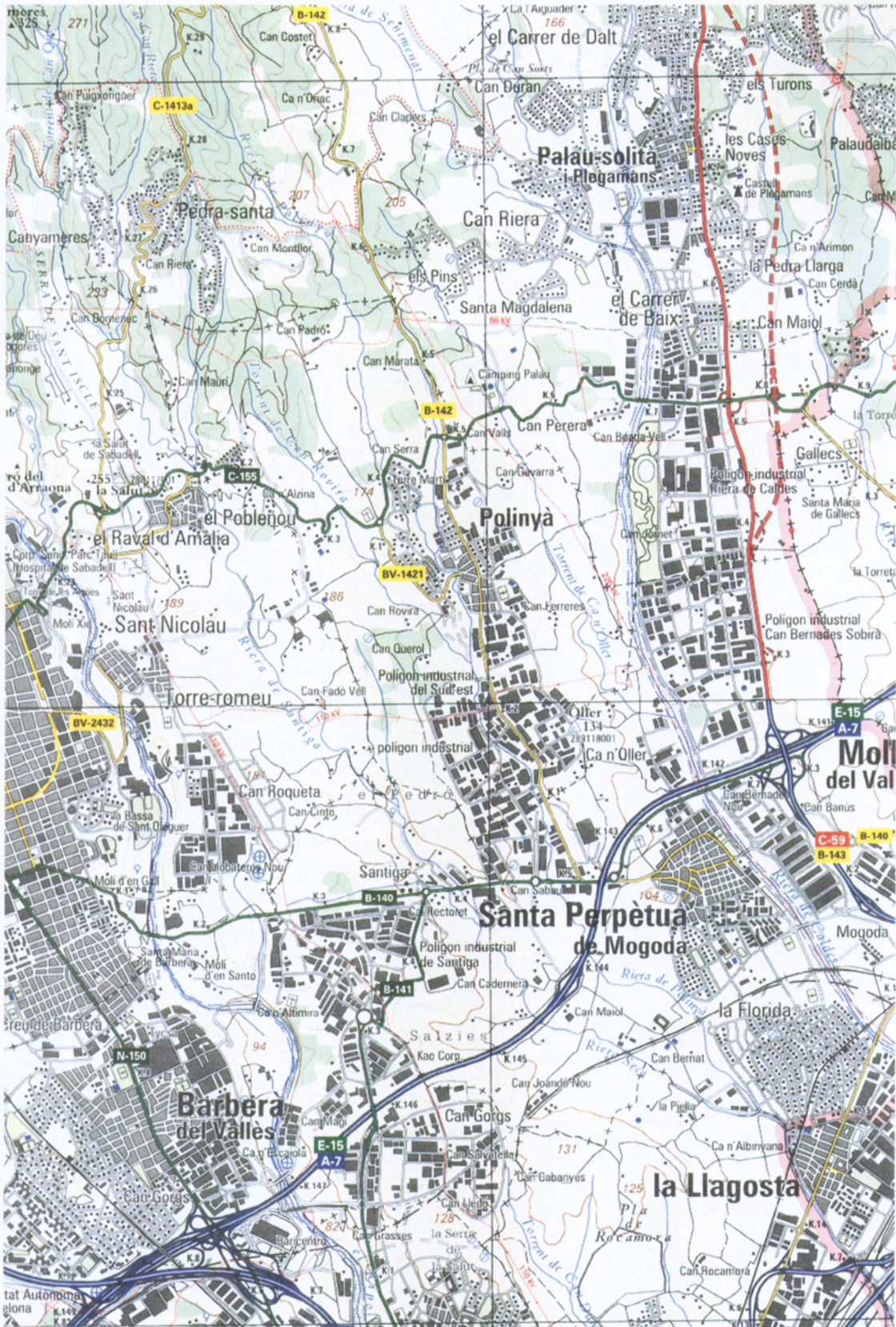
2.1 Mapa comarcal de Catalunya, núm. 41 Institut Cartogràfic de Catalunya. Escala 1: 50.000