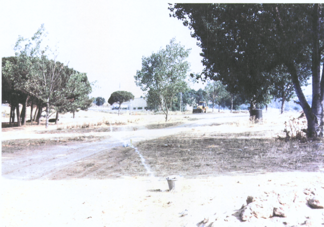
7.3.2 Tram de la rasa a excavar (fotografia orientada a Can Fontanet)