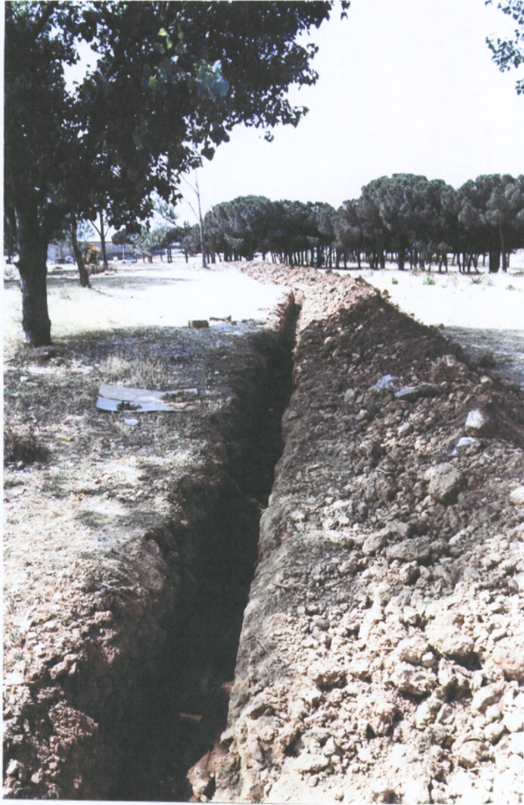
7.3.4 Tram de la rasa una vegada finalitzada (fotografia orientada al Torrent de Ca N'Oller)