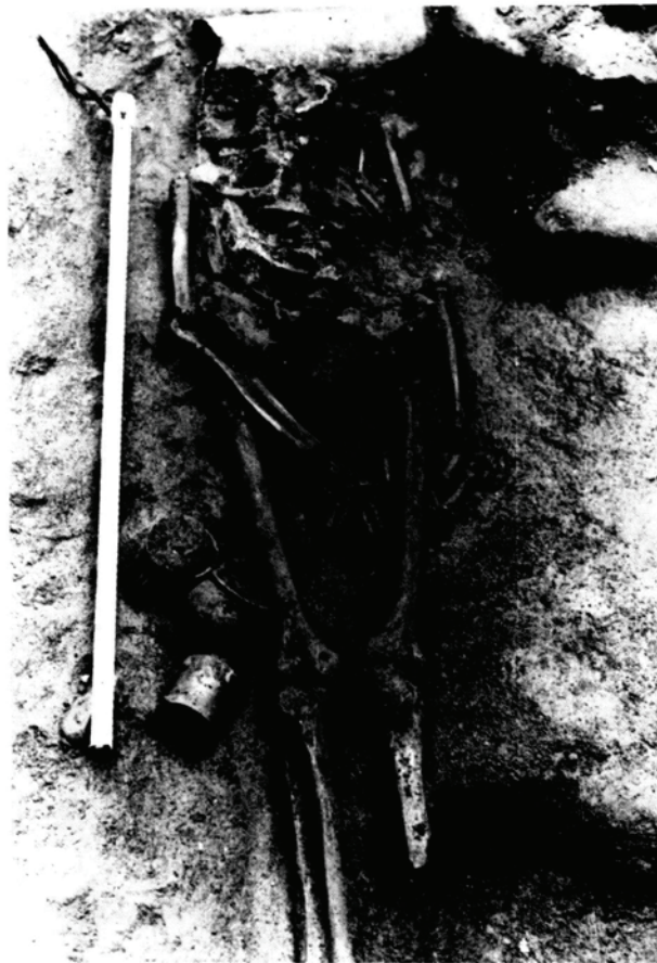
Fotografia 1. Inhumació d'època d'August, amb les ofrenes.

Una altra inhumació, molt més malmesa i de datació més incerta aparegué arran de les escales de l'església, en una de les ampliacions de la zona excavada (sector 6). Tot el sector aparegué molt remogut. L'enterrament estava situat dins d'un nivell datable en el segle I d.C. i portava associat una peça de T.S. Clara forma Hayes 16 (150-200) i una gerreta de ceràmica comuna. Tot i que no es pot asseverar amb certesa la relació directa d'aquestes cerà-