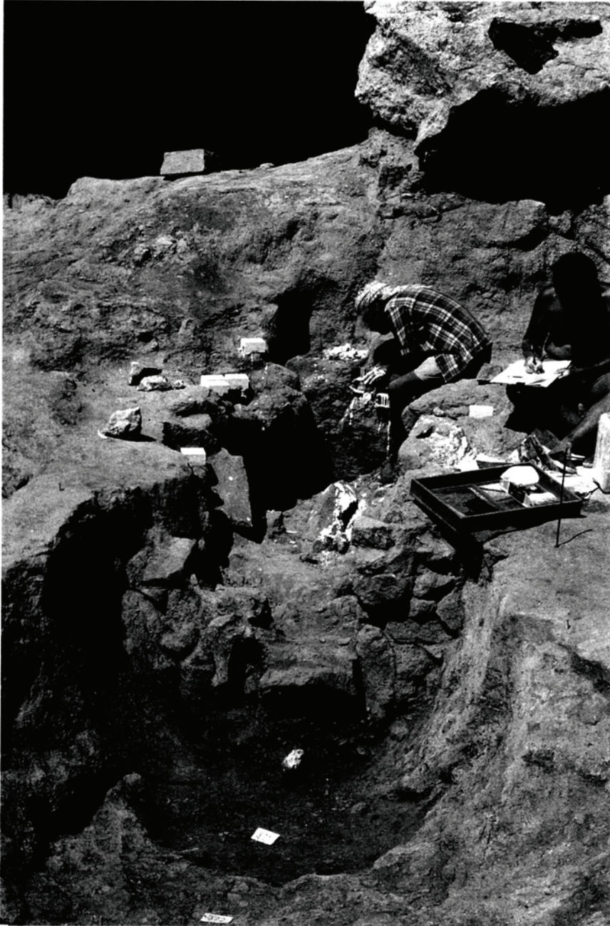
Fig. 2. – Extracció de mostres per a la seva datació arqueomagnètica durant l'excavació del forn CDA-99-H. S'observa, en primer terme, el muret on s'obria l'entrada de la cambra de foc.