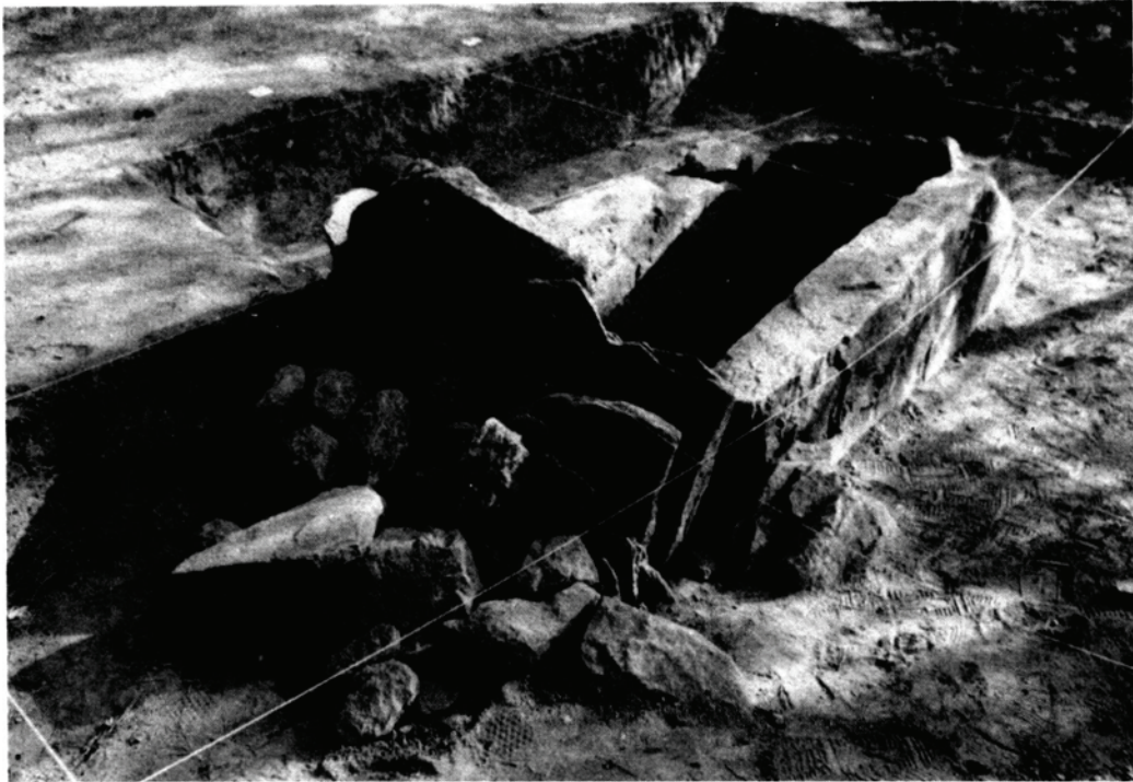
Fig. 2. La cista dels Garrics del Caballol II vista des de l'oest.

segellar aquest punt o sector corresponent a l'original accés a l'interior del vas.