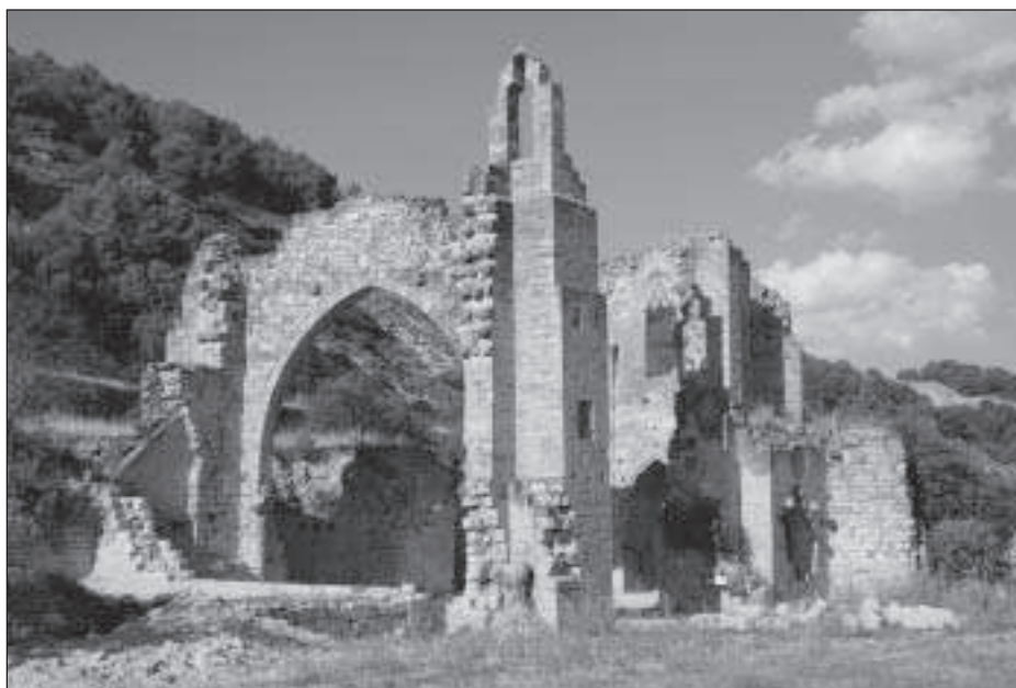
Figura 1. Vista general de l'església de Vallsanta

Pel que fa a l'estructura de l'edifici, sembla clar que presenta tres trams ben diferenciats. Per una banda la capçalera, que és de bon tros la part més ben conservada de l'edifici. A continuació es documenta un primer tram de nau d'uns 9,66 m de costat, en què es documenten els arrencaments d'una volta de creueria i en el qual es van obrir unes capelles laterals de planta poligonal. Finalment, hi ha un tercer tram d'uns 4 m d'amplada, tancat per un mur cec a la banda oest en què es troben les dues portes d'accés al temple. A la banda nord, una porta de factura romànica, amb arc de mig punt i grans dovelles emmarcades amb un guardapols, que comunicava amb l'exterior del monestir. S'hi accedia per una escala en forma de L adossada a la paret occidental del temple. A la banda sud es trobava la porta que comunicava amb el monestir, avui completament destruïda, tot i que per alguns elements localitzats durant la intervenció arqueològica sembla que era també adovellada. El mur de tancament de l'església, construït arran de les dues portes, està construït amb blocs reaprofitats i les fotografies antigues que se'n conserven ens el mostren completament cec.