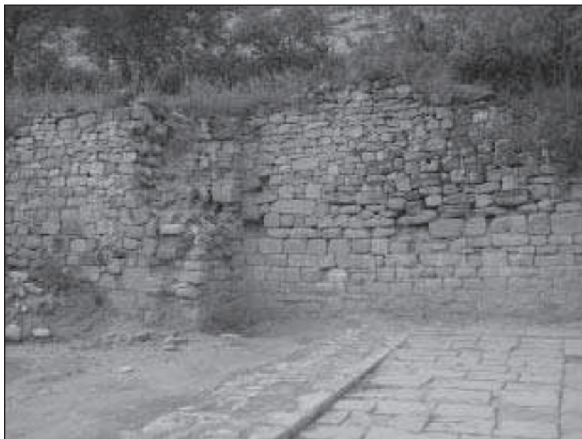
Figura 5. Vista dels murs que podrien correspondre a l'antiga església romànica de Vallsanta

A continuació es localitza una gran sala rectangular en la qual es documenten fins a tres arrencaments d'arcs de diafragma, tot i que no es pot descartar que originalment n'hi hagués algun més. Al centre de la sala es va localitzar un cup de vi de pedra, de planta circular. La presència d'aquest element fa pensar que, almenys en la darrera fase de funcionament del convent, aquest espai havia estat utilitzat com a celler. De tota manera el fet que no s'hagi completat l'excavació de l'espai impedeix determinar si aquest ús de l'edifici és l'original o bé es tracta d'una reutilització més tardana d'una construcció que amb anterioritat havia tingut una altra funció.