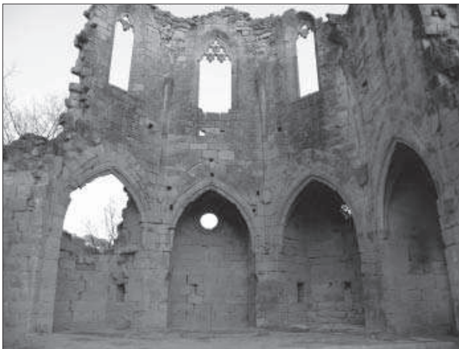
Figura 2. Detall de la capçalera de l'església amb les capelles que conformen l'absis poligonal

Pel que fa a les estructures de coberta, se'n documenten almenys tres elements. En primer lloc els arrencaments de les nervadures d'unes voltes de creueria que segurament conformaven l'estructura inicial de la coberta, almenys de la zona presbiterial i potser del primer tram de la nau. En segon lloc tres arcs diafragmàtics, dels quals només es conserven els arrencaments i que sembla que van constituir una segona fase de la coberta. Finalment, entre el segon i el tercer trams de l'església es documenta un gran arc apuntat fet de carreus de pedra i sostingut per pilastres adossades a la paret de la nau que sembla conformar un reforç modern de l'antiga estructura d'arcs de diafragma.