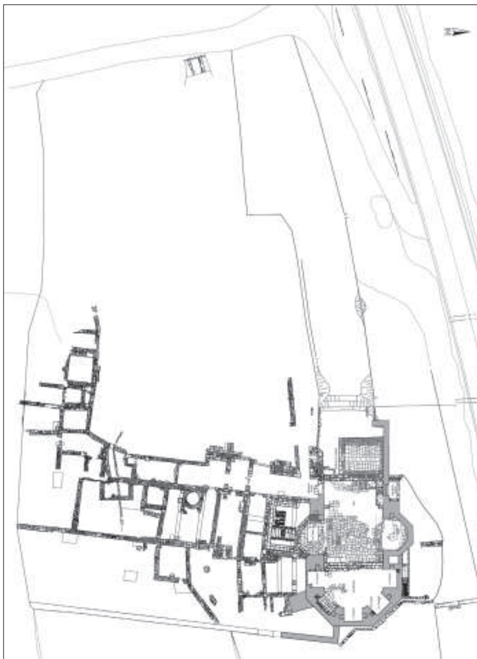
Figura 8. Planta general de les estructures del monestir