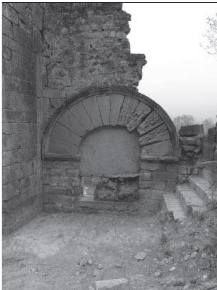
Figura 3. Vista de la porta d'entrada des de l'exterior a l'església. S'observa la seva factura romànica i el fet que està col·locada en un espai clarament més petit que el que necessitaria la porta per les seves dimensions

A la banda nord de l'església es localitzava el petit cementiri monàstic, tancat per un mur adossat a la paret exterior de la capella poligonal d'aquell costat. En aquest mur s'obria una porta que permetia l'accés al cementiri des de l'exterior del convent. El cementiri estava conformat per tombes en fossa simple excavades en el terra i per altres de tipus monumental adossades a la paret de l'església, de les quals se n'han pogut identificar tres.