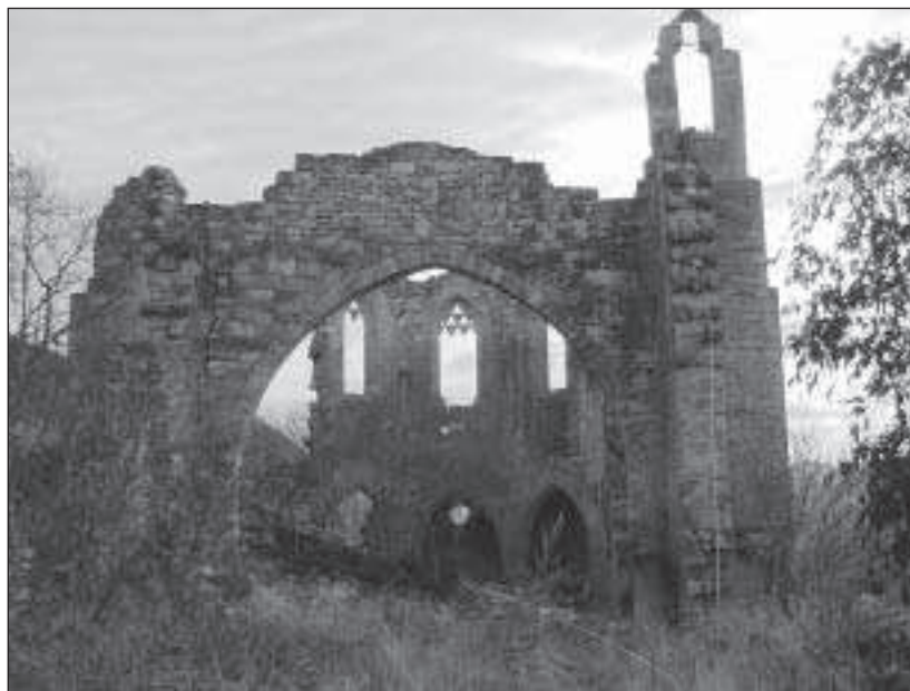
Figura 4. Vista de l'església en el moment d'iniciar-se la intervenció del 2008

Al sud de la sala capitular es documenten dues estances rectangulars, amb accés també des de la banda occidental i de funció indeterminada. Aquests espais estan molt transformats tardanament i el fet que no s'hagi pogut completar la seva excavació dificulta la comprensió de la seva funció i estructura originals.