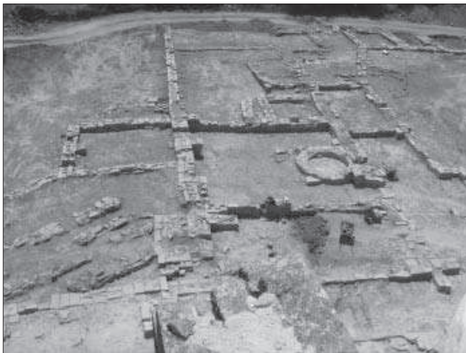
Figura 10. Vista general de les estructures conventuals delimitades al final de la intervenció del 2010

Si bé aquesta estructura és clarament la que devia tenir el monestir de Vallsanta en el moment del seu tancament i almenys durant tot el segle XVI, no podem assegurar que ja des del començament el monestir s'organitzés d'aquesta manera. Tant els murs apareguts durant la campanya d'octubre del 2011 a la banda nord del pati, com algunes parets documentades dins les cases del costat meridional són sens dubte traces d'una organització anterior, que avui encara no podem visualitzar i que només una excavació extensiva del conjunt permetrà estudiar. En aquesta possible fase més antiga és on tindrien cabuda elements com ara el suposat claustre amb unes determinades dependències al seu entorn o la primitiva església del monestir.