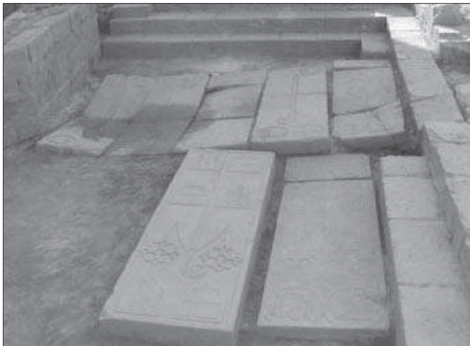
Figura 6. Vista de les làpides aparegudes a l'interior de la sala capitular de Vallsanta

L'any 2010 es va endegar una nova campanya d'excavació arqueològica en la qual es van continuar els treballs de delimitació de les estructures de l'antic convent i es va completar l'excavació de dos espais dins del conjunt monacal. En primer lloc la sala capitular en la qual es van identificar un total de set làpides sepulcralcs corresponents a sengles abadesses i priores del monestir.