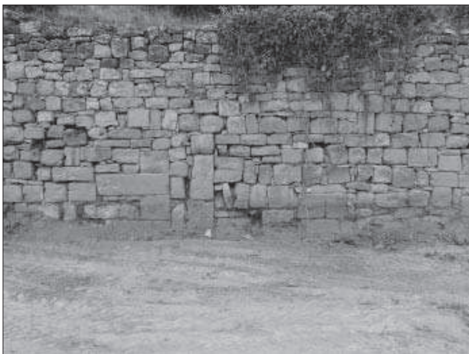
Figura 9. Detall de les traces d'antigues portes de les cases de les monges que es conserven en el mur que delimita la terrassa nord del convent

En relació amb les estructures d'aquestes cases tenim altres notícies de tipus documental relacionades amb obres que s'havien fet en alguns d'aquests edificis i que ens permeten fer-nos una idea millor de la seva estructura. Disposem, en aquest sentit de les dades que ens aporta un contracte, datat del 7 de maig de 1514, que Maria d'Esplugues monja escolana de Vallsanta fa amb un mestre de cases i fuster de Guimerà per tal que li construeixi una casa al costat de la d'una altra monja de cognom Comelles. A partir de les clàusules d'aquest contracte podem seguir una mica l'estructura de l'edifici que es volia construir i que cal pensar que devia ser molt semblant al que tenien la resta de membres de la comunitat. 13