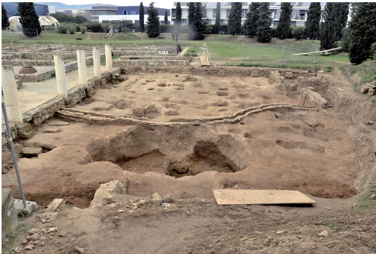
Figura 5. Vista del peristil 1 de la vil·la

Sabem, doncs, que el peristil tenia, almenys en els dos límits coneguts, una zona porxada pavimentada amb un mosaic amb temes decoratius geomètrics fet amb tessel·les blanques i