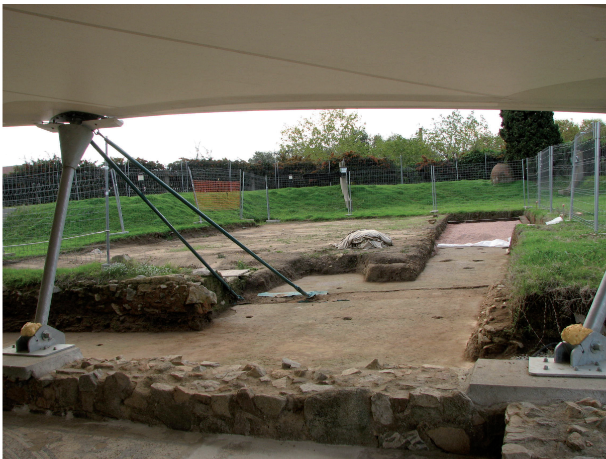
Figura 6. Vista del peristil 2 de la vil·la

Es tracta d'un enorme recinte de planta rectangular pavimentat amb opus signinum d'una gran qualitat i conservació excel·lent, el qual calculem que té una superfície mínima d'uns 410 m 2 . Possiblement era un espai descobert voltat per un porxo, del qual hem trobat el sostre caigut. Fins al moment no s'han localitzat els elements de sustentació de la teulada del porxo, l'amplada mínima del qual era de 4 m. Interpretem aquest espai com un altre peristil que devia tancar la pars urbana de la vil·la pel seu costat oest, un pati amb un ampli porxo que devia proporcionar la llum necessària a les estances principals de la vil·la.