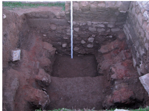
Figura 2. Forn de la primera fase. Cella vinaria

Durant el segle VI dC –quarta fase– s'abandonà l'activitat industrial en l'indret, en el qual s'excavaren una sèrie de sitges o de fosses