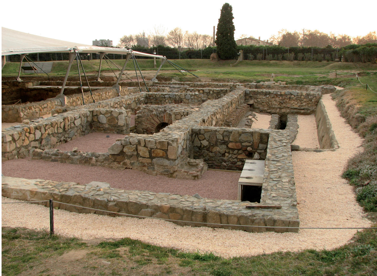
Figura 4. Sector de les termes de la vil·la

cumentats per Marià Ribas en els anys seixanta (Ribas, 1972, 127-129) i un quart localitzat posteriorment per Marta Prevosti i Joan Francesc Clariana (Clariana, Prevosti, inèdita). El forn més gran està format per dues cambres rectangulars, comunicades entre si a través d'una obertura que enllaça amb el praefurnium i que correspon al tipus II c de Cuomo di Caprio. El segon forn, destruït l'any 1969 en reurbanitzar el sector, estava situat a l'est de la zona residencial. Segons Marià Ribas aquest forn conservava encara part del paviment de tovots cremats, de 3,60 x 4,80 m. Caiguts sobre aquest paviment hi havia altres tovots que devien formar part de les parets del forn. Del tercer forn, que es va localitzar al sud de la zona residencial, únicament se'n conservava el fons, que tenia unes dimensions de 2,5 x 2,5 m. El quart forn, documentat per Prevosti i Clariana, es va localitzar sota del triclini. Es