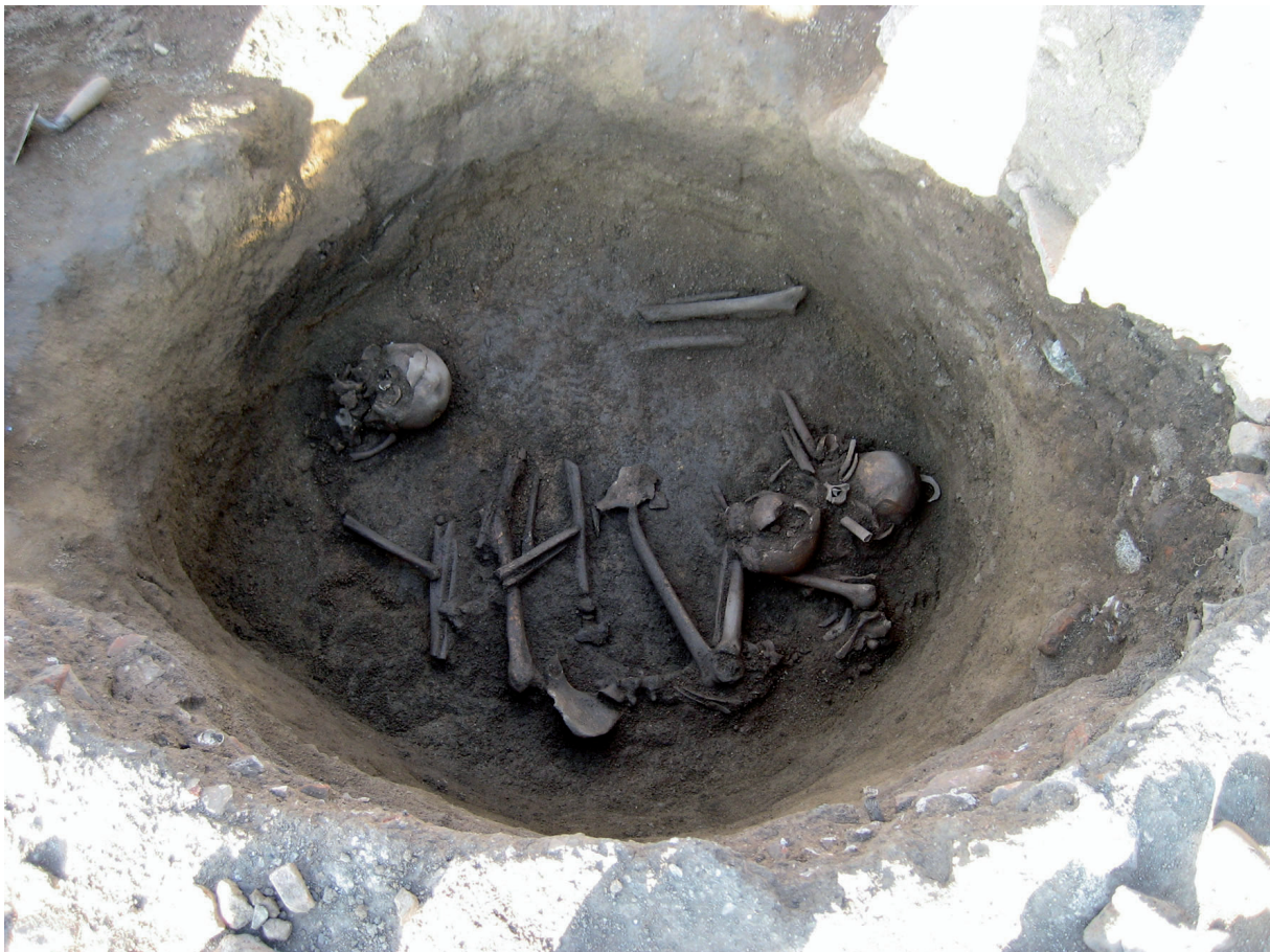
Figura 7. Fossa reutilitzada com a tomba col·lectiva. Fase 5

L'excavació i estudi posterior de les restes òssies fou encarregat a Núria Armentano, del Grup d'Investigació en Osteobiografia (GROB) de la Unitat d'Antropologia Biològica del Departament de Biologia Animal, Biologia Vegetal i Ecologia de la Universitat de Barcelona. L'anàlisi de les restes va determinar que els ossos corresponien a tres adults i a un nen. El sexe de dos dels individus adults s'ha pogut determinar bàsicament a partir de l'estudi dels cranis. Del tercer individu adult no se n'ha pogut determinar ni l'edat ni el sexe, perquè únicament es conservaven tres fragments de diàfisi d'os llarg.