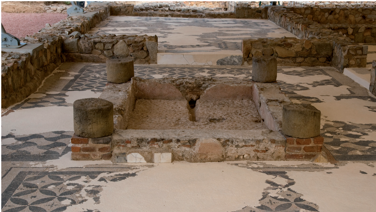
Figura 3. Atri de la vil·la

acurat del material, situem en el primer quart del segle I dC.