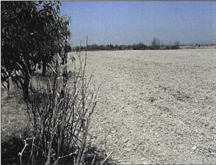
CAMP AMB EL POSSIBLE JACIMENT