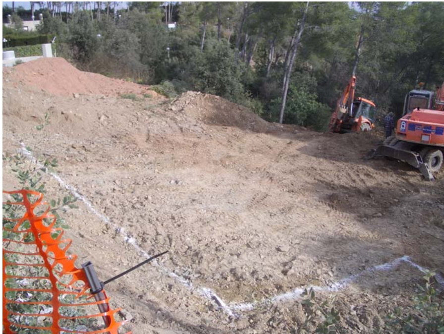
Treballs de desbrossament i excavació