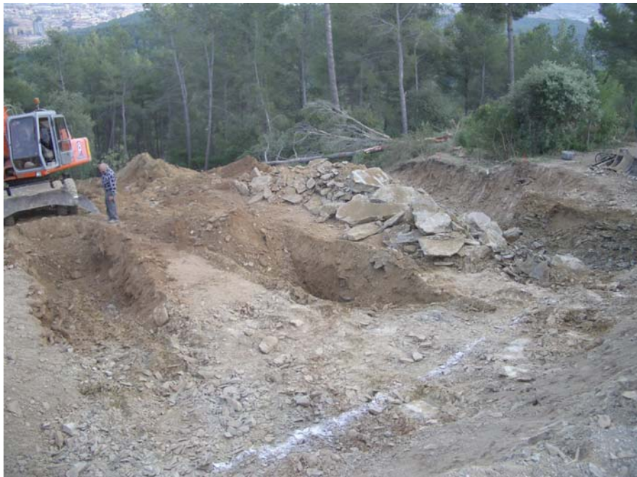
Treballs de desbrossament i excavació