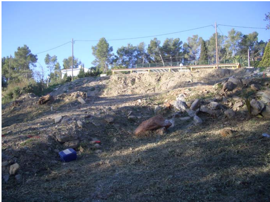
Vista general del solar abans d'iniciar els treballs