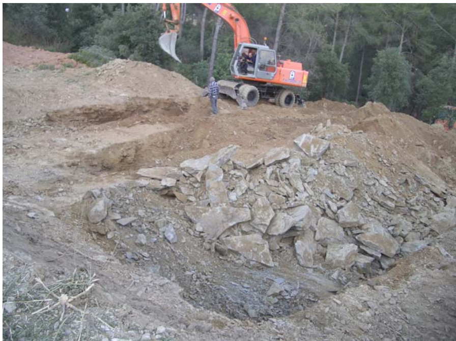
Treballs de desbrossament i excavació