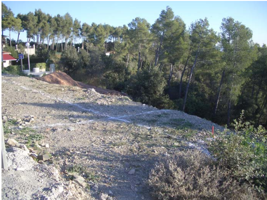
Vista general del solar abans d'iniciar els treballs