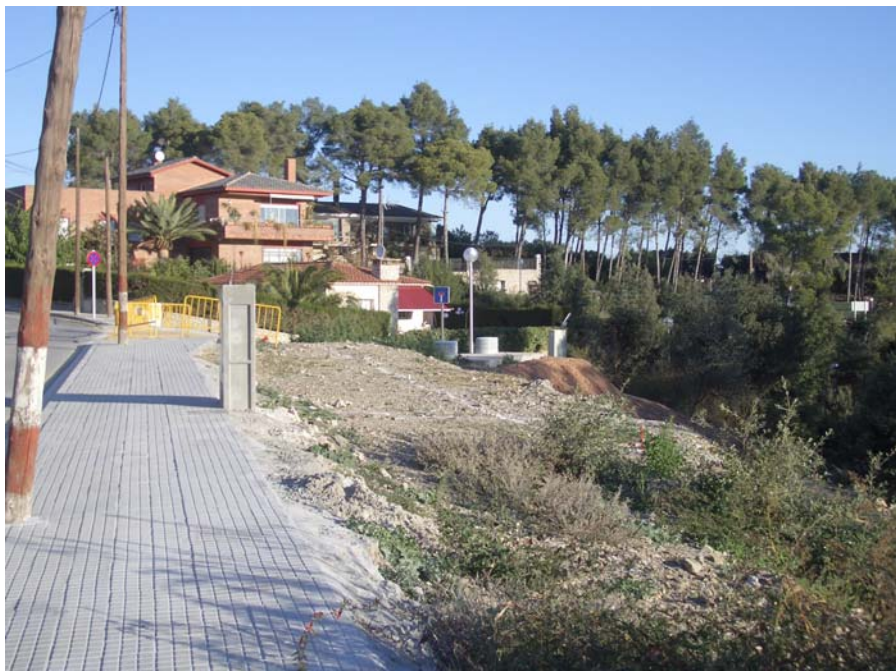
Vista general del solar abans d'iniciar els treballs