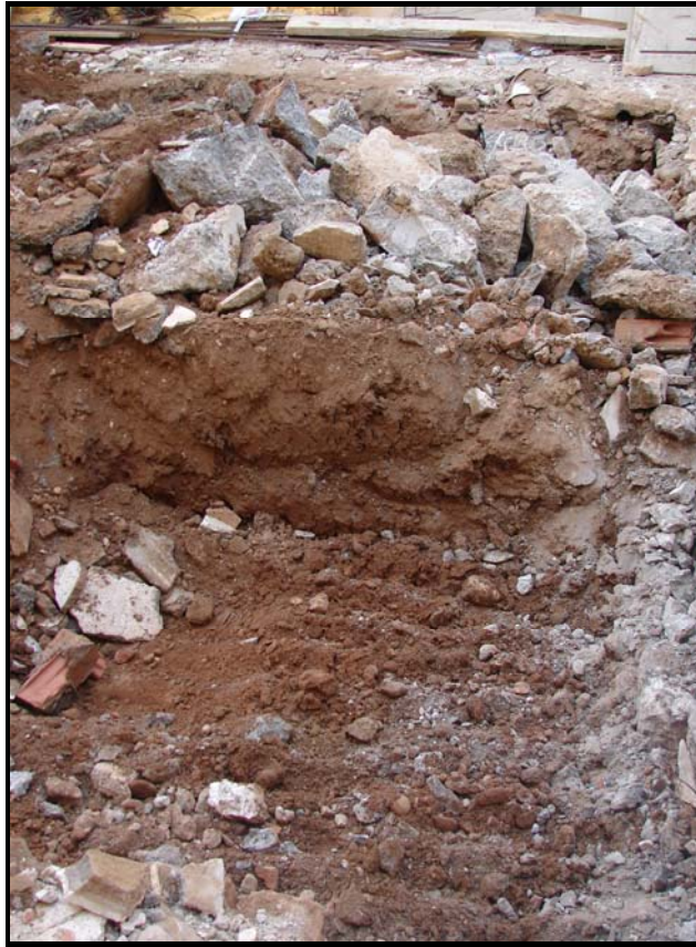
Fig 6. Fotografia d'inici de la intervenció (17-XII-07).