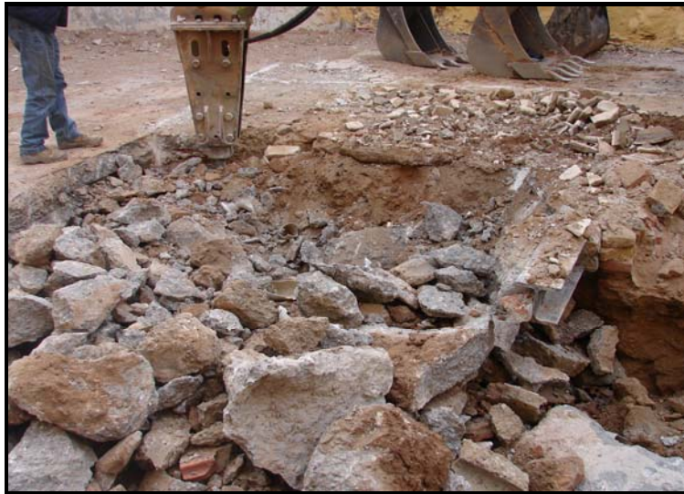
Fig 7. Fotografia de les tasques d'extracció dels paviments de formigó (17-XII-07).

En les tasques d'extracció del sediment de la zona acotada per la realització del fossat de la grua, s'ha tingut que utilitzar en funció de las variables antròpiques i sedimentològiques diverses pales i eines de la excavadora. Com tal de extrair els paviments de formigó (0'50 metres de grossor) del sector nord-est hem utilitzat una picadora que durant un dia ha estat trencant i extraient formigó i ferros de l'antiga estructura o edifici.