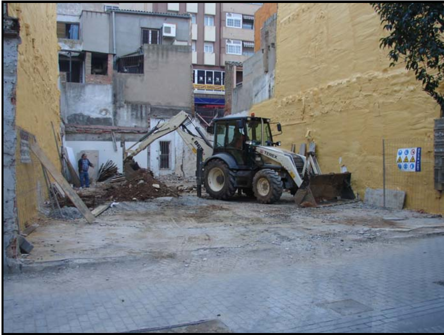
Fig 5. Fotografia d'inici de la intervenció (17-XII-07).