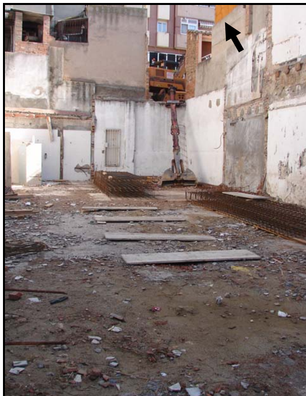
Fig 3. Parcel·la abans del rebaix de terreny.