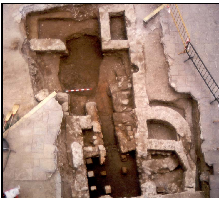
Fig 4. Fotografia de part de les termes romanes a la Plaça del Dr. Guardiet (Goretti Vila, 1994).

Aquesta intervenció arqueològica també va deixar al descobert part d'una necròpolis d'època medieval que ocupava la major part de la plaça.