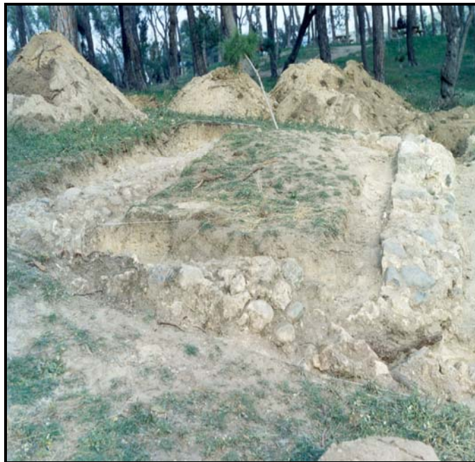
Fig 4. Restes muràries d'una vil·la romana a Ca n'Oriol (segles III-V dC)(Guàrdia, Moret i Belmonte).

Dins el terme municipal de Rubí s'hi troben diversos i importants jaciments arqueològics que indiquen una ocupació humana continuada d'aquest espai des d'època prehistòrica, passant per la protohistòria i el món romà, fins a l'època medieval. Les restes arqueològiques més importants es troben a les zones de Can Fatjó, Ca n'Oriol, Castell de Rubí i la Serreta.