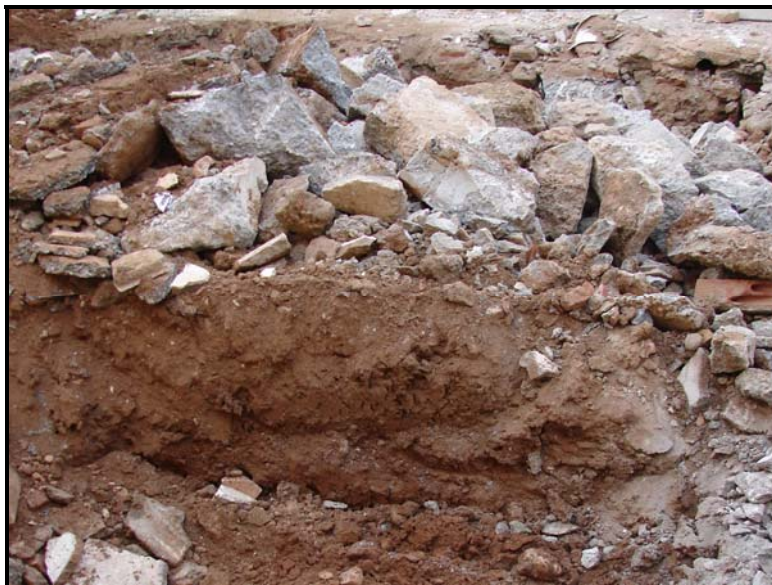
Fig 8. Fotografia de les argiles remogudes, substrat de les estructures recents (17-XII-07).

Aquests "estrat" recent (anys 60) trencava i s'adossava sobre un nivell d'argiles molt orgàniques producte possiblement de les remocions prèvies a la urbanització més antiga d'aquesta parcel·la.