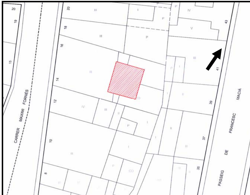
Fig 2. Detall plànol del solar 14-16, en vermell espai d'intervenció.