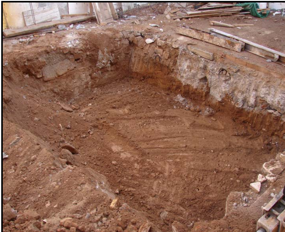
Fig 10. Foto final de l'intervenció.

En aquest sediment de deposició natural tampoc es va documentar cap evidència patrimonial.