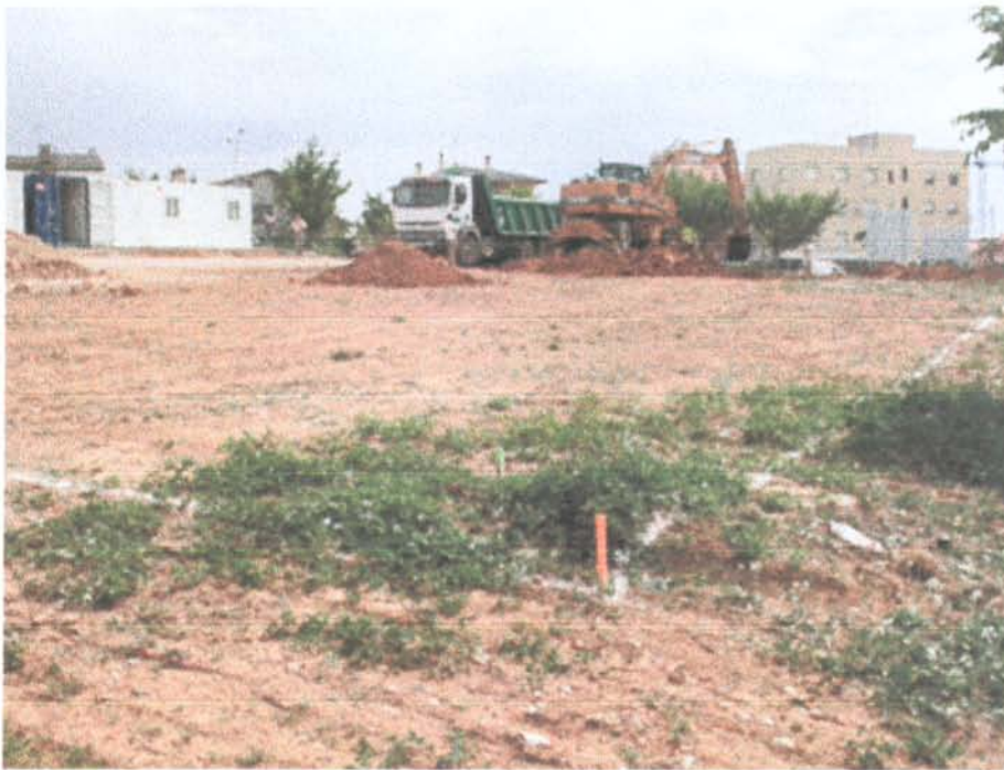
Fig. 1 .- Panoràmica de la parcel·la iniciant-se els treballs d'extracció de terra.

Les obres de construcció d'un bloc de vivendes de protecció oficial al número 2-4 del carrer Cordova del terme municipal de Cerdanyola del Vallès (Vallès Occidental) han provocat que s'actui sobre terrenys afectats pel Pla Especial de Protecció de Patrimoni Arquitectònic aprovat el 17 de març de 2003. Les parcel·les, de propietat pública pertanyents a l'Institut Català del Sòl, donat la seva ubicació dins una zona d'expectativa arqueològica, estan incloses en la fitxa nº 85 del citat Pla, amb el nom de jaciment de Can Planes/Serragalliners.