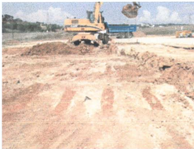
Fig.4 .- Distribució de les rases de vinya

Aquestes rases de vinya, donat les característiques del seu rebliment, es van poder delimitar amb certa facilitat (fig. 4). El contingut del esmentat rebliment estava format per una notable presència de cendres, així com també un