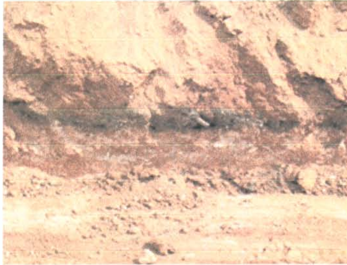
Fig. 5 .- Secció del nivell de rebliment d'una de les rases de vinya.

En la zona prospectada es coneixia l'existència d'una mina d'aigua que travessava el terreny en direcció nord-est sud-est però a una cota sensiblement més baixa per la qual cosa no es va arribar a tocar. Entre la terra remoguda van aparèixer tot un seguit de materials, tot ells contemporanis, de diversa natura (deixalles, restes de material constructiu, ampolles de vidre, etc). Amb tot, no es va poder detectar cap rastre d'alguna possible estructura arqueològica, només alguns petits fragments rodats de ceràmica ibèrica.