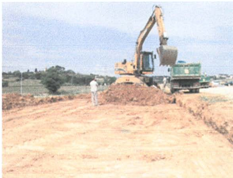
Fig. 3 .- Imatge de la màquina treballant a la parcel·la.

Entre els dies 23 i 31 de maig del 2007 es varen dur a terme les tasques de control arqueològic. Aquests treballs van consistir en supervisar els treballs mecànics que successivament van anar retirant la capa superficial alterada pel conreu (capa d'entre 30 i 45 cm de gruix) fins arribar al nivell de sòl natural. En cada passada que realitzava la màquina es prestava la deguda atenció per tal de detectar la possible existència d'evidències que poguessin indicar la presència al terreny d'estructures arqueològiques.