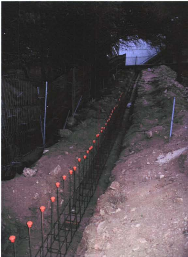
Figs. 2 i 3- Vistes generals de les rases de fonamentació de la paret de tanca de la parcel·la Puig i Cadafalch 36.