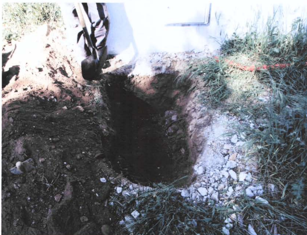
Figs. 2 i 3. A dalt, foto de situació i, a sota, detall de la rasa oberta al carrer Vespasià 3.