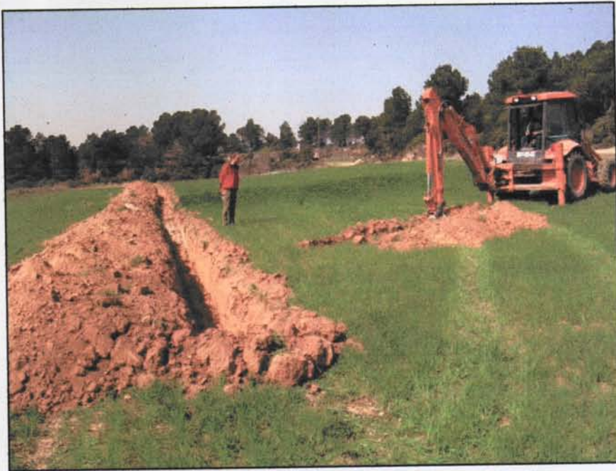
Foto 5. Seguiment Rasa 8.