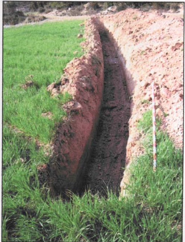
Foto 10. Vista final Rasa 9.