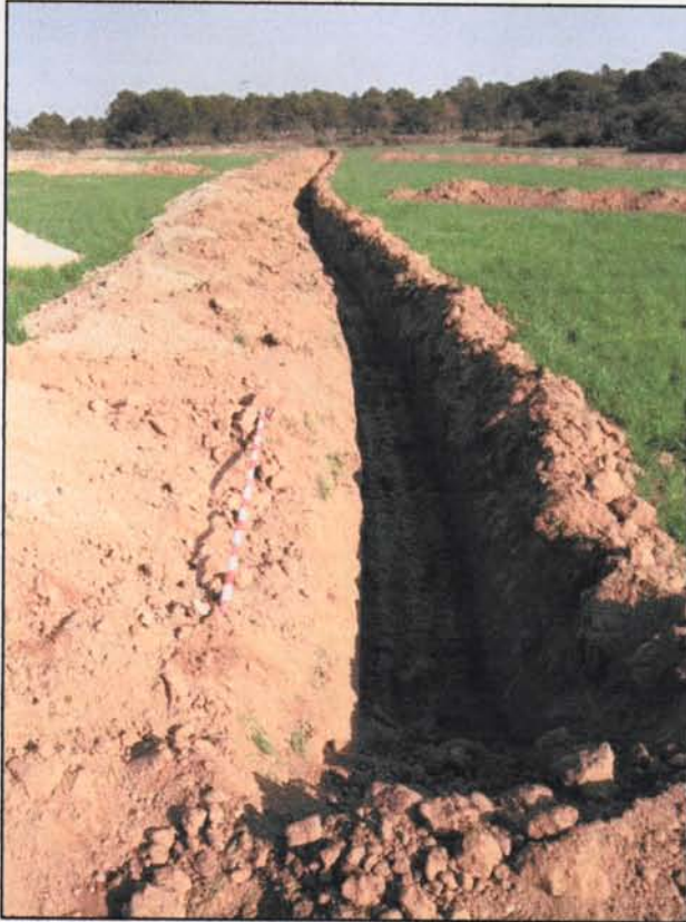
Foto 9. Vista final Rasa 1.