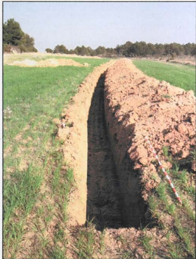
Foto 12. Vista final Rasa 2.