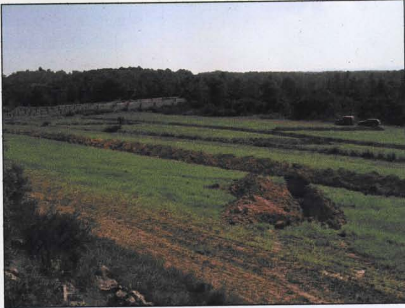
Foto 7. Vista general una vegada acabada la prospecció arqueològica.