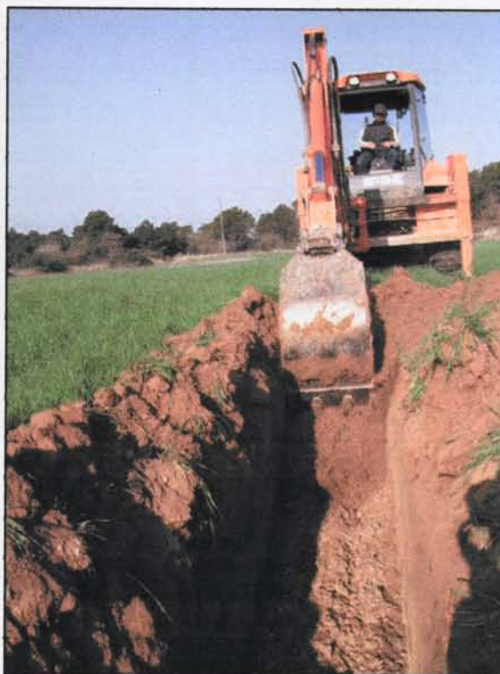
Foto 2. Seguiment Rasa 1.