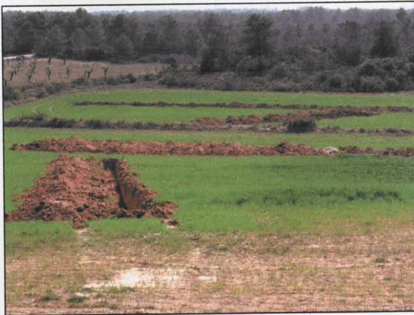
Foto 8. Vista general una vegada acabada la prospecció arqueològica.