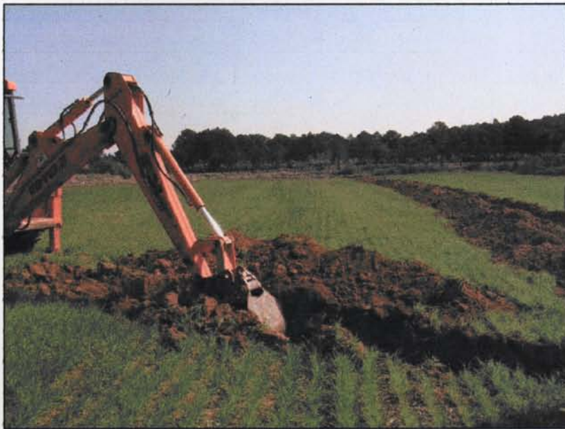
Foto 4. Seguiment Rasa 5.