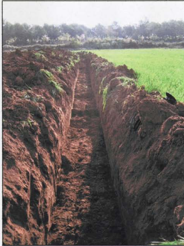
Foto 3. Vista general Rasa 1.