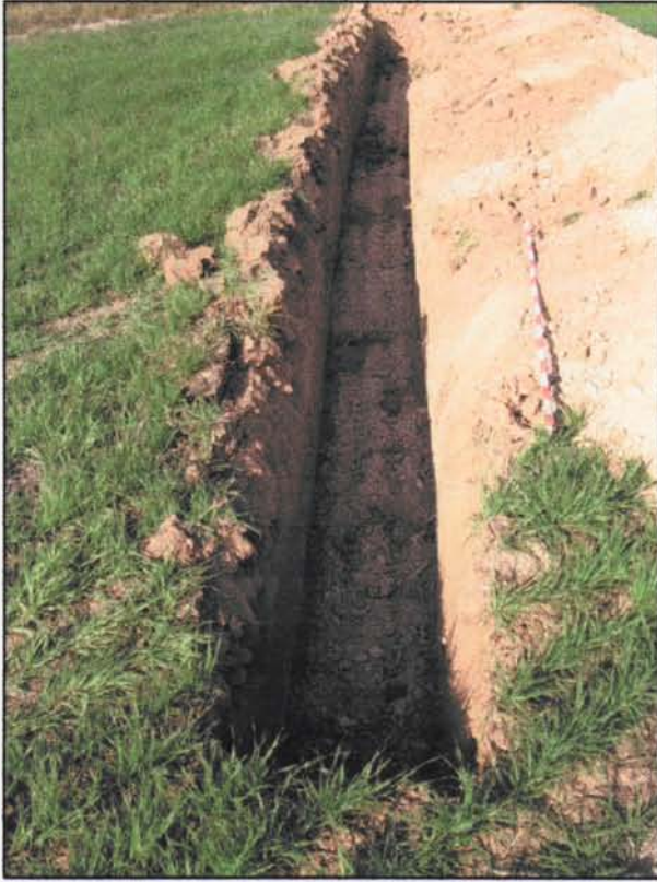
Foto 11. Vista final Rasa 5.