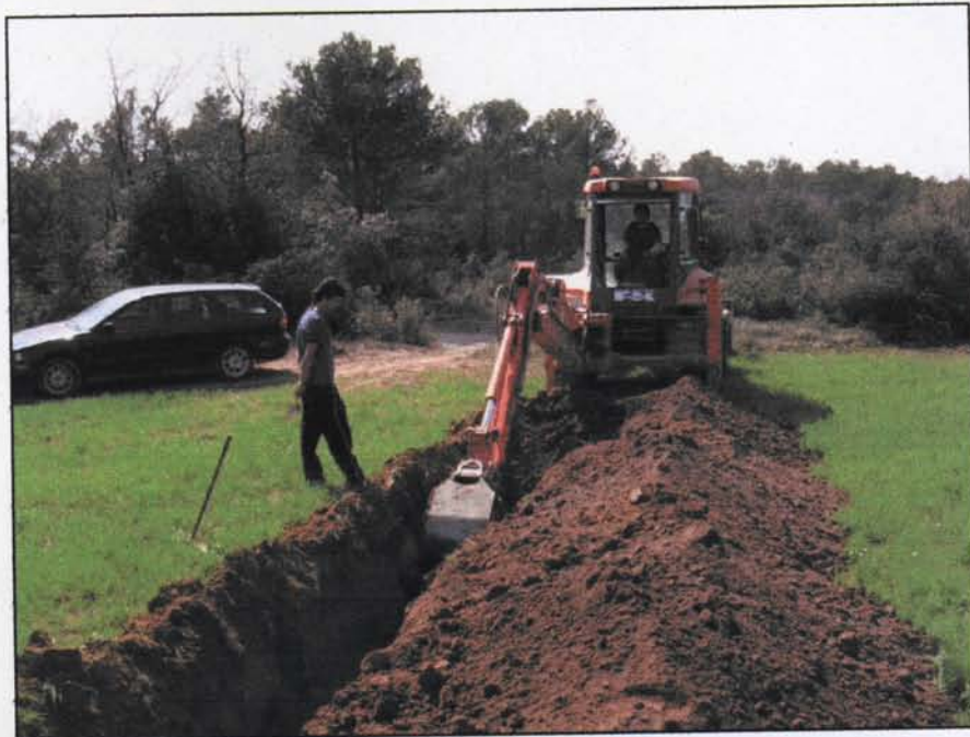
Foto 6. Seguiment Rasa 3.