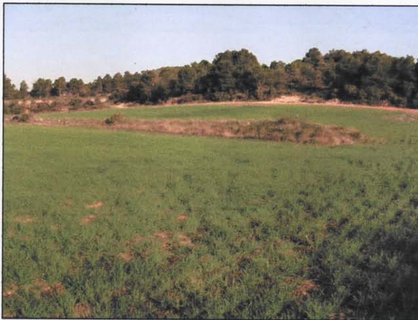
Foto 1. Vista general abans del seguiment arqueològic.