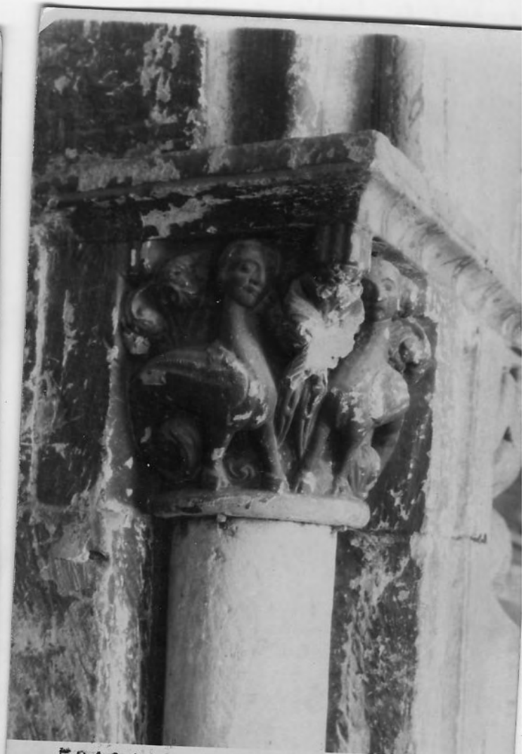
50104 C Salamanca Seu vella