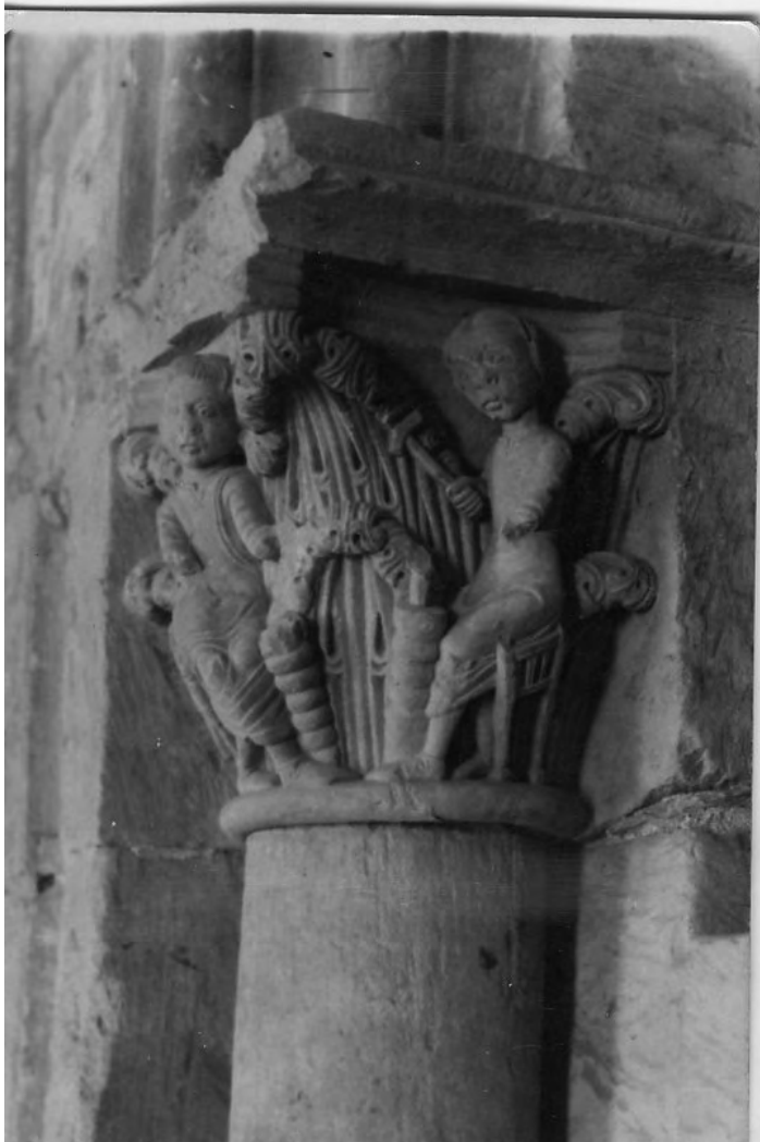
50105 C Salamanca. Seu Vella