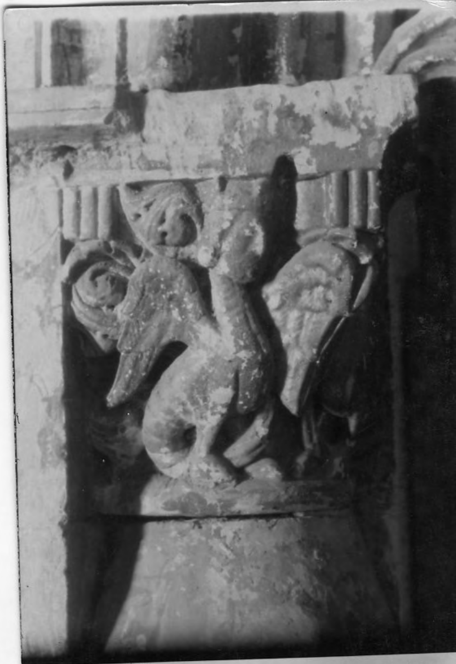
50110 c Salamanca Seu Vella