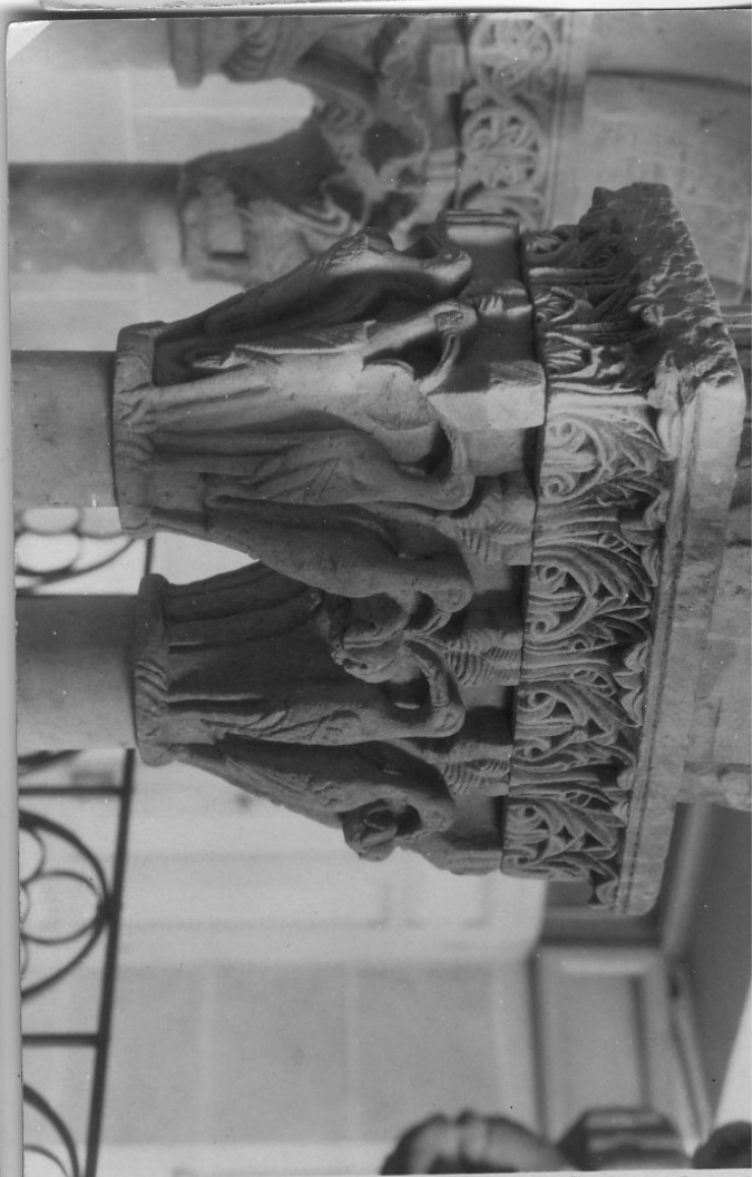
50494 C Salamanca Col. de la Vega