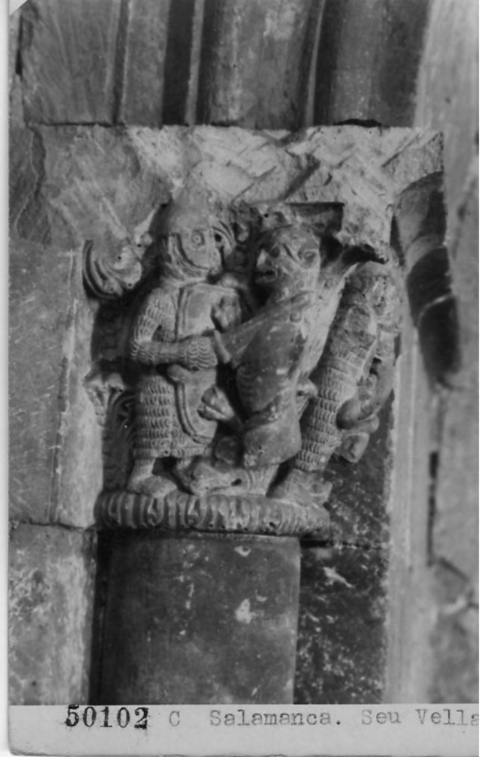
50102 C Salamanca. Seu Vella