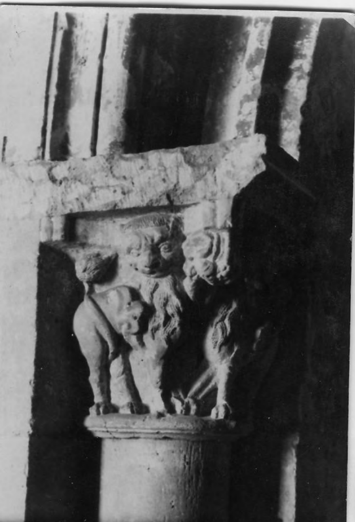
50101 C Salamanca. Seu vella