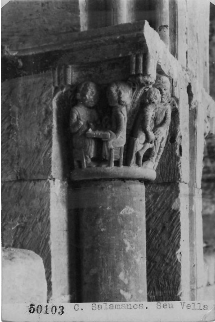
50103 C. Salamanca. Seu Vella