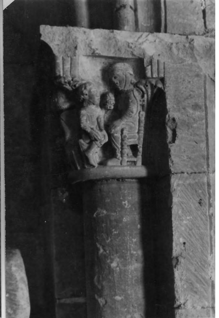
50098 C Salamanca. Seu Vella