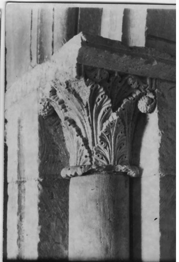
50100 C Salamanca. Seu Vella