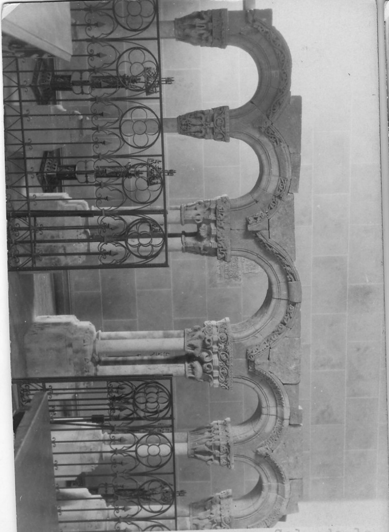
50492 C Salamanca Col. de la Vega