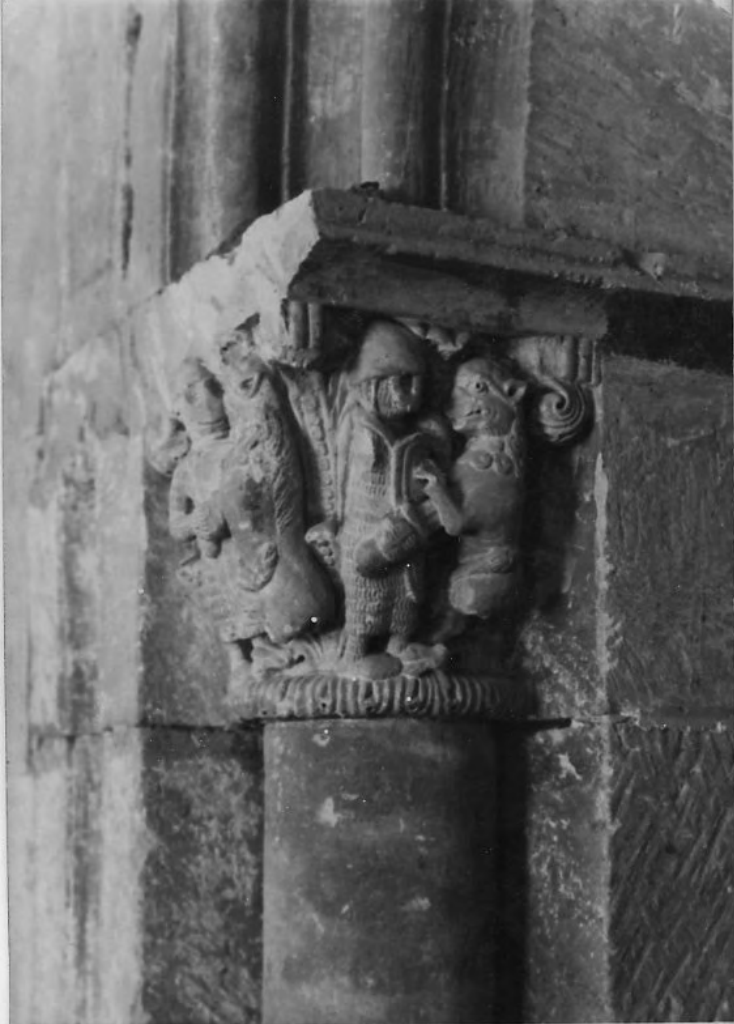
50099 C Salamanca. Seu Vella