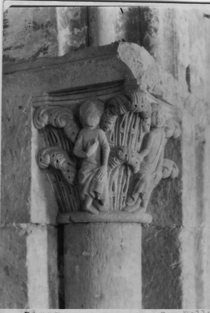
50108 c Salamanca = Seu Vella