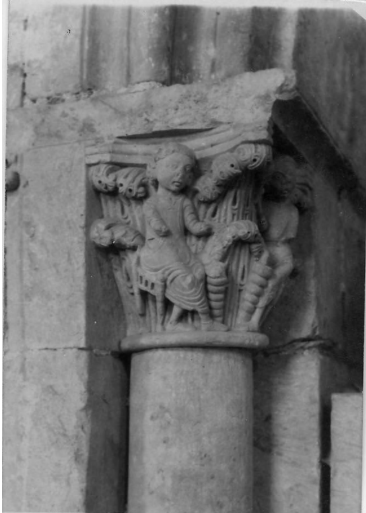
50107 c. Salamanca. Seu vella