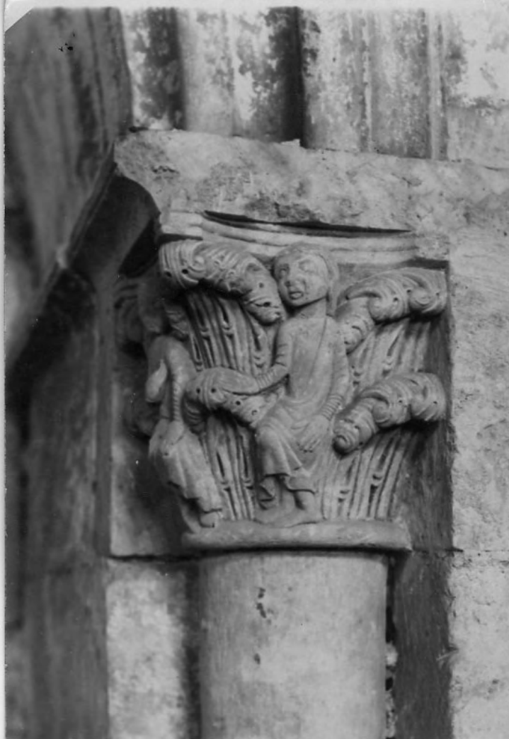
50106 c Salamanca. Seu Vella