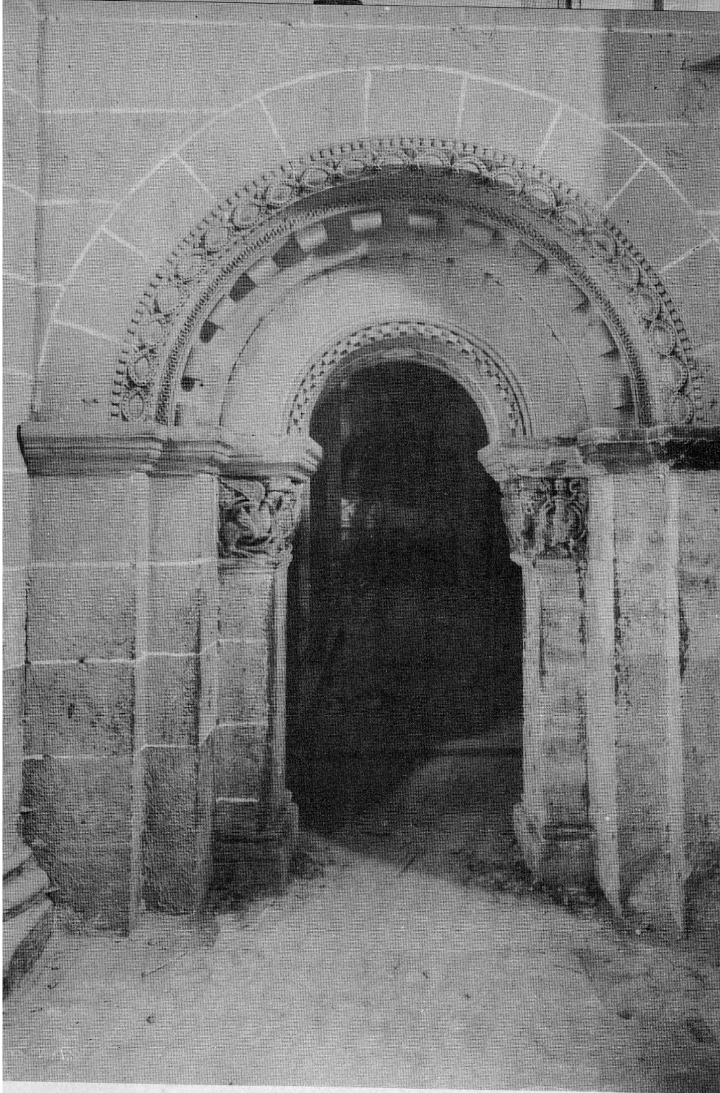
SALAMANCA. Catedral vieja: Portada del claustro, hacia la iglesia (pág. 99)