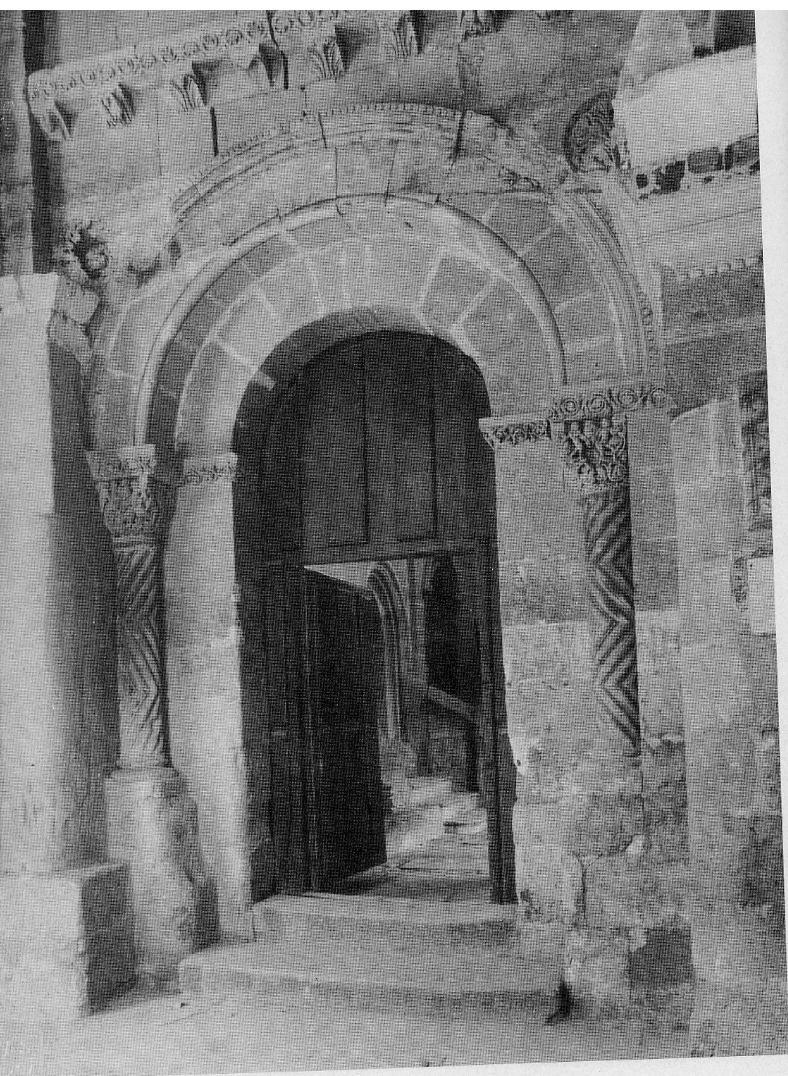
34. SALAMANCA. Catedral vieja: Portada lateral de la capilla mayor (pág. 99)