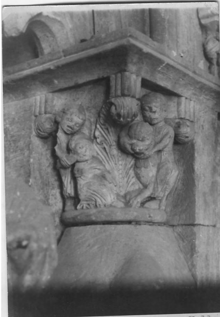
50109 c Salamanca. Seu Vella