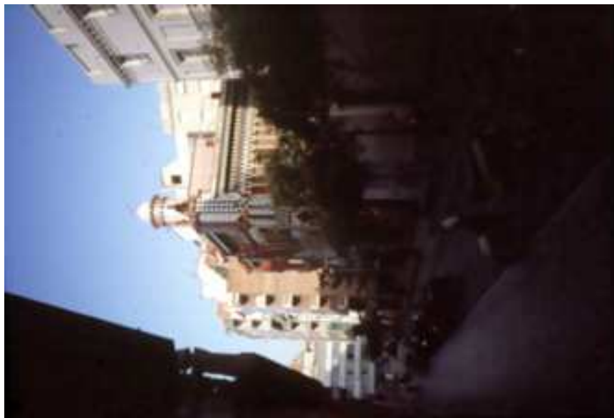
Carrer de les Carolines. Vista en direcció oest