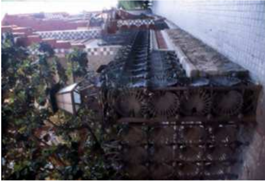
Detall tanca façana del carrer de les Carolines