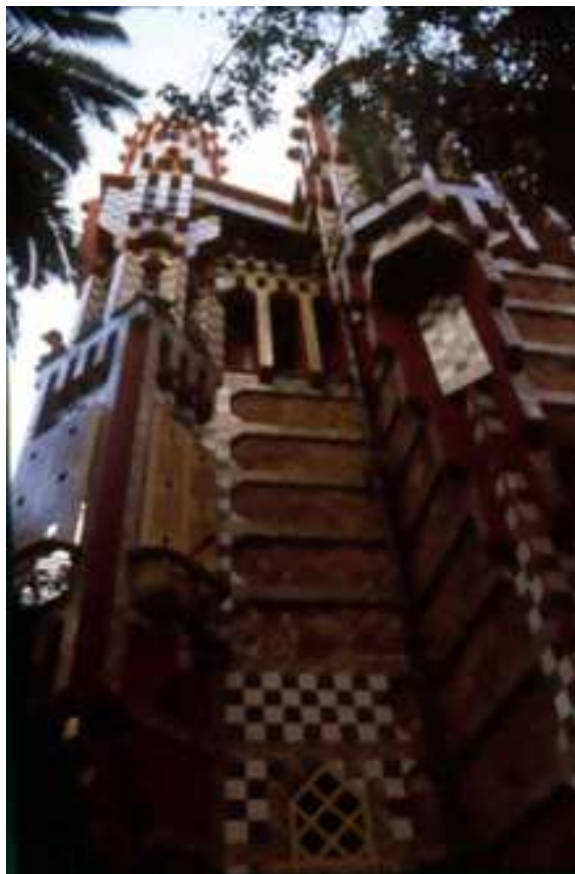
Detall remat façana del jardí