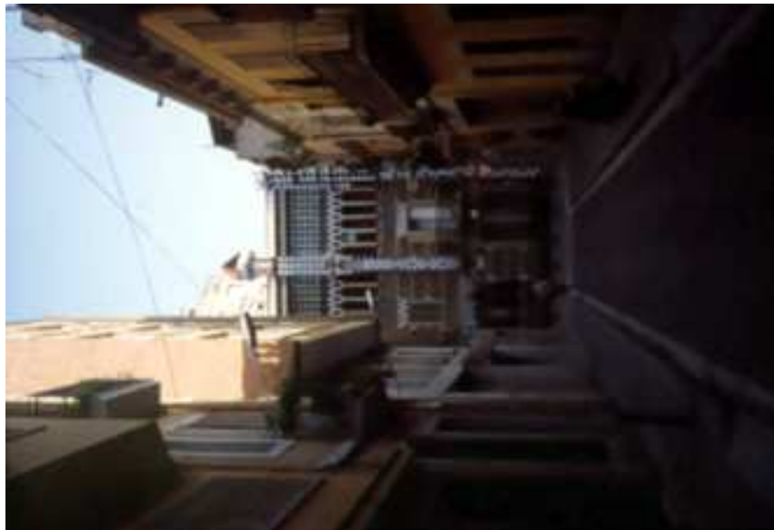
Façana a carrer de les Carolines. Vista general des del carrer d'Aulestia i Pijoan