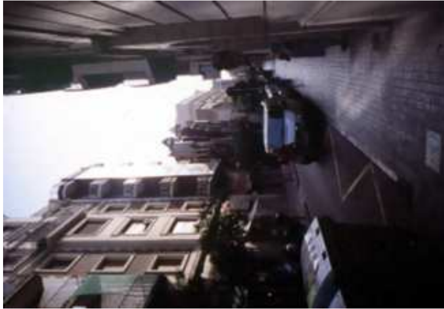
Carrer de les Carolines. Vista en direcció est des de la vorera sud