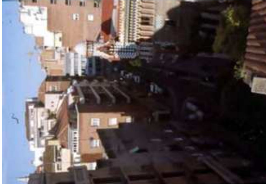
Carrer de les Carolines. Vista en direcció oest