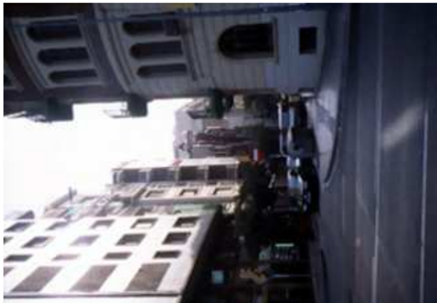
Carrer de les Carolines. Vista en direcció est des de cantonada amb l'avinguda del Príncep d'Astúries