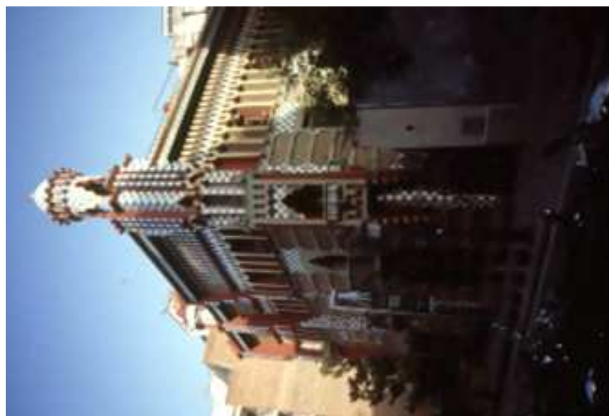
Façana a carrer de les Carolines. Vista cantonada