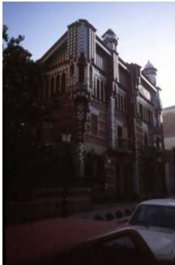
Carrer de les Carolines. Vista en direcció est