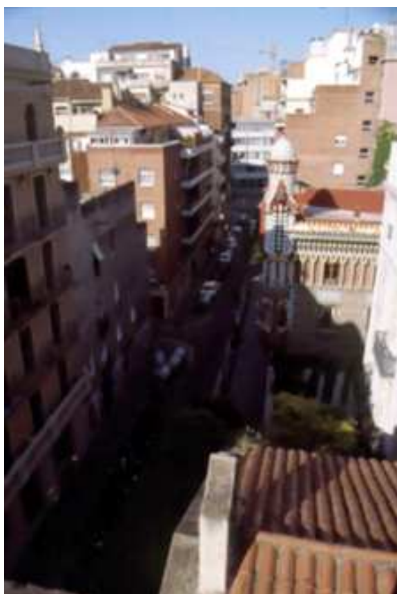
Vista conjunt de parcel·les de l'Avinguda Príncep d'Astúries des de la parcel·la núm. 10 del carrer de les Carolines